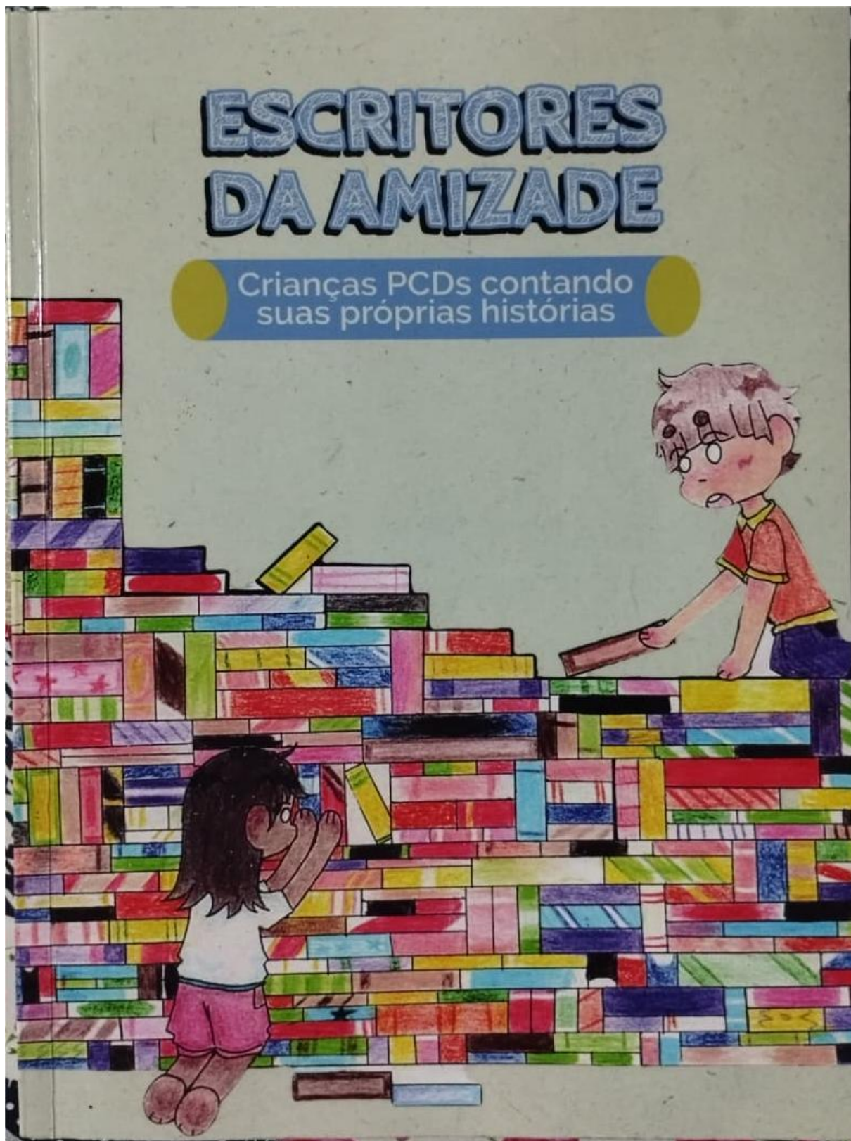
Figura 1 - Capa do livro Escritores da Amizade: Crianças PCDs contando suas próprias histórias