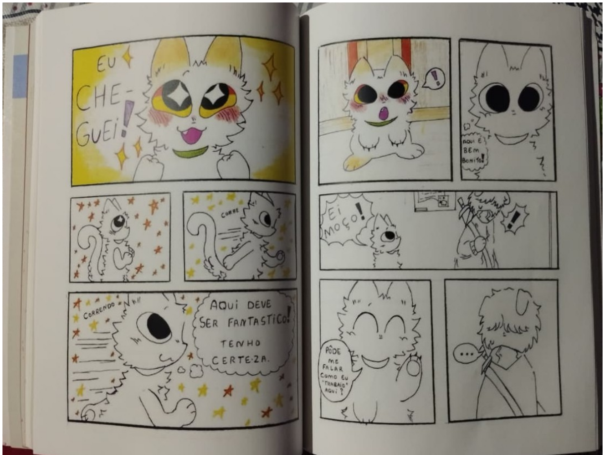
Figura 4 - Página interna do quadrinho produzido pela criança