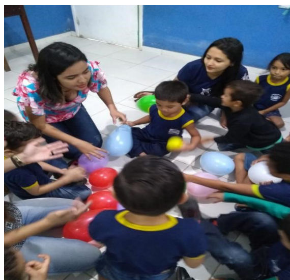
Figura 4. Dados do trabalho de campo.