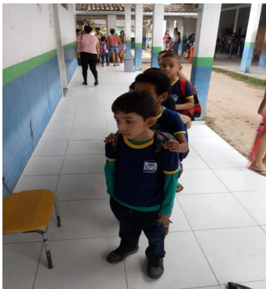
Figura 2. Dados do trabalho de campo.

Na atividade todas as crianças interagiram de forma positiva e escolheram as formas de se cumprimentar com facilidade, demonstrando afetividade para com as colegas e as professoras.