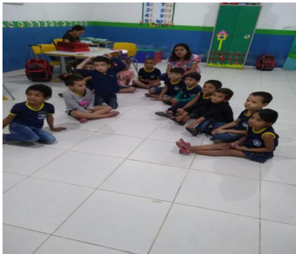
Figura 5. Dados do trabalho de campo.

Com o foco na aprendizagem e envolvimento coletivo, a turma foi dividida em dois grupos (figura 5.). Em seguida foi apresentado um jogo da memória aos alunos contendo números de 1 a 10 na parte da frente (figura 6.), e na parte de trás, pares de figuras geométricas com cores distintas (figura 7.).