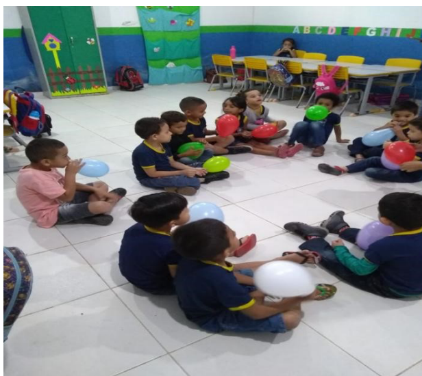
Figura 3. Dados do trabalho de campo.

Em continuidade à dinâmica, a professora apresentou perguntas, instigando-os a refletir, através de uma comparação entre balões e pessoas, para que compreendessem que assim como os balões possuíam cores e tamanhos diversificados, as pessoas também apresentam essas diferenças. Assim, usando essa comparação se torna viável o desenvolvimento das "(...) capacidades de socialização, por meio da interação, da utilização e experimentação de regras e papéis sociais presentes nas brincadeiras" (Modesto; Rubio, 2014). De acordo com as figuras 4 e 3.