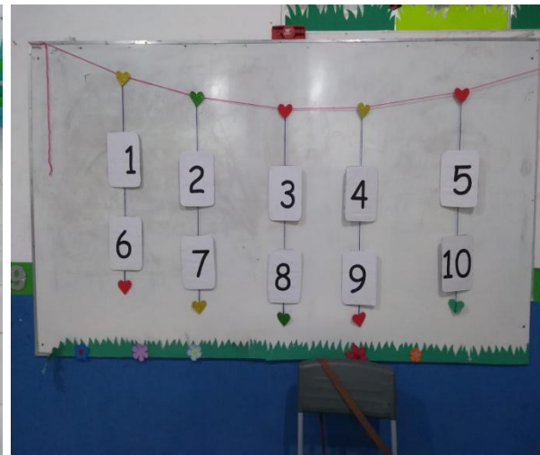
Figura 6. Dados do trabalho de campo.