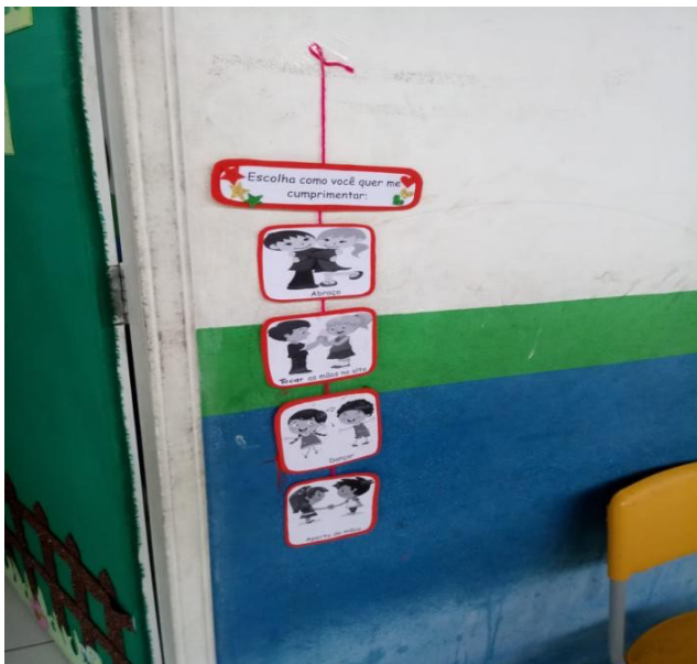
Figura 1. Dados do trabalho de campo.

possuem modos singulares de se comunicar e se relacionar com o outro, tornando viável as crianças com deficiências participarem ativamente.