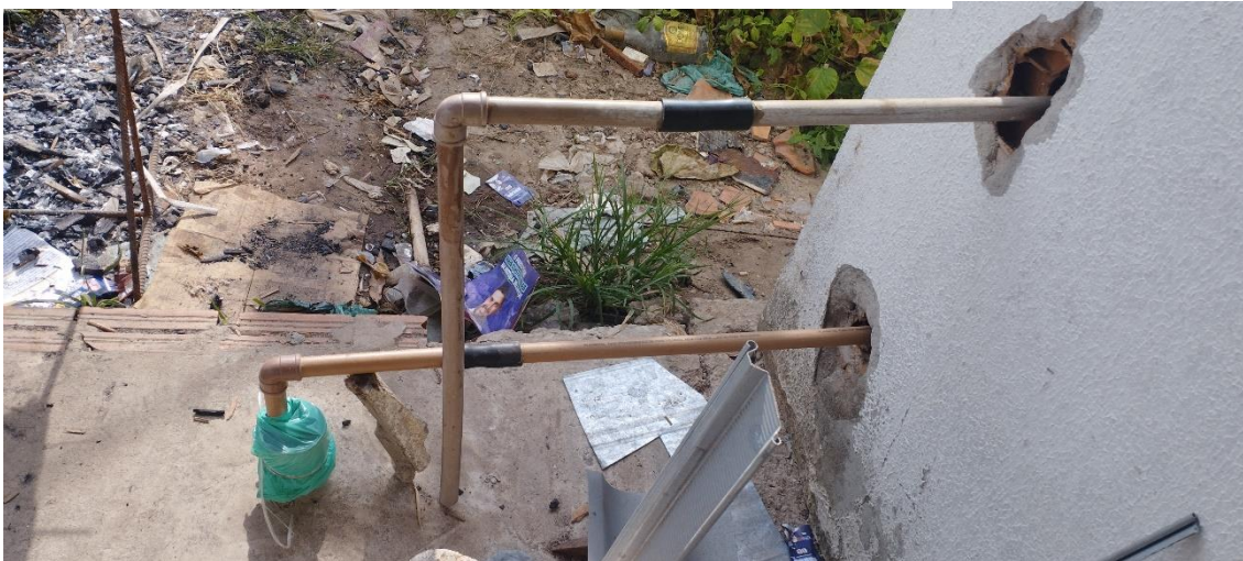
Figura 7: Poço artesiano de morador do conjunto parque encantado