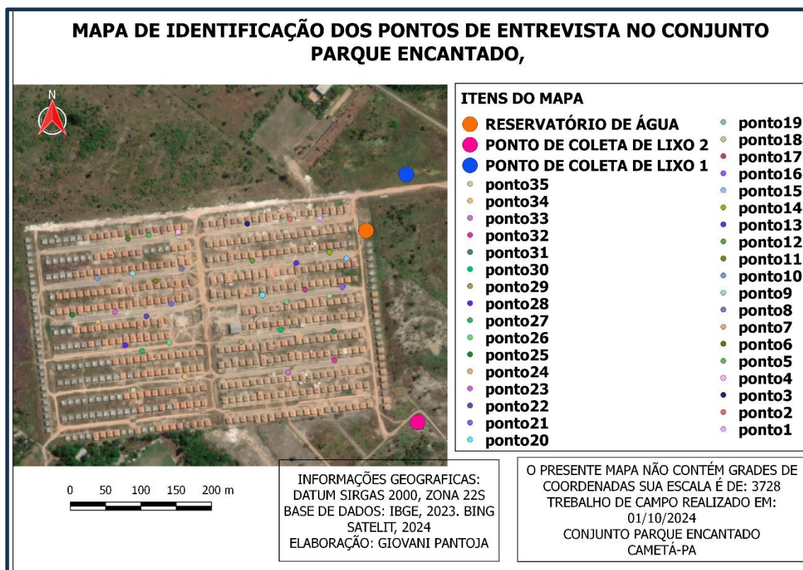
Mapa 3- PONTOS DE ENTREVISTA

Para fundamentar este trabalho no contexto de segregação socio espacial, foi necessário entender o cotidiano e as condições de existência e resistências das famílias do conjunto parque encantado, estudar os aspectos intraurbanos que envolve a cidade é necessário, para isso foi elaborado uma pesquisa em campo, com o objetivo de extrair informações para o embasamento do estudo, um roteiro de perguntas semiestruturadas de caráter qualitativo e quantitativo foi aplicado.