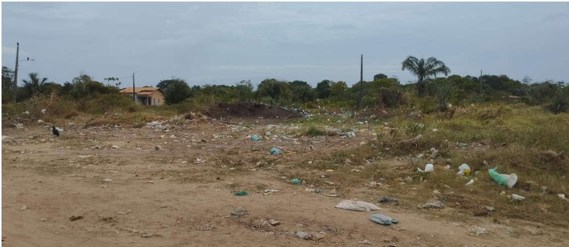
Figuras 5 e 6: locais de despejo e coleta de lixo do conjunto Parque Encantado

caminhão venha recolher, o conjunto tem dois locais de coleta como podemos ver nas figuras 5 e 6