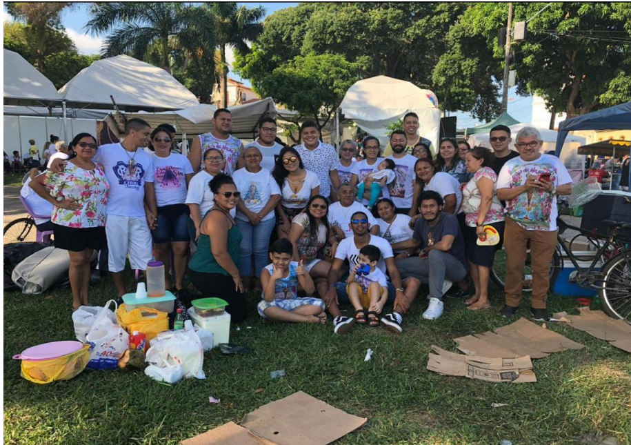
Imagem 03 - Família Souza no Círio de Nazaré (2018).