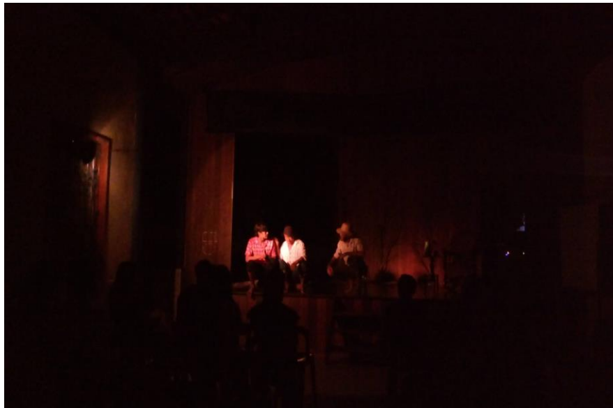
Imagem 06 - Cena do espetáculo Cidade dos Pássaros (2017).