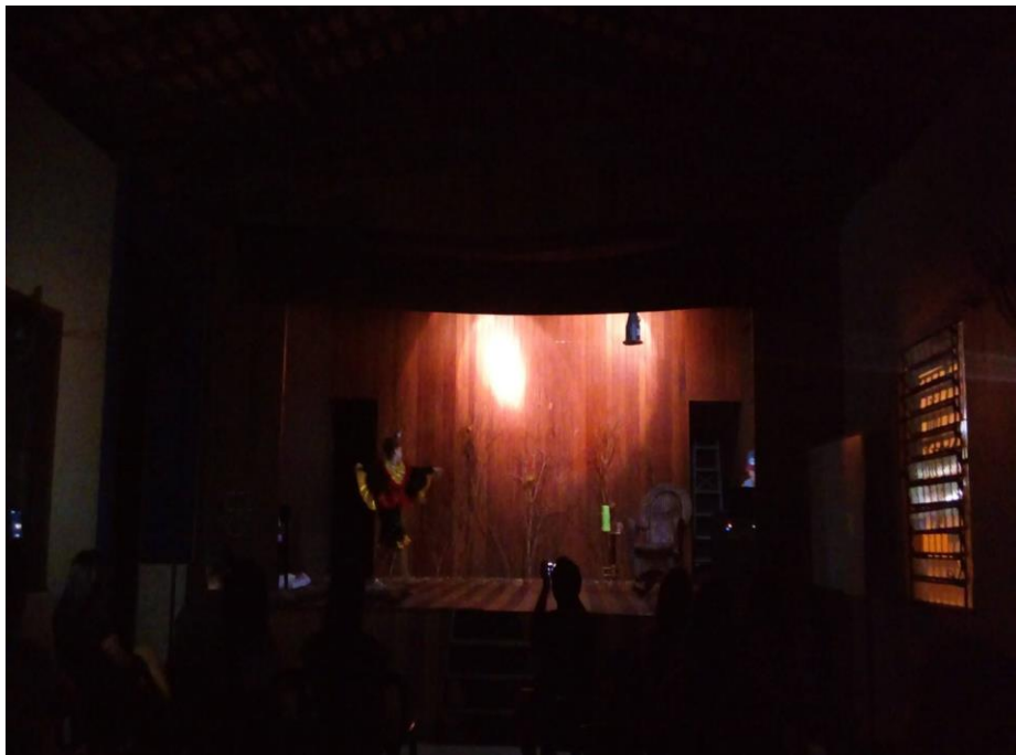
Imagem 07- Cena do espetáculo Cidade dos Pássaros (2017)

A partir da experiência adquirida no projeto, pude perceber que hoje tenho um maior interesse pela produção artística, pois o fazer artístico, no que diz respeito à criação cênica, foi uma descoberta que me surpreendeu, já que ainda não tinha essa experiência de produzir algo, como uma dramaturgia, a construção de cenas, a preparação de atores para o espetáculo, a iluminação, o cenário. Tudo isso já havia experimentado pelo lado da teoria, no curso de graduação em teatro, porém, a prática que pude exercer no projeto me enriqueceu muito, em todos os sentidos da minha história artística, além de ser hoje um combustível que me impulsiona a seguir no ramo da produção artística.