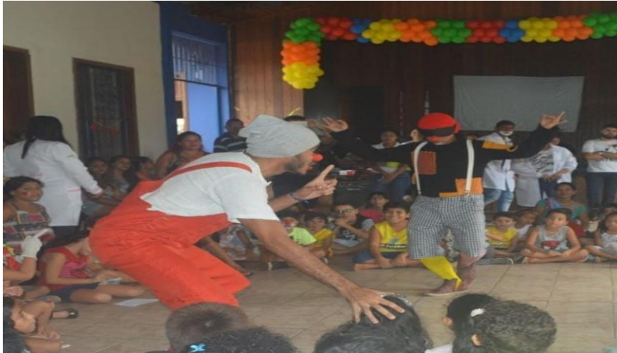
Imagem 05 - Os Palhaços Mensageiros na ONG CSCA (2017).