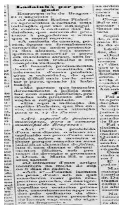
Imagem nº 02

Diário de Notícias 15 de novembro de 1884.