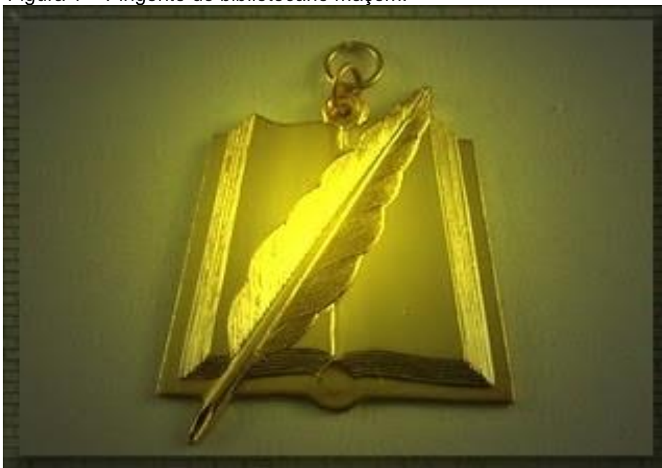
Figura 1 – Pingente do bibliotecário maçom.