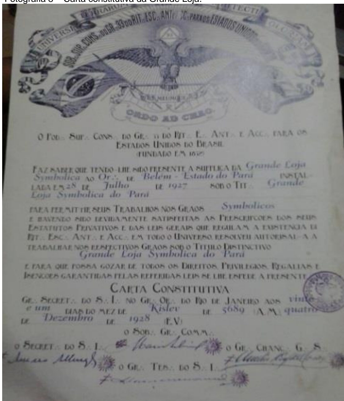
Fotografia 8 – Carta constitutiva da Grande Loja.