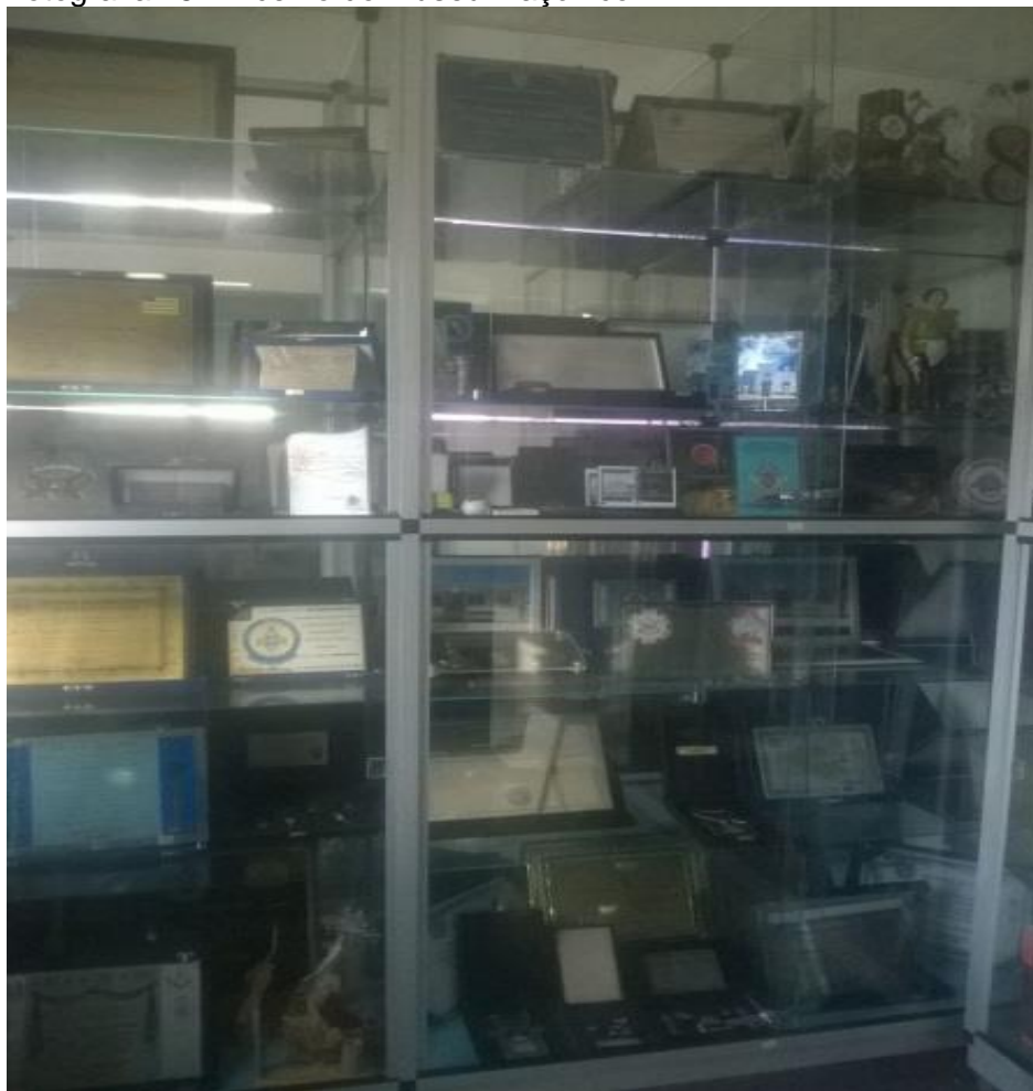
Fotografia 15 – Acervo do Museu Maçônico.

Na Fotografia 15 mostramos o acervo do Museu Maçônico, Irmão Antônio Pereira Mendes onde estão expostos, documentos históricos, obras raras e equipamentos maçônicos.