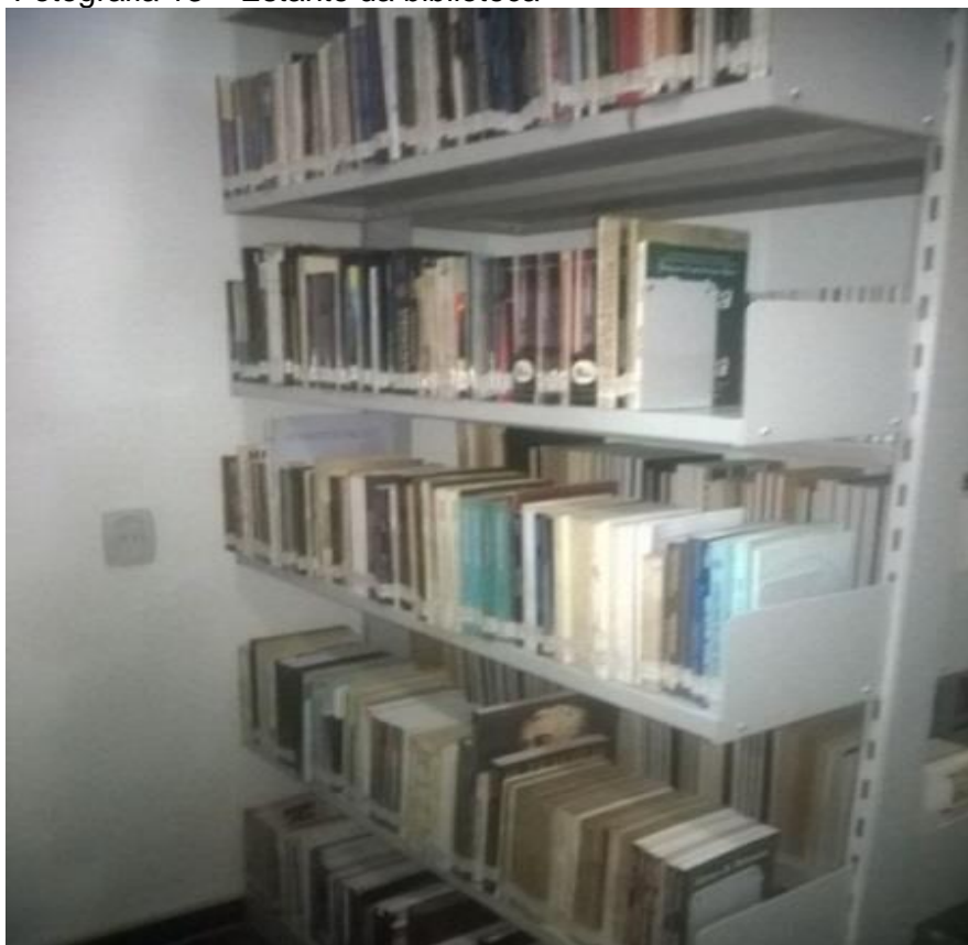
Fotografia 13 – Estante da biblioteca