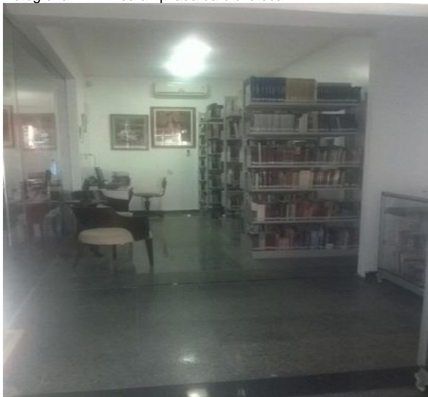
Fotografia 14 – Área ampliada da biblioteca.