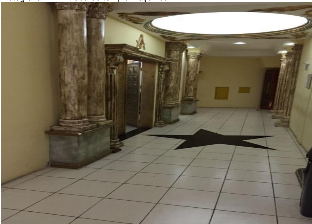
Fotografia 1 – Entrada do templo maçônico.