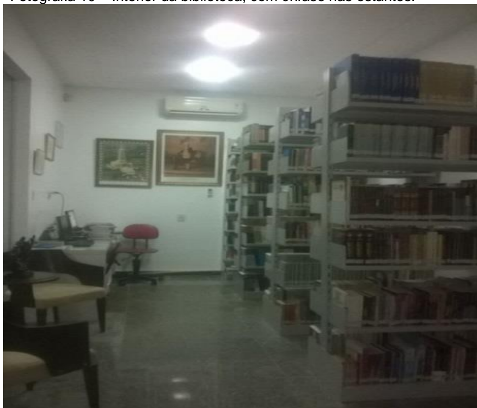
Fotografia 10 – Interior da biblioteca, com ênfase nas estantes.