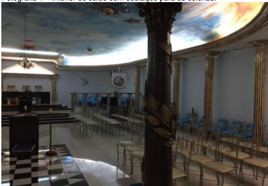
Fotografia 4 – Interior do salão com destaque para as colunas.

dualidade ou dualismo da natureza humana, o bem e o mal, espírito e corpo, virtude e vício, luz e escuridão etc, e sobre este piso observa-se o altar dos juramentos onde estão sempre sobre ele os livros sagrados constituídos pela Bíblia, o Alcorão e a Torá ou Pentateuco, assim como o compasso e o esquadro. Nota-se também nas fotografias ao fundo, o trono que é ocupado pelo Grão-Mestre. Todas as Lojas Maçônicas e seus Templos, fazem referência ao Templo do Rei Salomão