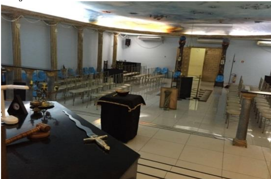
Fotografia 3 – Trono do Grão-Mestre.