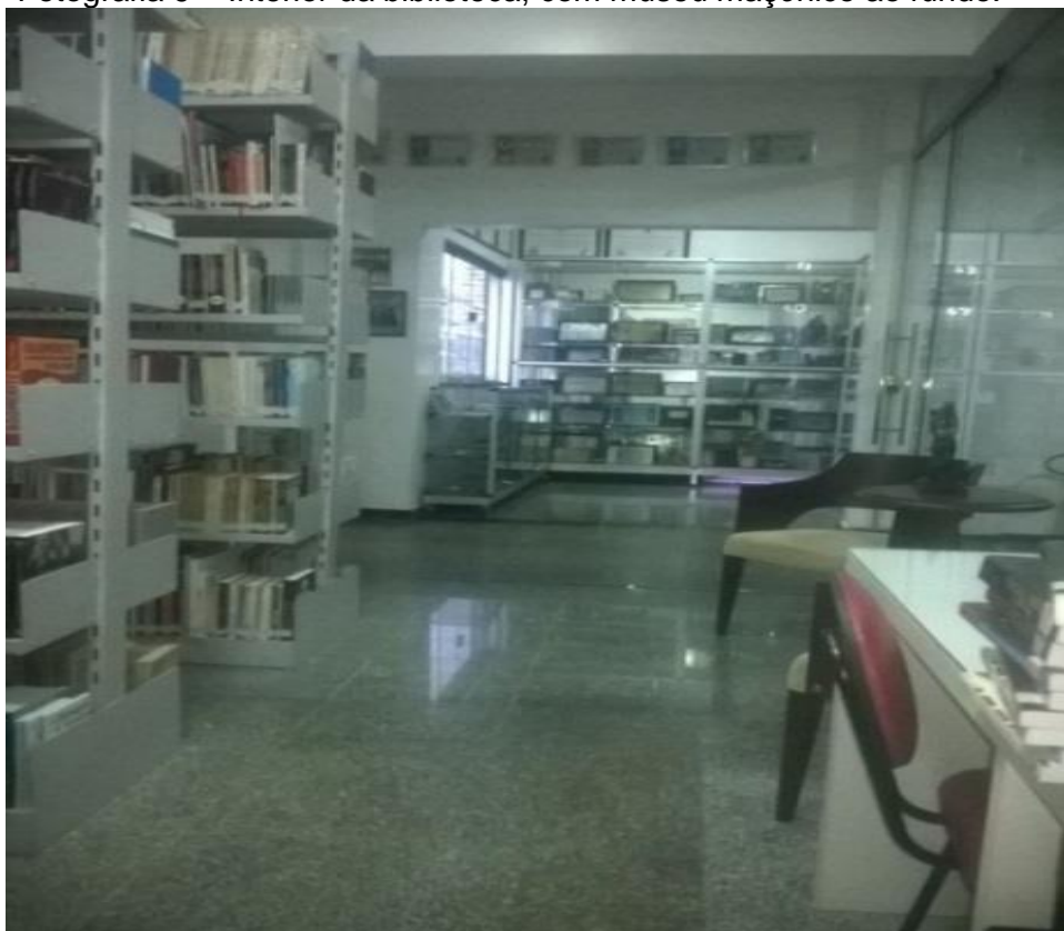
Fotografia 9 – Interior da biblioteca, com museu maçônico ao fundo.