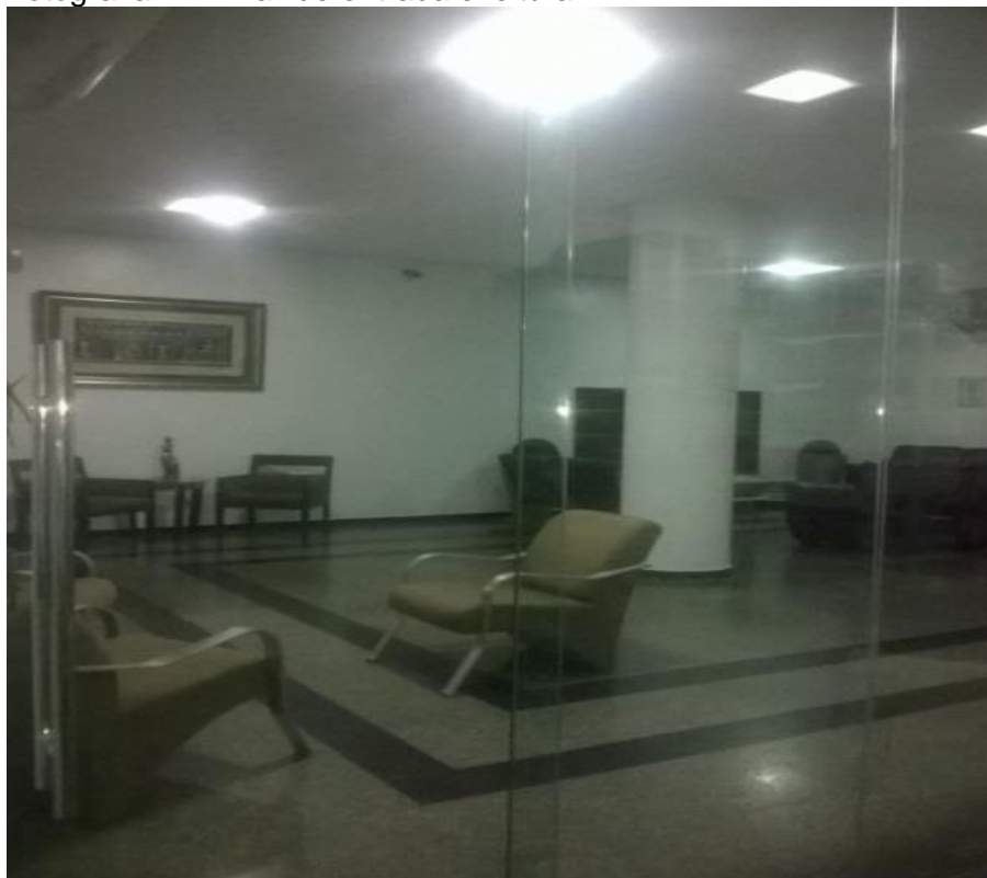
Fotografia 11 – Hall de entrada e leitura.

Nas Fotografias 11 e 12 vê-se uma panorâmica do hall de entrada que é uma área contígua à Biblioteca e serve de espaço para leitura e pesquisa das obras da Unidade de Informação.