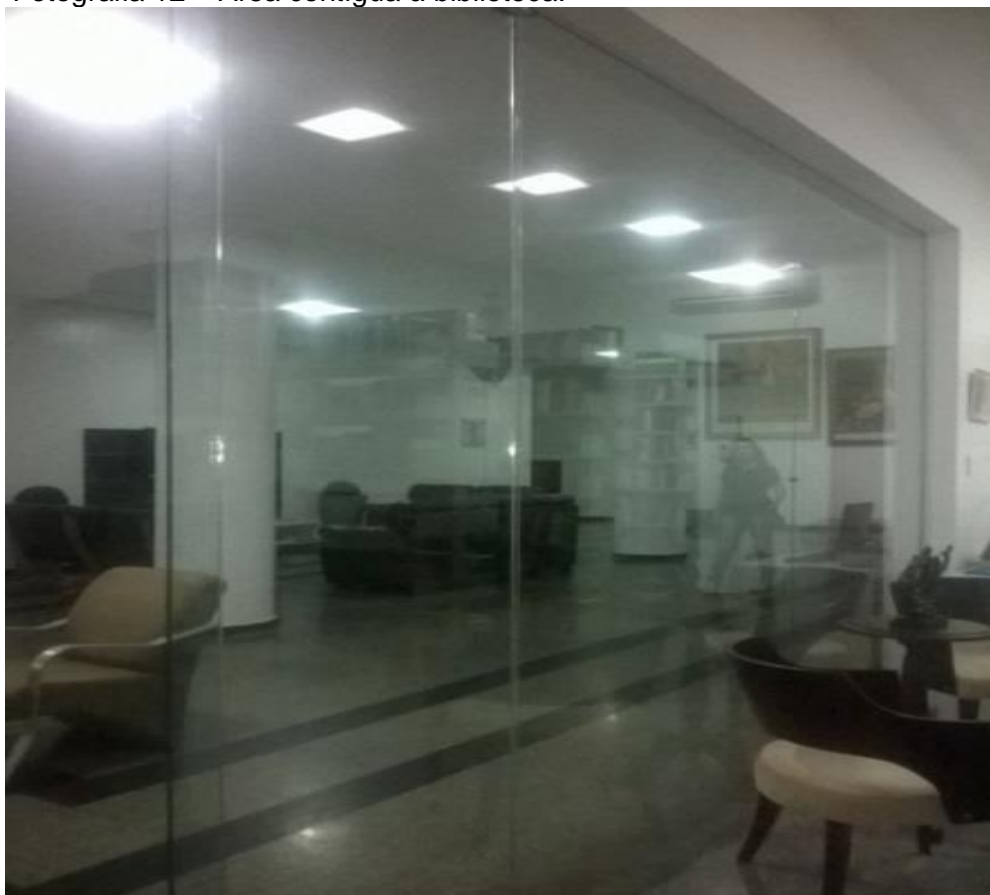
Fotografia 12 – Área contígua à biblioteca.