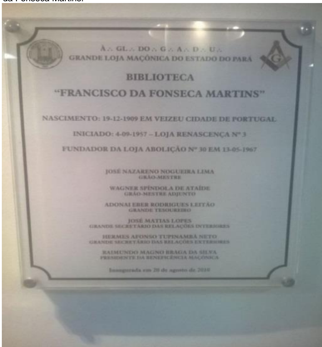
Fotografia 6 – Placa comemorativa da inauguração da biblioteca irmão Francisco da Fonseca Martins.