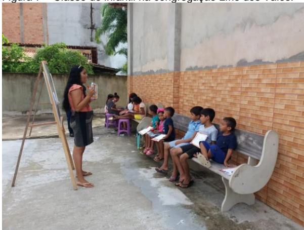
Figura 7 – Classe de infantil na congregação Lírio dos Vales.