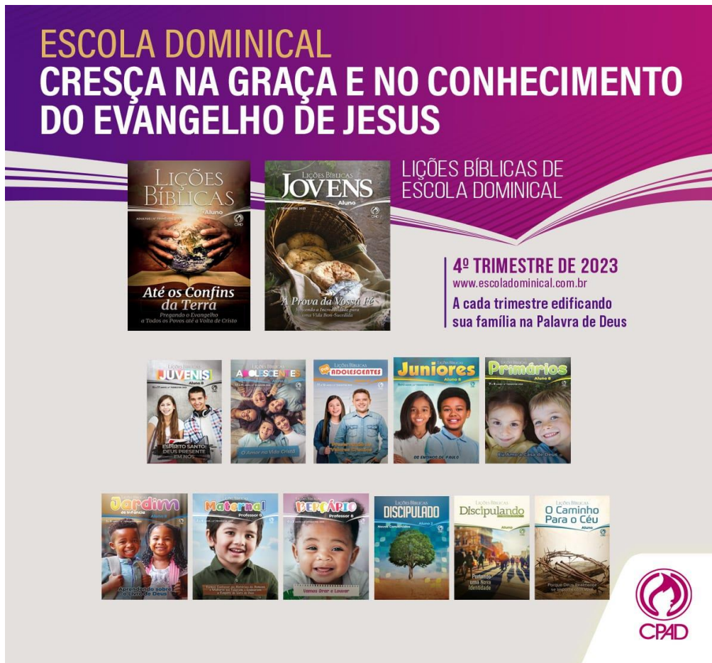
Figura 1 - Revistas de Lições Bíblicas do 4º Trimestre de 2023.

Cada lição é distinta em conteúdo e adaptada para uma melhor compreensão pelos alunos. Um exigem maior grau de conhecimento, já outras exigem pouco nível de conhecimento, variando de acordo com o público focalizado na aula. Por isso, as Revistas de Lições Bíblicas são o principal meio didático empregados nas aulas da EBD, além da Bíblia Sagrada. Como disse o apóstolo Paulo: “Toda Escritura é devidamente inspirada e proveitosa para ensinar, para repreender, para corrigir, para instruir em justiça; para que o homem de Deus seja perfeito, e perfeitamente preparado para toda boa obra” (2Tm 3.16,17). Considerando o exposto e o locus da pesquisa, perguntamos aos colaboradores da investigação: quais conteúdos ou temáticas fazem parte dos estudos desenvolvidos pela EBD? Seguem as respostas: