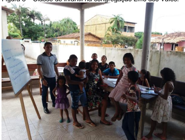
Figura 8 – Classe de infantil na congregação Lírio dos Vales.