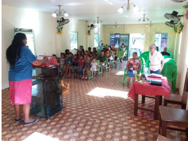
Figura 3 – Chamada dos Professores na Congregação Betel.