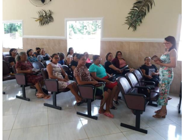
Figura 4 – Classe dos senhores na congregação Lírio dos Vales