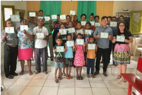
Figura 12 – Confraternização da EBD na congregação Monte Carmelo (Quilombo de Bacabal)