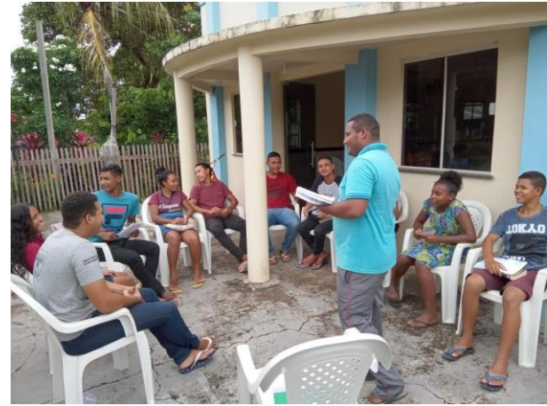
Figura 6 – Classe de adolescentes na congregação Nova Jerusalém.