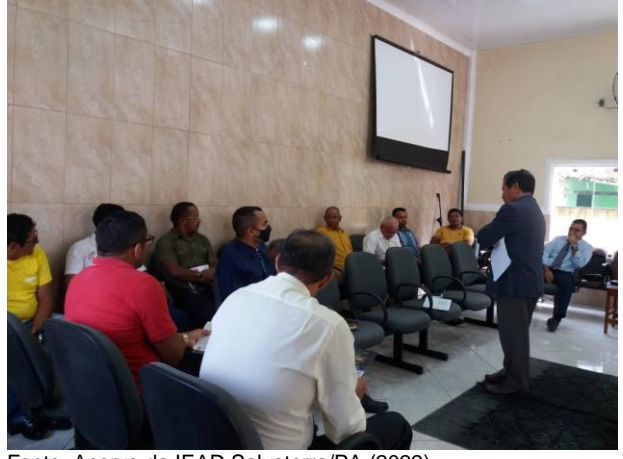
Figura 2 – Classe dos senhores na congregação Lírio dos Vales