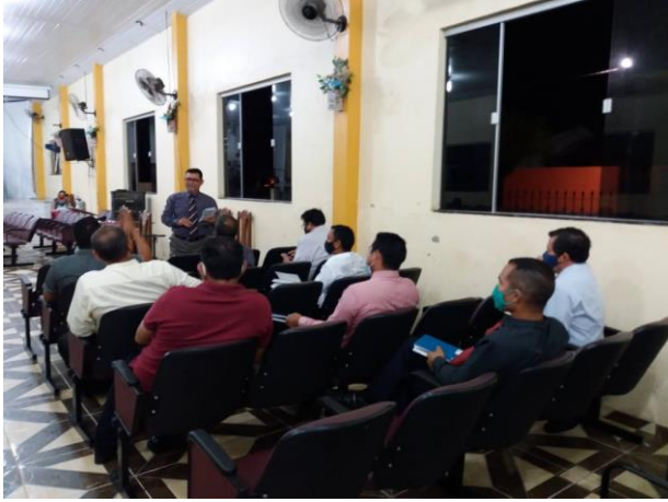
Figura 1 - Classe dos senhores da EBD no Templo Central da IEAD Salvaterra.