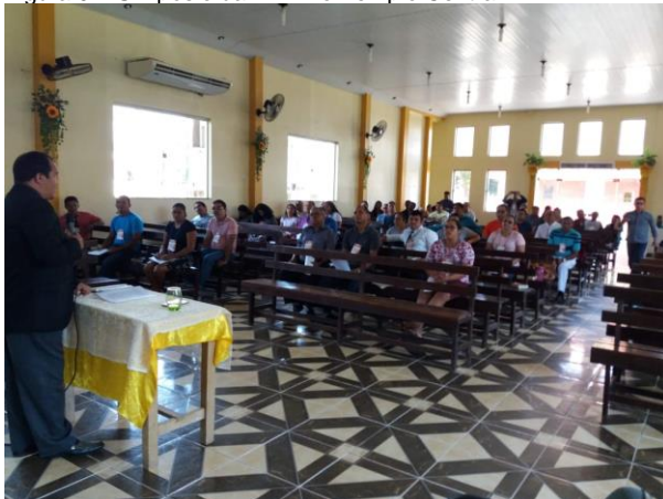
Figura 9 – Simpósio da EBD no Templo Central.