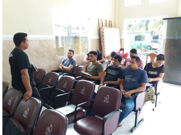
Figura 5 – Classe de jovens na congregação Lírio dos Vales.