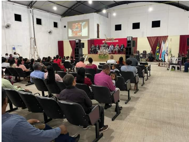
Figura 10 – Conferência da EBD no “Ivanção”.