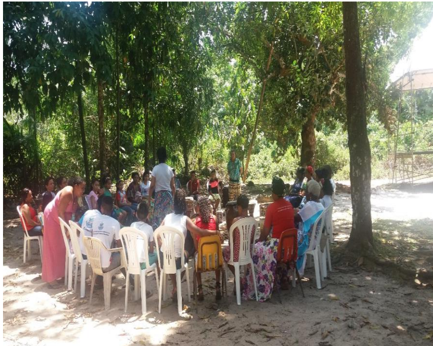
Figura 5 - Comunidade reunida para formação política.