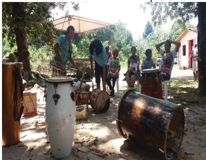
Figura 4 - Pastoral afro – CNBB. Atividade de percussão em Abacatal