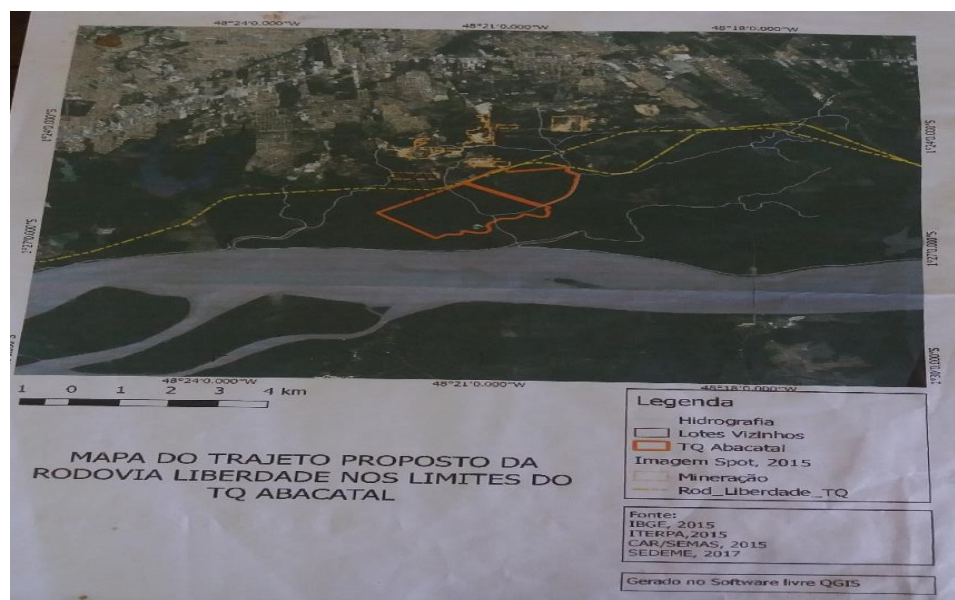
Figura 2 - Mapa da rodovia da liberdade.