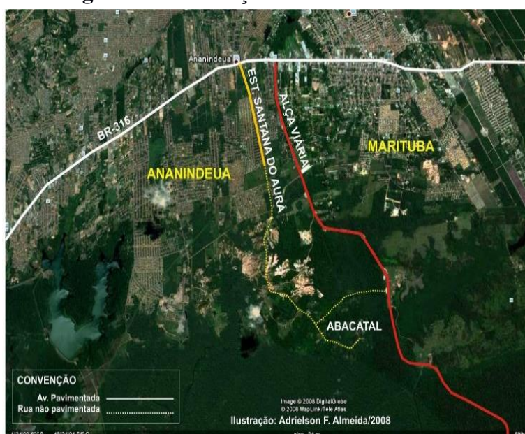
Figura 1 - Localização da comunidade Abacatal