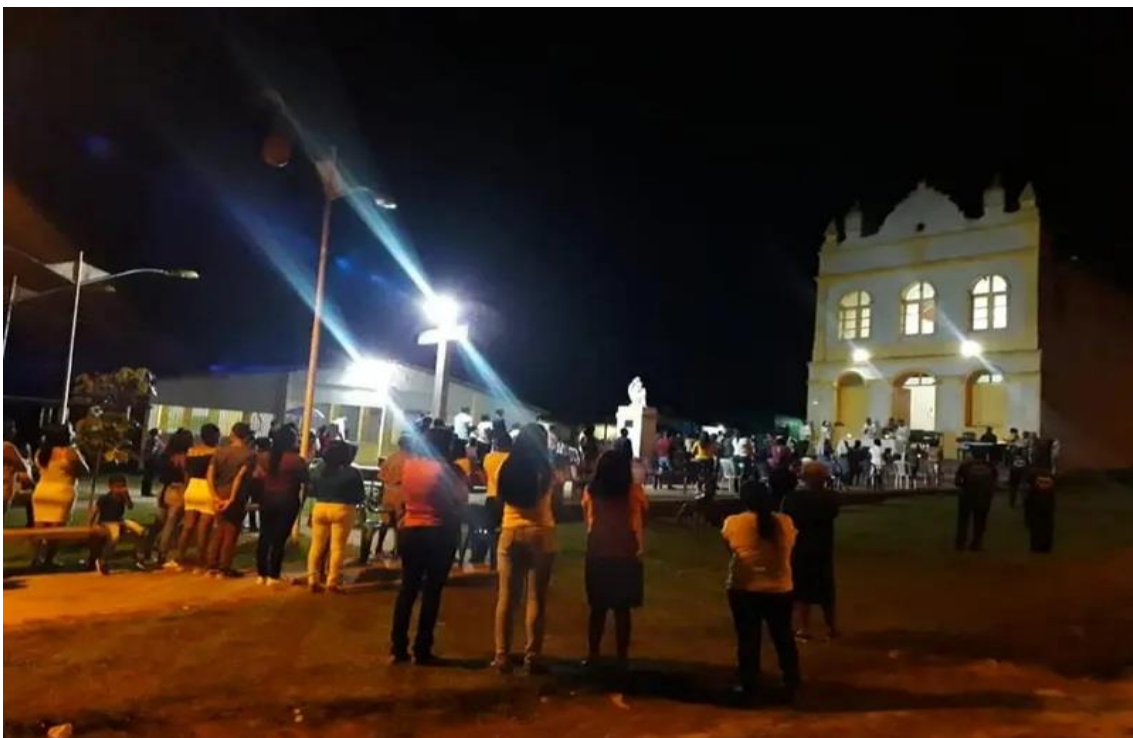
Figura 7 Momento da celebração da 1ª noite de arraial celebração campal do lado de fora da igreja. (Fonte arquivo pessoal).

Portugal país que inseriu no Brasil a devoção e costumes de festejar Santos e Santas, a igreja católica colaborou para que tais festas populares religiosas introduzidas e difundidas como