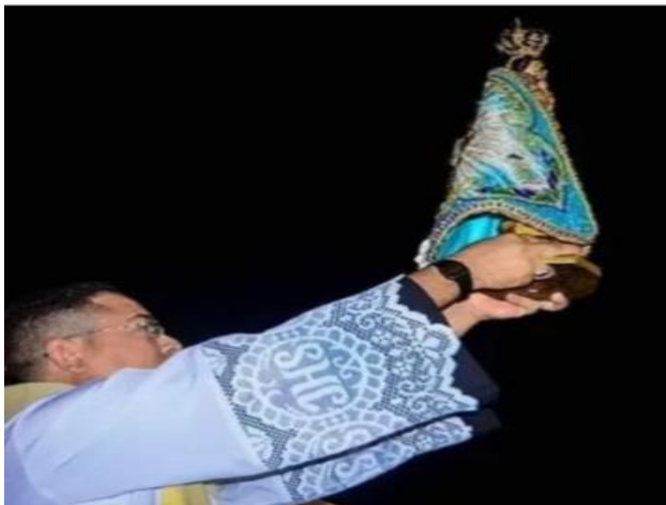
Figura 8. Apresentação da Santa Padroeira a comunidade.

simbologia e que no decorrer dos anos reunissem cada vez mais devotos (Nascimento, 2007 apud Macena, 2010).