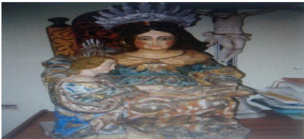
Figura10. Imagem de Santana Mestra padroeira, na Igreja de Santana de Bujaru-Bujaru/PA. Possivelmente herança carmelita.

A figura anterior mostra a imagem da santa padroeira no altar da igreja, esta imagem fica dentro da igreja e não sai em procissão existe uma outra imagem que sai nos andores, ou seja em romarias.