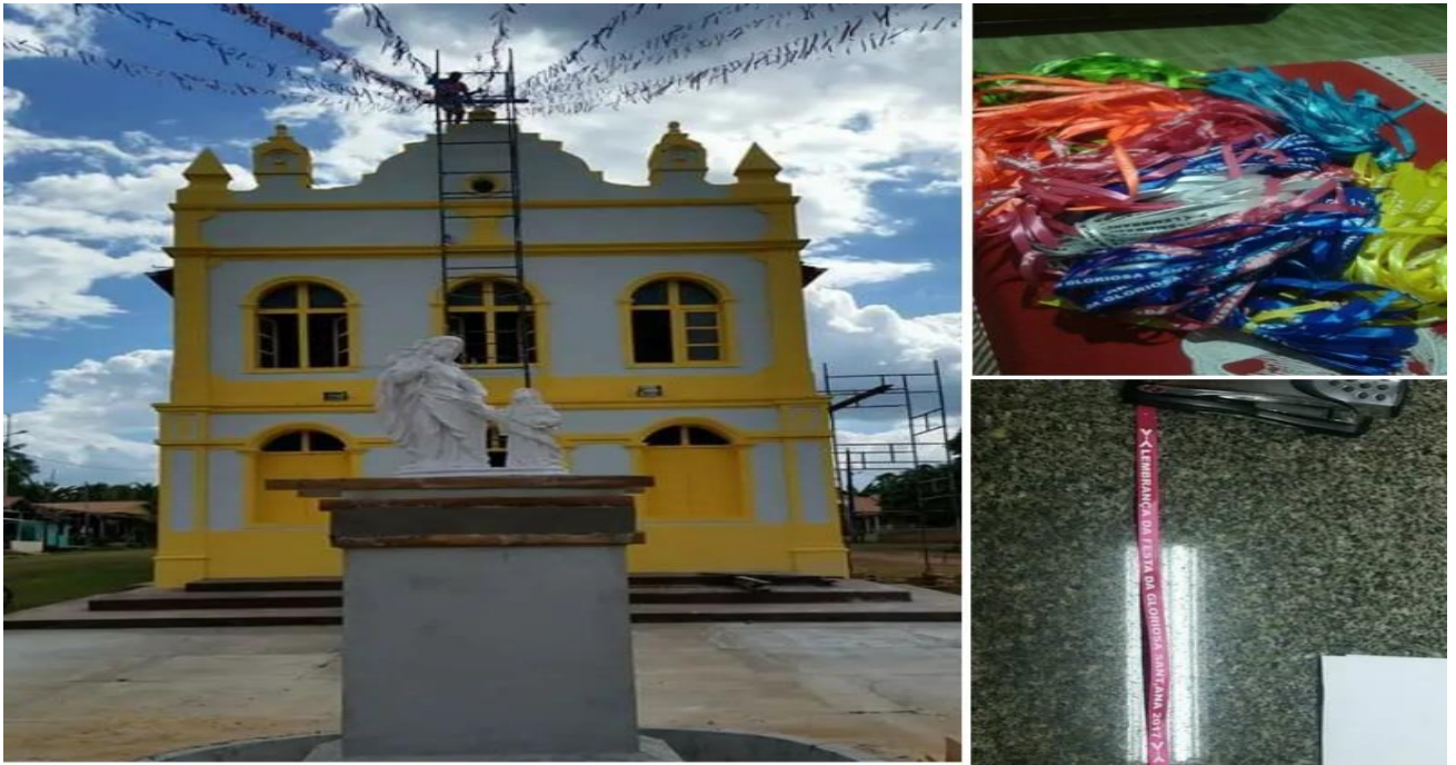
Figura 6 Igreja de Santana sendo ornamentada para o momento da tão esperada festa, mais as fitinhas dos promesseiros.(Fonte arquivo pessoal).