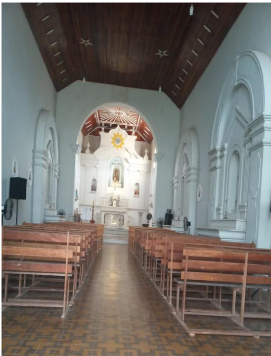
(FIG.4) dentro da Nave da capela Mor.