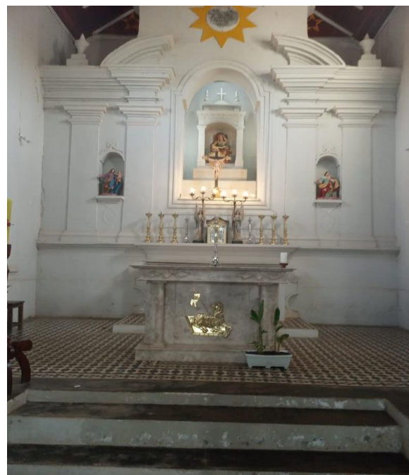
(FIG.5) O Altar consagrado.

As imagens colocadas nos altares são para lembrar a importância histórica de cada santo ou Santa, onde cada um tem sua própria historia e seu