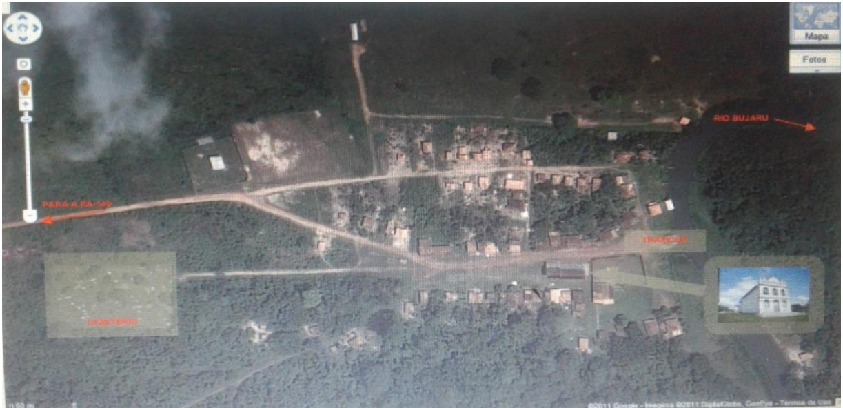
Figura 12: vista aérea da comunidade de Santana do Bujaru, com indicação da localização da igreja de Santana.