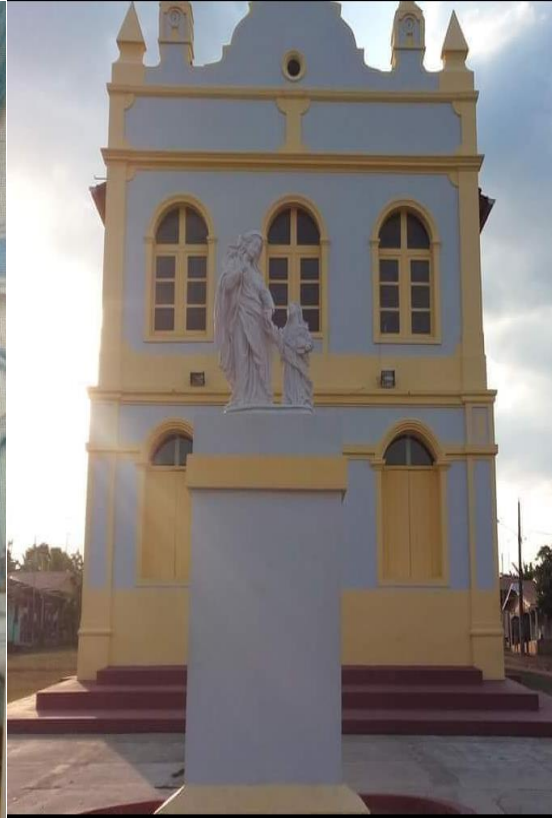
(FIG. 3) Igreja Reformada com Sant'Ana bem na frente.