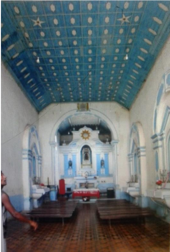
(FIG. 2) Antes da reforma