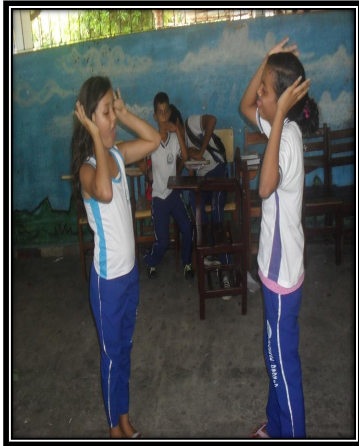
Figura 7 - Jogo do espelho