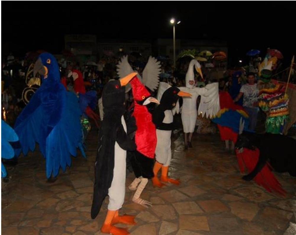
Figura 3- Bicharada do Juaba

Um das manifestações folclóricas carnavalescas que existe em Cametá é chamada de “bicharada”, nome recebido devido à perfeição nos gestos e aparência dos animais, principalmente da Fauna Amazônica, originado no Distrito de Juaba, um dos polos culturais de Cametá (Wanzeller, 2014).