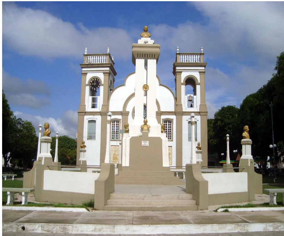
Figura 1- Praça dos notáveis e ao fundo a Igreja de São João Batista.