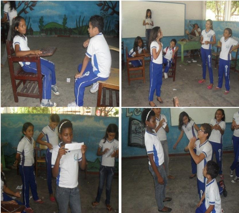
Figura 10 - Ensaaios da Peça.