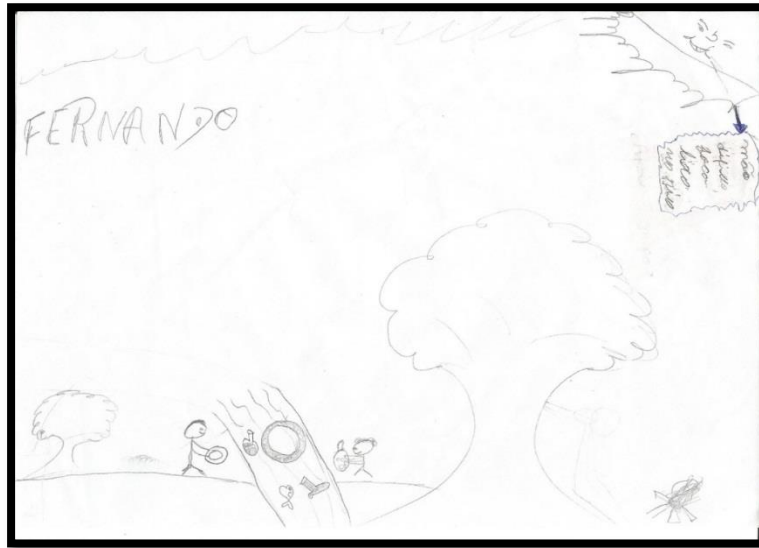
Figura 4- Desenho; poluição dos rios.