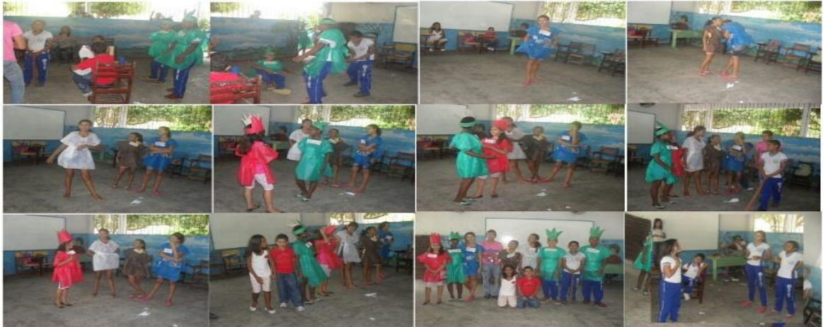
Figura 11 – Apresentação das cenas da Peça.