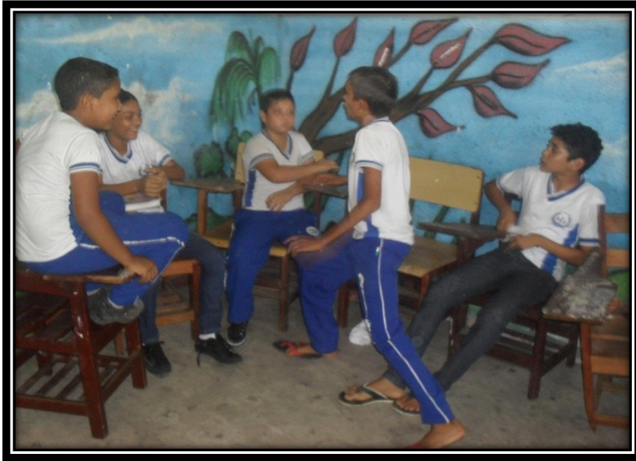
Figura 9 - Jogo de atitudes.