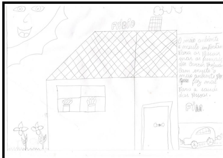
Figura 5- Desenho; poluição do ar ocasionada pela fumaça dos automóveis e chaminés das fábricas.