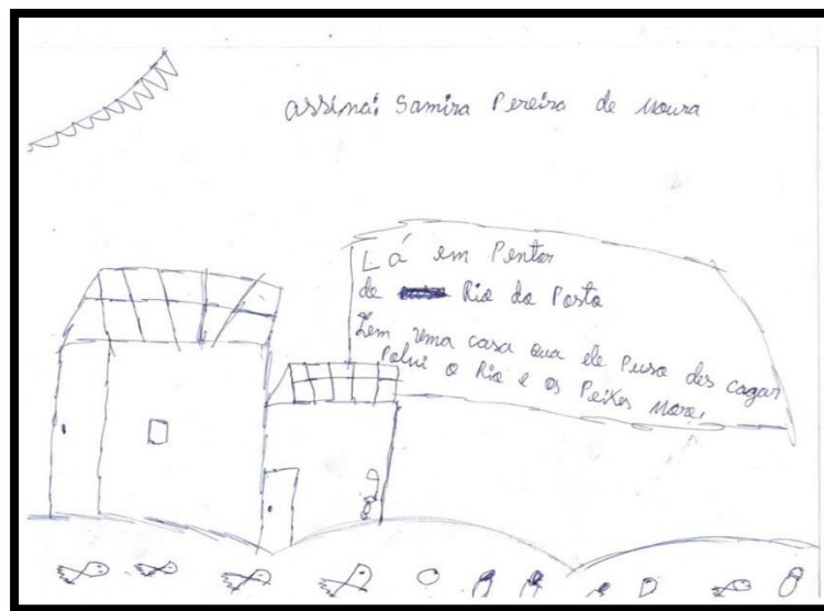
Figura 6 - Desenho; poluição dos rios, esgoto sem tratamento caindo diretamente em nossos rios.