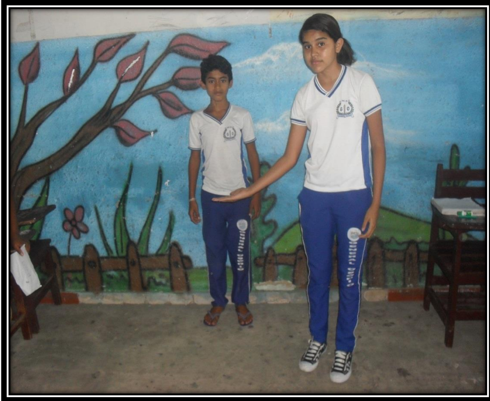
Figura 8: Jogo da escultura