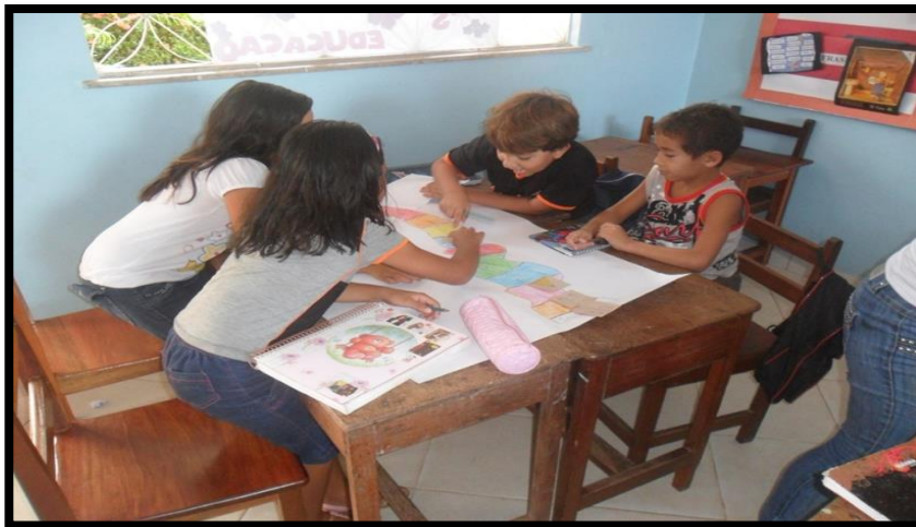
Figura - 6: Alunos participando do jogo da trilha

Como podemos observar na fotografia 6 onde demonstra a empolgação dos alunos ao tentarem realizar a atividade proposta.