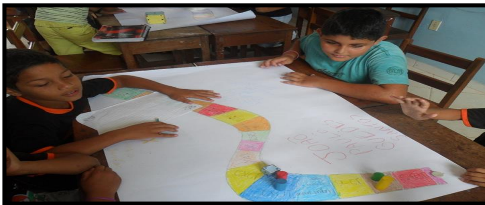
Figura - 4: Alunos após o termino da confecção do Jogo Trilha das operações

O professor deve auxiliar os alunos a desenhar uma trilha na cartolina e pintar, depois em cada casa da trilha devem ser escritas operações contendo as quatro operações aritméticas. Em algumas casas da trilha deve ser escrita expressões com: volte 2 casas, avance 3 casas, volte ao início da trilha, e etc. Na fotografia 4 podemos conferir o final deste processo de confecção.