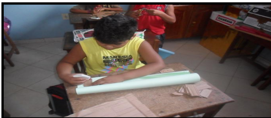
Figura – 2: Aluno confeccionado o Dominó Matemático

O professor deverá ajudar os alunos a cortarem no papelão 28 peças no formato de dominó (retângulo), em seguida, encapar um lado das peças com a cartolina. Podemos observar este momento na fotografia 1 logo abaixo onde mostra os alunos no processo de construção deste jogo.