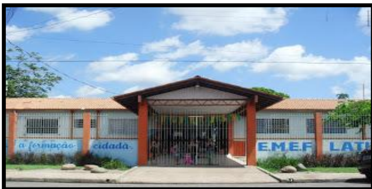
Figura – 1: Escola Ronald Latiffe Jatene