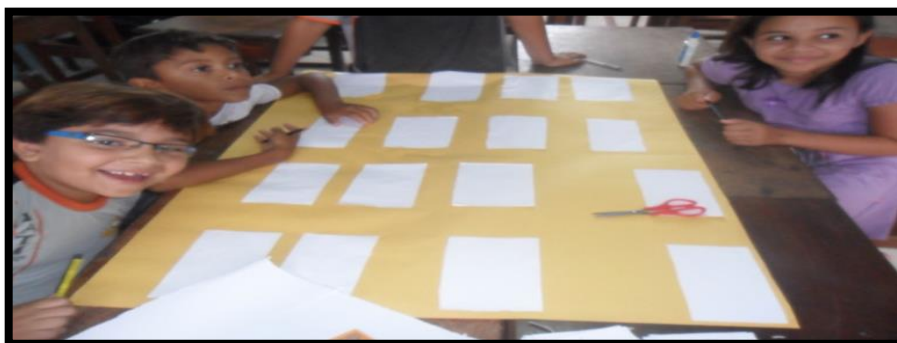
Figura – 3: Alunos após a confecção Do Jogo Forme Dez.

Formar 16 quadrados médios com o papel A4 e colar no papel madeira ou cartolina, para formar um tabuleiro 4x4. Depois deve-se cortar 66 fichas pequenas de cartolina e numerá-las da seguinte forma : 22 fichas com o (número 1) ,13 fichas com o (número 2),12 fichas com o (número 3),7 fichas com o (número 4), 4 fichas com o (número 5), 2 fichas com o (número 6), 2 fichas com o (número 7) e 1 ficha curinga. Na fotografia 3 podemos observar como ficou este jogo após sua confecção realizada pelos alunos.