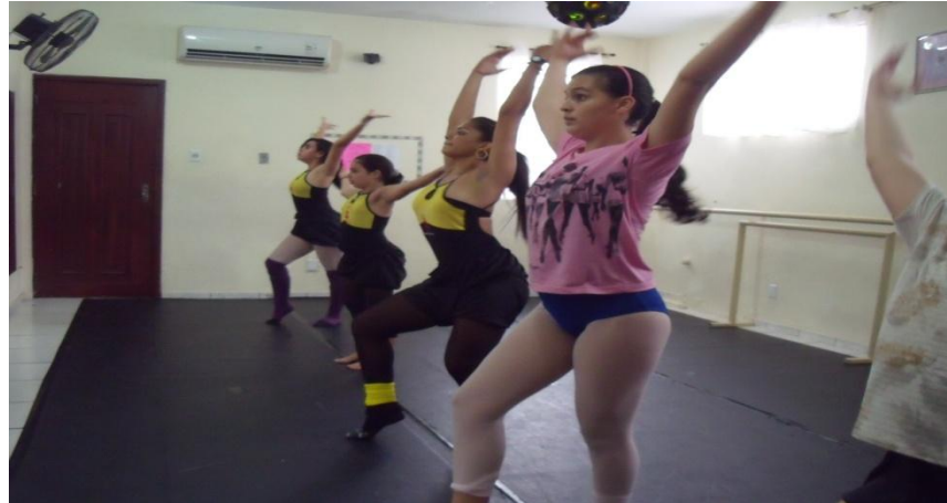
FIGURA 13: Movimento súbito e sustentado

familiarizadas umas com as outras, pois não se sentiram tímidas ao realizar o processo, só um pouco receosas com relação ao movimento sustentado que requer força e que para ser executado com sincronismo é necessário que alguém sinalize o começo do movimento.