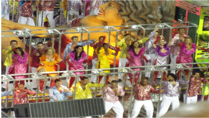
FIGURA 14: Estímulo Visual.

Penso então em como vamos utilizar o roteiro, sugiro seguir este através de gestualidades que lembre as alas que passam nas escolas de samba, pensar também em como os indivíduos que entram na avenida se divertem, experimentar ser espontâneo, para passar a verdade enquanto estamos executando o movimento, tentar sentir a emoção que as pessoas experimentam ao entrar na avenida.