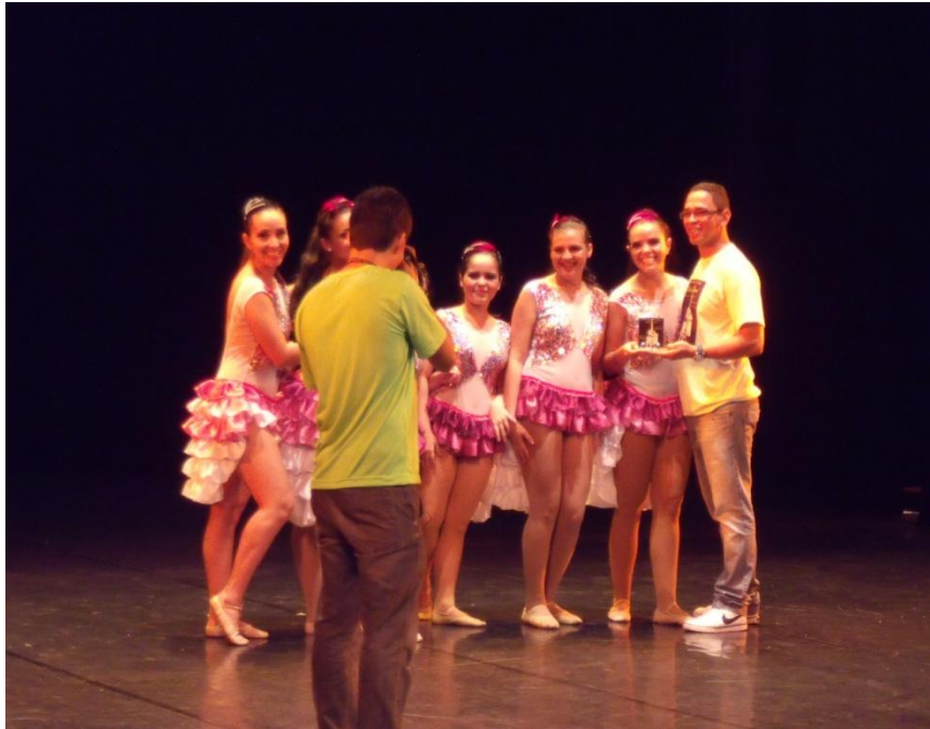
FIGURA 15: Festival Belém dance.