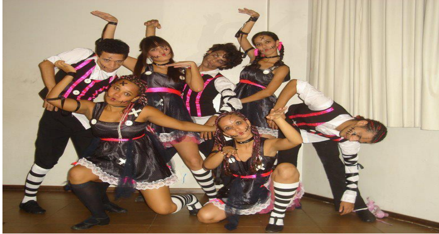
FIGURA 8: Bem Vindo ao Grotresco

há a amargura da realidade de um ser. Não acho “Feio”, acho exótico, trabalhar com a compassos é surpreender o público com ideias e movimentos que não são comuns, tem um ar triste e alegre ao mesmo tempo, é o paradoxo que o faz singular.