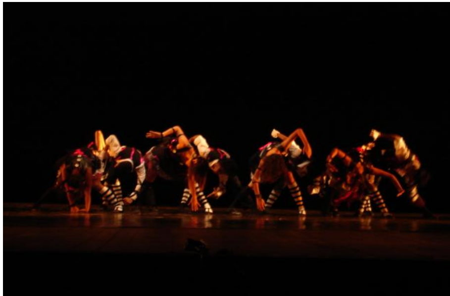
FIGURA 5: Bem Vindo ao Grotesco- Teatro da Paz.

A coreografia tem um toque de Chuckie, gosto muito de coisas macabras e por usarem musica do grupo “panic at the disco” o que ajudou mais a dar um ar macabro/trash.”.(Iam Vasconcelos, entrevista cedida a pesquisadora, 2012.)