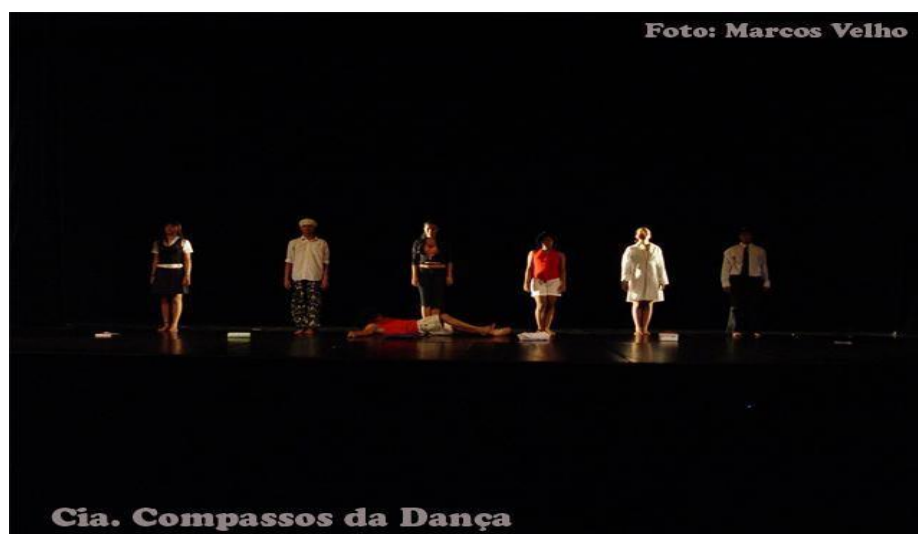
FIGURA 10: Coreografia Construção

Como o nome mesmo aponta o objetivo, essa característica é marcada por afrontar as inquietações dos bailarinos enquanto sujeitos da sociedade que nos cerca. Essa crítica é sempre ligada à realidade que vivemos ou acontecimentos históricos. A opressão, a dificuldade de estar em uma sociedade dirigida por corruptos, atitudes humanas e desvio de caráter. Como podemos observar no descaso pelos menos favorecidos, na coreografia “Construção”. (Imagem a baixo) e na opressão da Rainha de copas no espetáculo “Muito Curiosíssimo!”