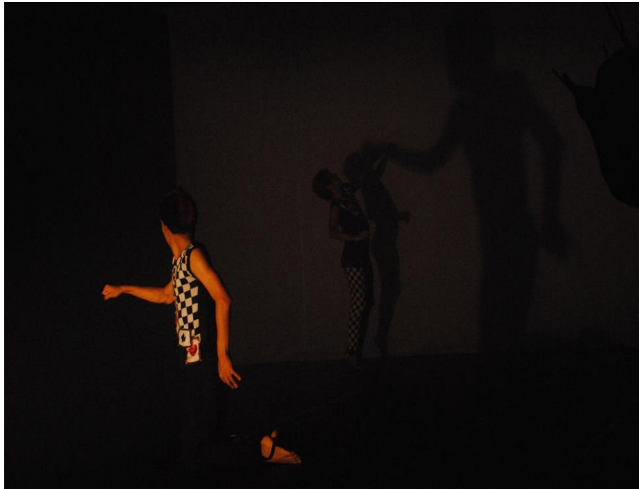
FIGURA 11: Cena do Crescimento, Muito Curiosíssimo!

Esta característica aparece em todas as coreografias, esta ligada a todos os outros olhares, satirizar o feio, o clássico, e a realidade humana, é o ponto chave da companhia levando a expressão dos personagens e sua maquiagem para a comicidade da dança, tentando sempre apresentar um espetáculo leve e entendível ao olhar do público.