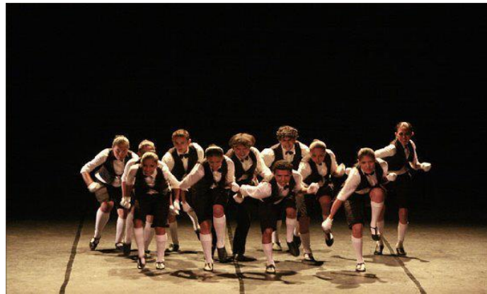
FIGURA 6: Em Concerto- Teatro da Paz.

Gosto de “Em Concerto”, pelo trabalho corporal associado com movimentos de uma orquestra, e assim como na maioria das coreografias, a exploração da música ser coerente com as movimentações. (Suanne Baena, entrevista cedida a pesquisadora, 2012.)