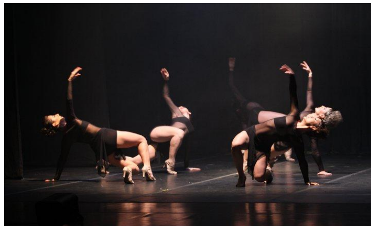
FIGURA 2: Longe dos meus olhos... Perto do coração

O retorno ao Festival de Dança de Joinville no ano de 2010 foi necessário não só para pesquisar a linguagem do jazz , mas em busca de suas diversas hibridizações e conhecimento de outras técnicas. Dentro deste festival tive a oportunidade de fazer cursos de Dança de Rua- Freestyle, Jazz Dance com o método 7 de Roseli Rodrigues, Jazz Lyrical com Érika Novachi 8 , mostras competitivas de danças que assisti.