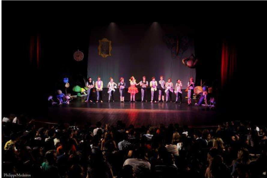
FIGURA 9: Espetáculo de Dança Muito Curiosíssimo!