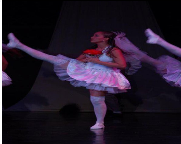
FIGURA 7: Até que a Morte nos Separe