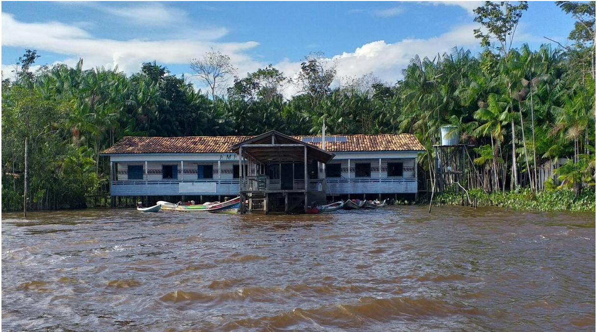
Figura 01 - Escola Santa Rita de Cássia