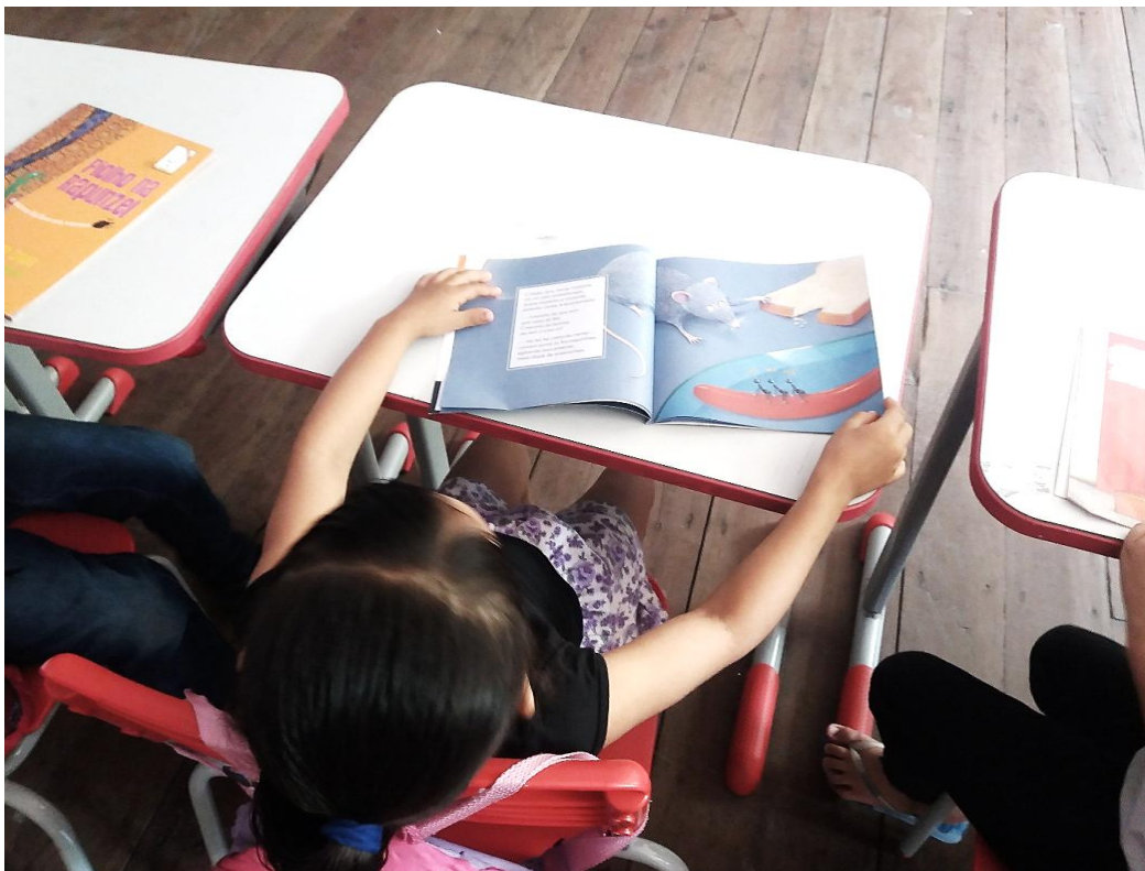
Figura 04 - Alunos fazendo uso dos livros paradidáticos