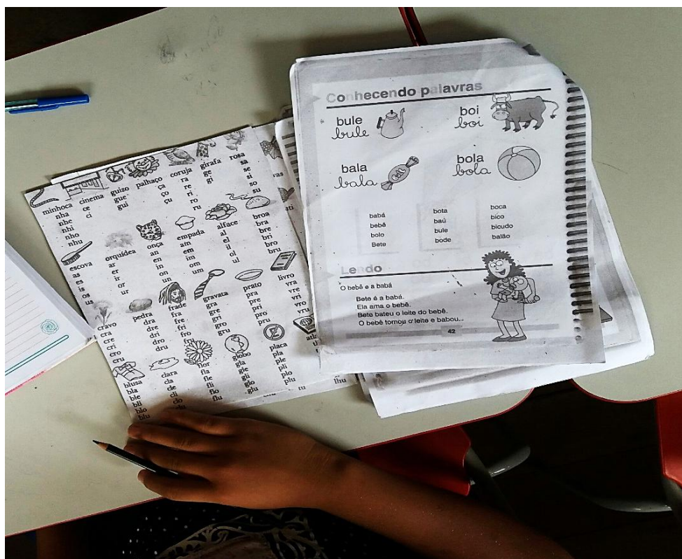
Figura 02 - Fichas de leitura