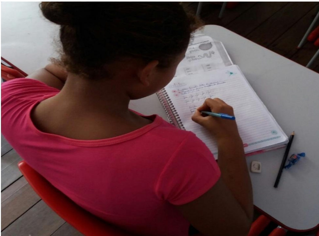
Figura 06 - Atividade avaliativa feita pelos alunos do 4º ano

diagnóstica, pois avalia seus alunos todos dias através das atividades realizadas em sala. Dadrino et al (2010) afirmam que a avaliação quando utilizada para diagnosticar o aprendizado do aluno, serve como uma aliada ao professor, nas tomadas de decisões, ajudando-o a superar suas dificuldades e limites, porém, esse tipo de avaliação requer uma preparação que não o exclua do processo educativo.