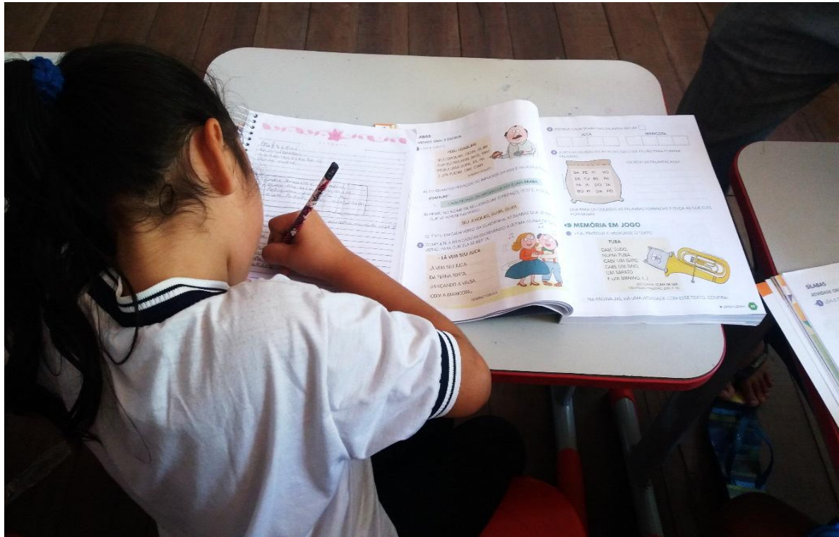
Figura 05 - Aluna do 2º ano fazendo atividade do livro didático

De acordo com Dadrino et al (2010, p. 35) “evoluir em avaliação é acompanhar o ser humano integralmente. É ouvir, ver, sentir, tocar e relacionar”, assim, podemos notar que a avaliação, pode ser realizada de vários formatos e maneiras, construindo uma formação crítica, e criativa.