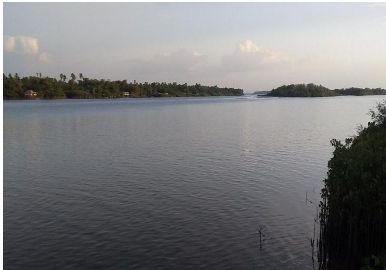
Figura-2 Vista panorâmica da comunidade de Jaracuera Grande.

O acordo de pesca faz parte do dia a dia das pessoas da comunidade, por estar literalmente na frente das residências, permitindo o monitoramento durante o dia sem precisar de barco, como observado na Figura (2). sobre isso, Raffestin (1993) analisa que ao se tratar de territorialidade a relação com o território antecede as relações com as pessoas.