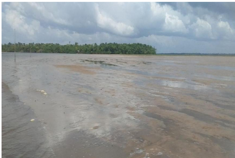
Figura 4 - área de assoreamento em Jaracuera Grande

Outro problema é o assoreamento do rio, resultado ainda visível da construção da hidrelétrica Tucuruí (Bordalo; Cruz, 2013). Para quem está inserido diretamente, como os pescadores, as mudanças são catastróficas. O que hoje é um rio logo mais será um banco de areia, o que torna quase impossível navegar quando a maré está baixa, além disso, a diminuição da profundidade dos poços de mapará , das áreas de pesca, compromete ainda mais a situação, como visto na Figura 4 e no Mapa 1.