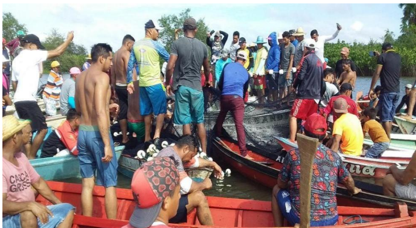
Figura 5 - Abertura da pesca 2023 na comunidade de jaracuera

O borqueio também é um exemplo do trabalho em grupo na pesca do mapará (Figura 5). Na sua obra, Sack (1986), entende que o local passa a se tornar território quando as fronteiras são usadas para fins de controle. E um grupo portanto controla ainda mais do que um território: a vigilância do acordo é realizada para controlar o acesso dentro do território de pesca. Geralmente, a punição para quem transgride as regras é uma advertência verbal, mas pode evoluir para outras formas mais energéticas, como corte do seguro defeso do infrator.