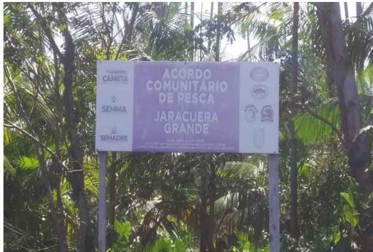
Figura 6 - placa que identifica o limite do acordo