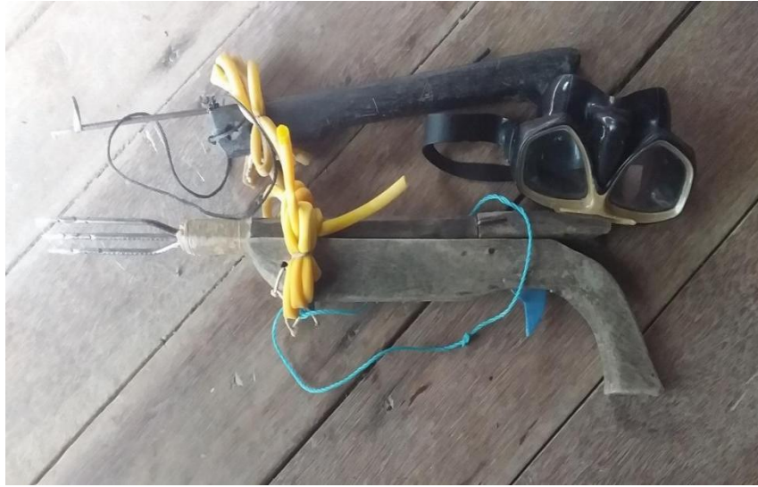
Figura 3 - Equipamento de pesca de mergulho