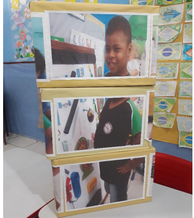
Imagem 03: Quebra cabeça