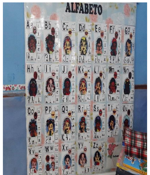
Imagem 05: Painel do Alfabeto