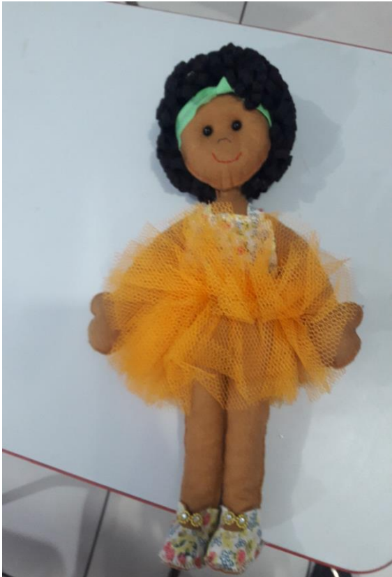
Imagem 06: Boneca negra