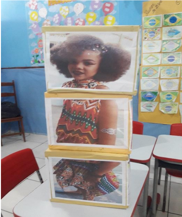
Imagem 02: Quebra cabeça com a imagem Da aluna negra vencedora do concurso de Beleza mirim.