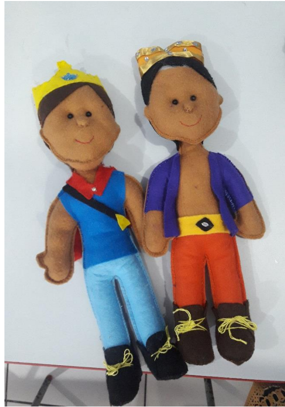
Imagem 07: Bonecos negros