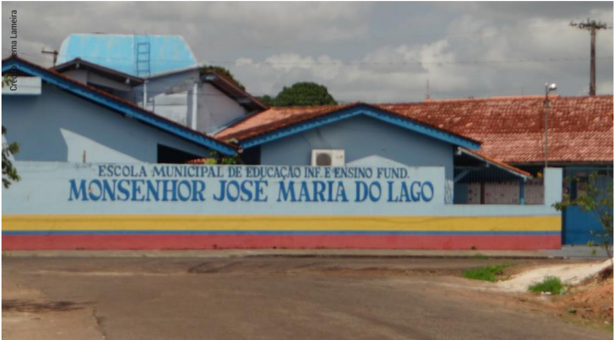
Imagem 01: Escola Monsenhor José Maria do Lago