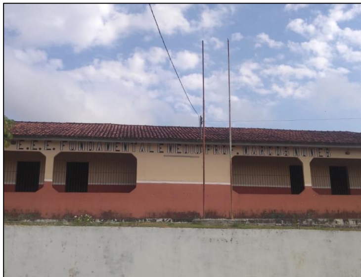
IMAGEM 01 – Vista Frontal do Prédio