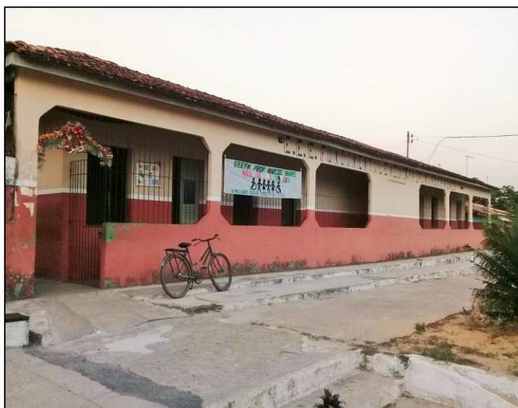
IMAGEM 02 – Vista de lado do Prédio