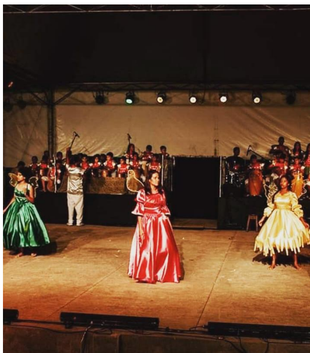
Figura 3: Figurino das fadas do espetáculo O Circo e minha infância .

O figurino é um dos elementos que precisam ser feitos com antecedências por conta dos ajustes e da quantidade de crianças, os tecidos precisam estar disponibilizados desde o início dos ensaios. Uma das preocupações era que não ficassem prontos em tempo hábil por conta dos atrasos de materiais e de pagamentos das costureiras que ficaram atrasados durante os meses todos de trabalho. Contudo, mais uma vez, as costureiras fizeram um trabalho lindo mesmo em meio a dificuldade.