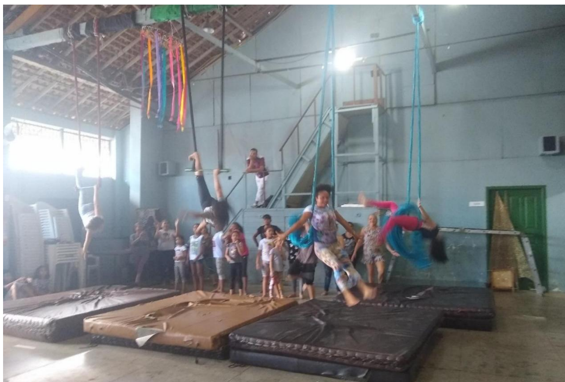
Figura 5: Espaço do circo usado para ensaio com colchões danificados.