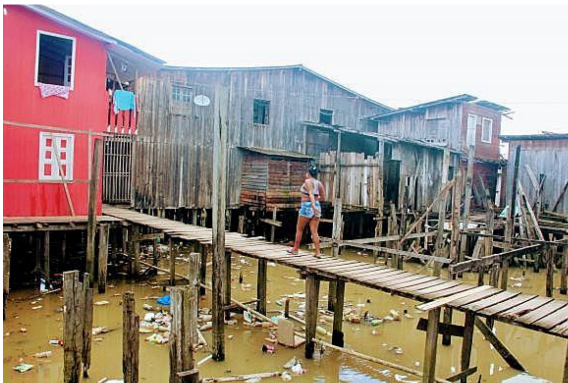
Figura 1: Vila da Barca