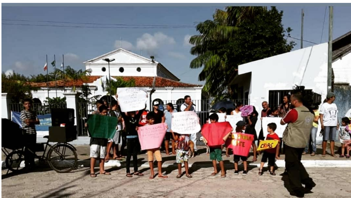
Figura 6: Protesto em frente ao Curro Velho.

o do circo. Por tudo isso, neste dia começou uma movimentação das crianças com o apoio das Mães das Crias que participavam do processo para exigir melhorias para o espetáculo ocorrer da maneira devida, assim foi mobilizado por eles através de grupo de WhatsApp um protesto que fecharia uma avenida próxima ao órgão público. O percurso saiu da frente do Curro Velho, seguiu pela Rua Professor Nelson Ribeiro, Travessa Coronel Luiz Bentes até a Avenida Pedro Alvares Cabral, onde ficou a maior parte do protesto com interdição da via pelos manifestantes com cartazes, e depois voltando novamente para a frente do Curro Velho onde se encerrou na parte interna em uma conversa com o diretor, todo esse trajeto se situa no bairro do Telégrafo. A figura 6, a seguir ilustra um momento do protesto supracitado.