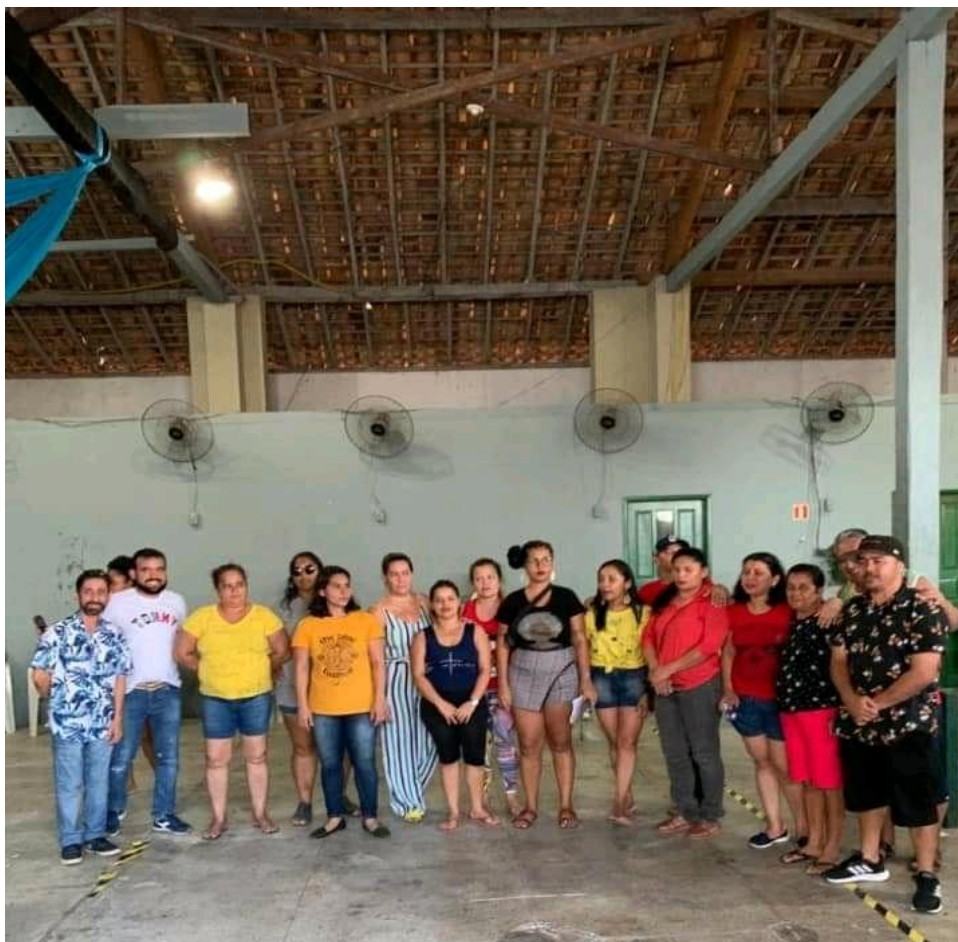
Figura 8: Comissão escolhida pela comunidade presente da Vila da Barca

muito desgaste e em cima da hora, sendo que tudo isso poderia ter sido evitado se tivessem ouvido as diversas tentativas de conversas da comunidade e instrutores.