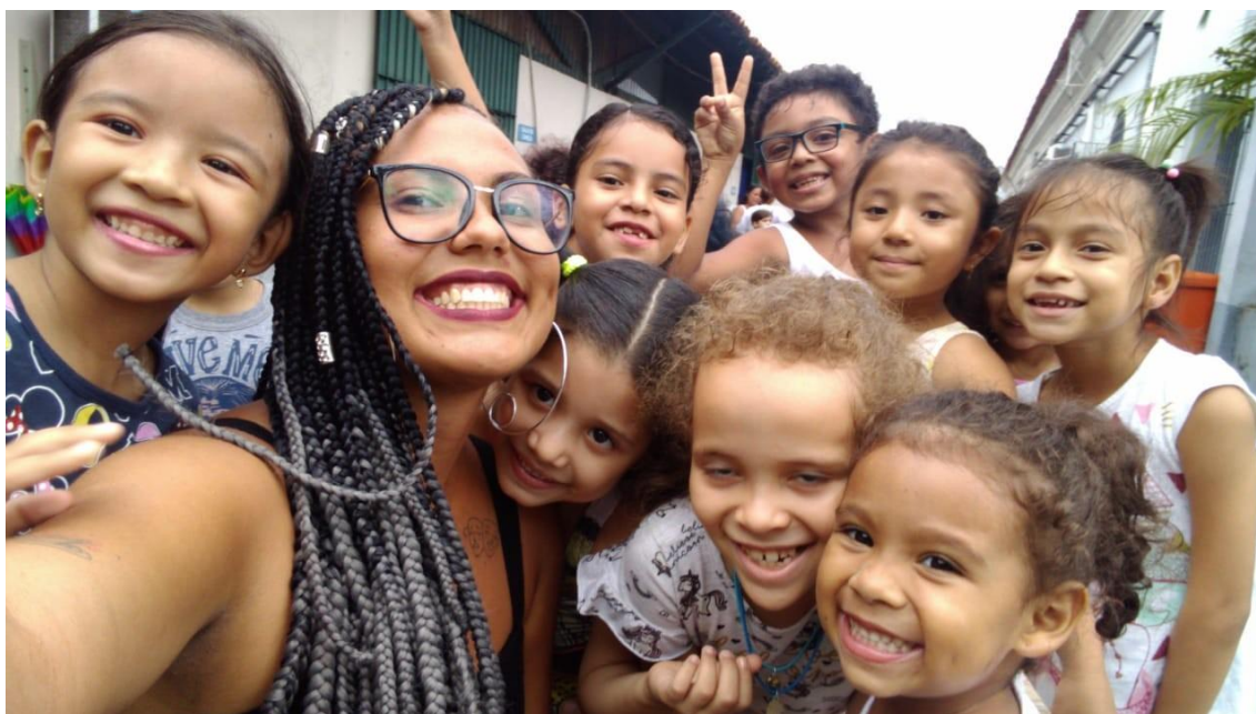
Figura 10: Minha turma no Carnaval de 2020

A imaginação criadora permite á mente infantil percorrer caminhos que conduzem a outros tempos e espaços. Dinâmica da sensibilidade que permite descobrir realidades insuspeitas e mundos novos, tornando-se meio direto de aprendizagem ao transportar a criança a uma temporalidade fictícia e a um espaço interior maravilhoso, conduzindo-a do conhecido ao desconhecido. E não é esta a própria questão de toda pedagogia que se nega a ser só reprodução? (RICHTER, 2014, p.169).