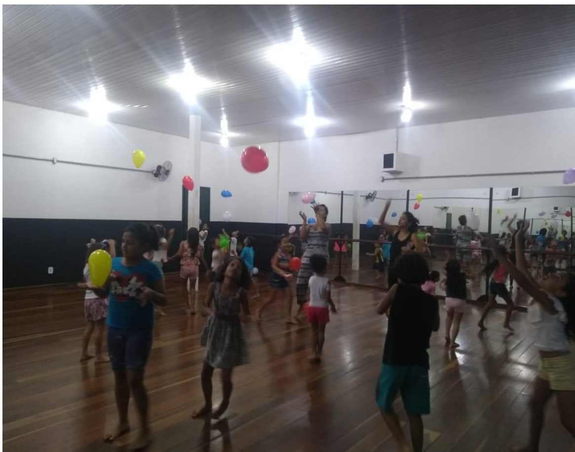
Figura 9: Jogo com balões durante a aula