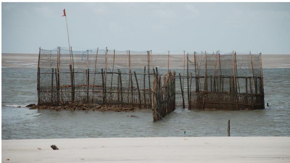
Figura 4: Curral, armadilha para pegar o peixe.

Para melhor ilustrar, o apoiamento significa uma rede fixada de uma margem a outra dos rios, furos e igarapés, sendo a parte inferior presa ao substrato por pesos ou poitas, alguns pecadores utilizam pedras. A parte superior da rede é elevada por boias na superfície e assim, ela é mantida estendida sob a água. A duração da pescaria é o período de uma maré.