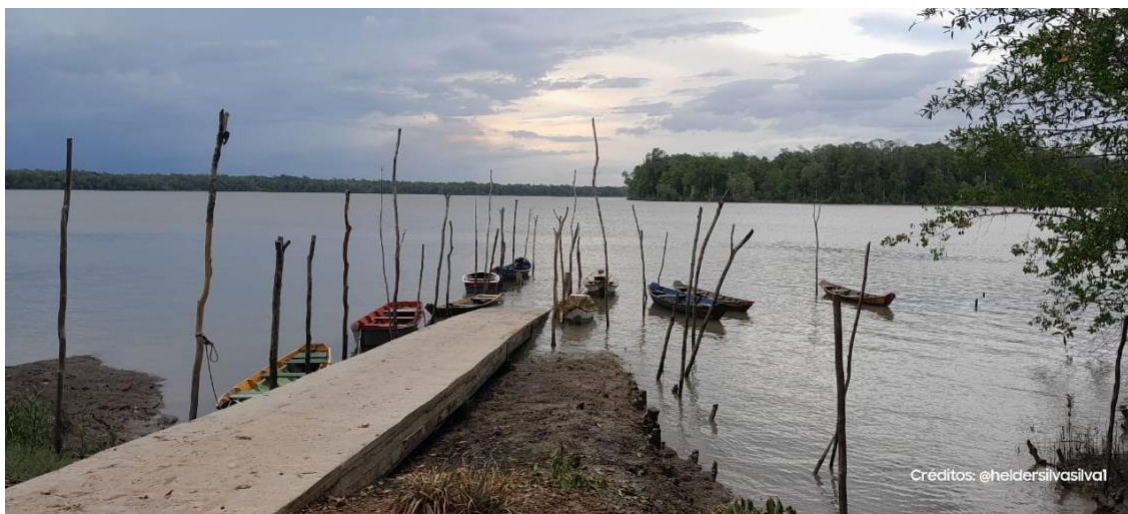
Figura 1: Porto da Comunidade de Bom Intento

Até os meados dos anos 70, o Rio Maracanã era o único meio por onde os moradores se deslocavam para o centro urbano (Cidade de Maracanã), para vender os seus produtos agrícolas como: arroz, farinha, milho, castanha de caju, malva, tabaco e até mesmo o grude do pescado; pois a vila nesse período era uma grande produtora dessas variedades. Assim como era usado para a escoação dos produtos agrícolas, até hoje os rios Maracanã e Chocoaré também são utilizados pelos moradores para a prática da pesca artesanal e a extração do marisco. O extrativismo é o principal meio de se conseguir o alimento e atualmente é a atividade de maior renda econômica da comunidade, que mantém de forma significativa o comércio local.