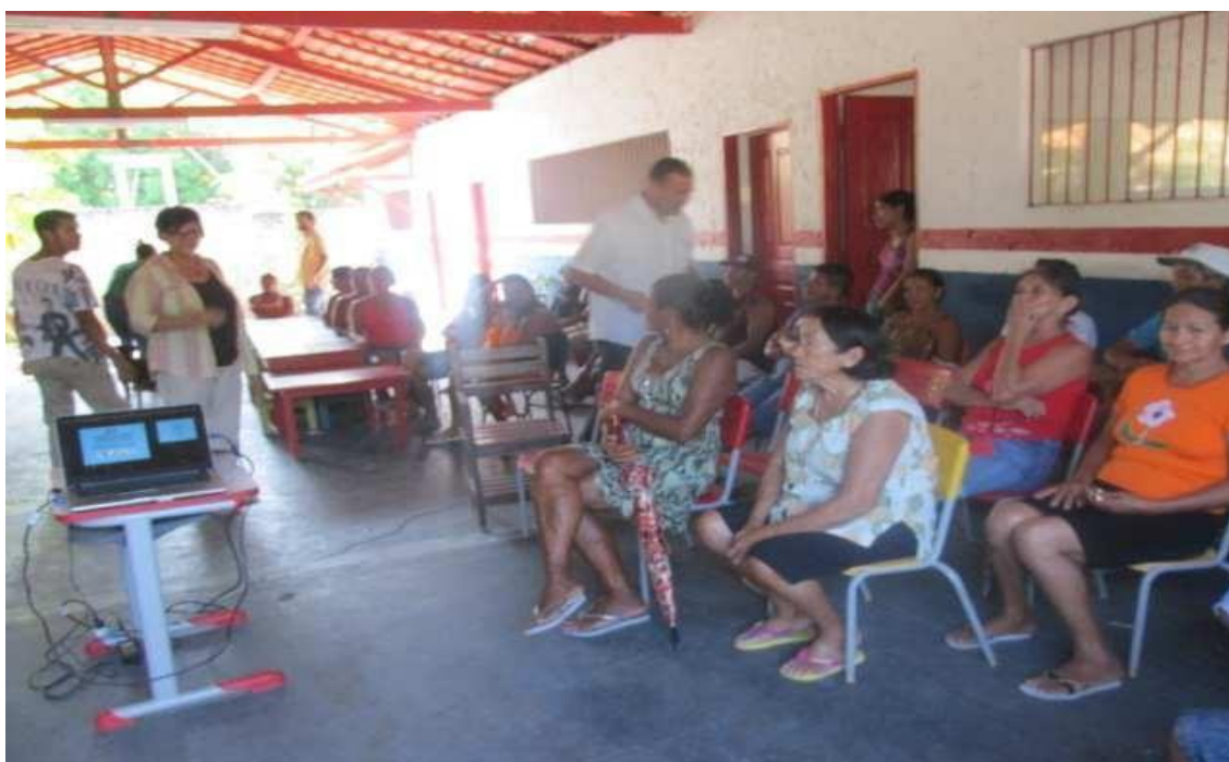
Figura 6: Aspectos da oficina em Bom Intento, São João de Pirabas-PA.

Foram realizadas oficinas nas comunidades, como já citado anteriormente, para esclarecer sobre as atividades que seriam desenvolvidas nas comunidades localizadas na região de ampliação da Resex Chocoaré Mato-Grosso, a equipe foi acompanhada do Chefe da unidade e representante da Secretaria Municipal de Meio Ambiente do município de São João de Pirabas. Nessas comunidades, os presidentes das Associações apoiaram a mobilização e organizaram os locais para ocorrer as oficinas. Trabalhou-se para sanar conflitos de ordem político-institucional quanto aos territórios a serem incluídos.