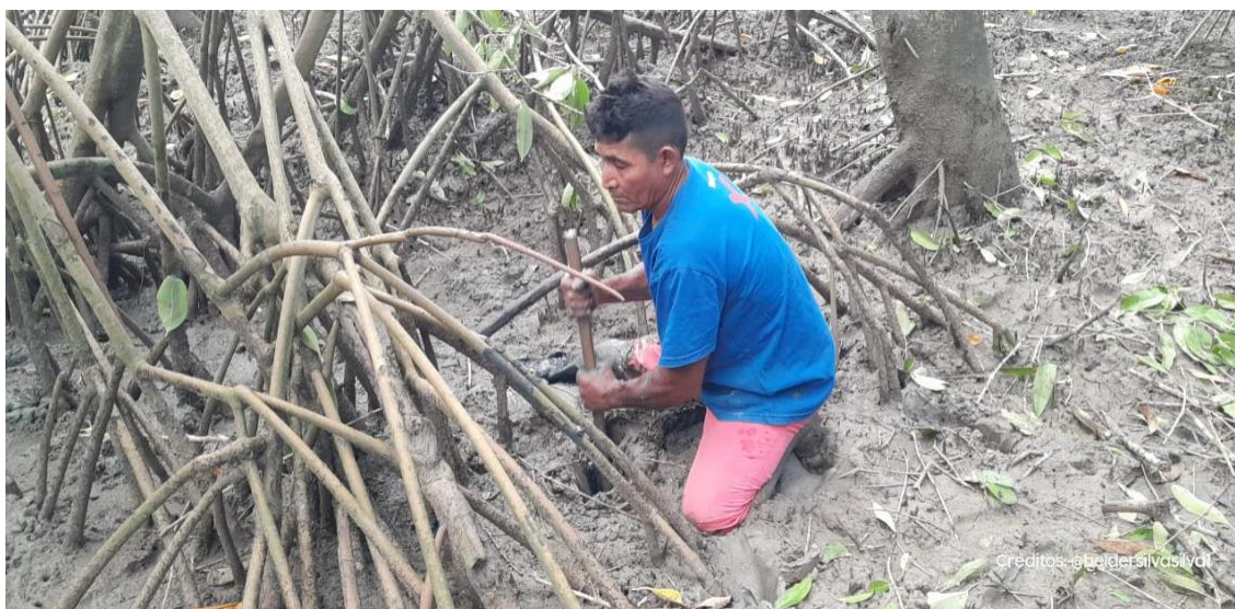
Figura 2: Caranguejeiro.

De acordo com GODELIER (1984, p.56), “essas tarefas legitimam o lugar e a posição dos indivíduos faces às realidades que são permitidas, impostas, proibidas”.