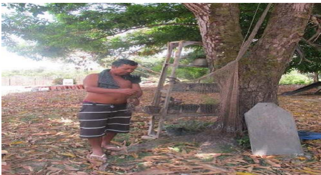
Figura 3: Pescador demonstrando funcionamento da tarrafa em Bom Intento-São João de Pirabas-PA.