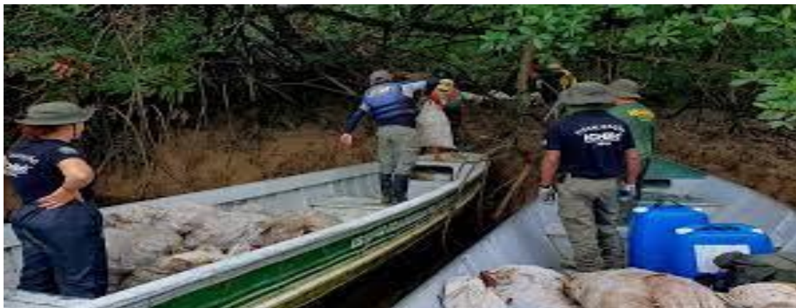
Figura 7: Agentes do ICMBio e IBAMA soltam 2 mil caranguejos-uçá capturados no período de defeso.