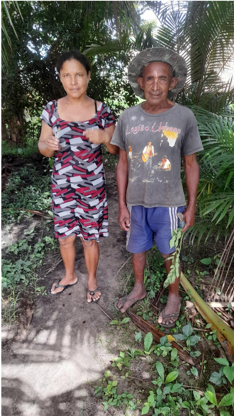
Figura 4: Minha tia e meu avô mostrando as plantas medicinais encontradas em seus quintais e seus modos de uso.