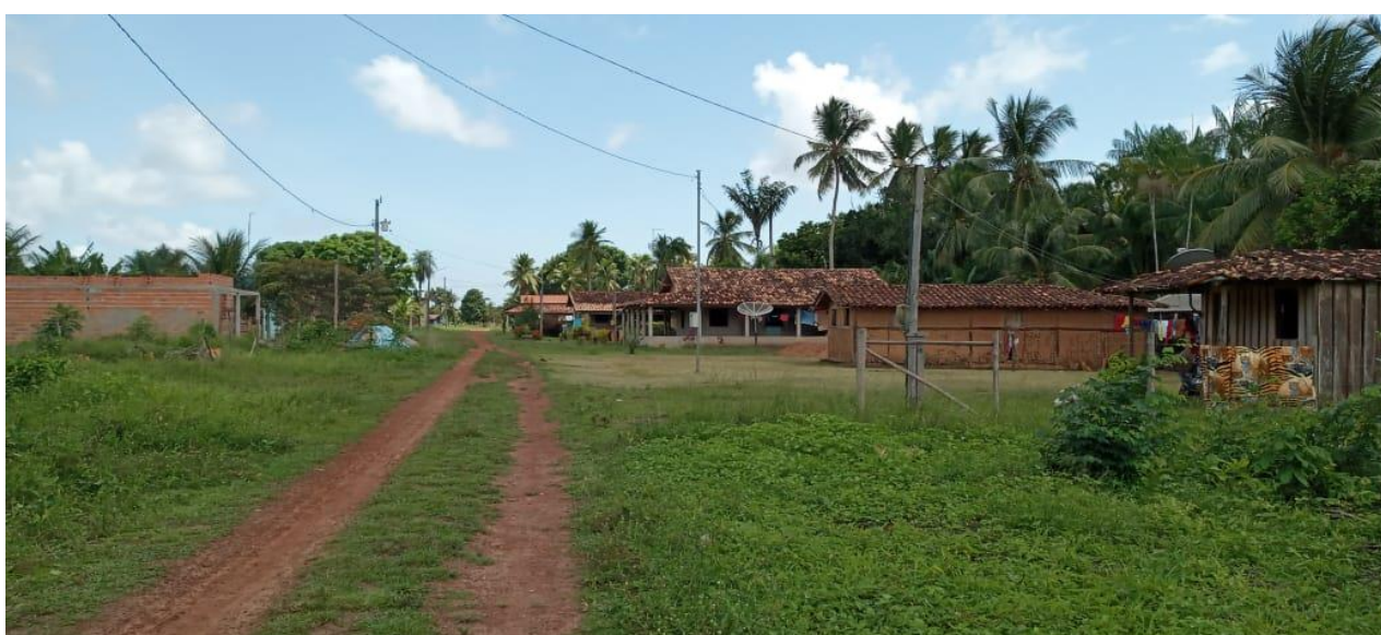
Figura 2: Comunidade de São Benedito da Ponta - PA

Até o dia 28 de novembro de 2007, a comunidade não era reconhecida como um quilombo, logo, as pessoas que moram no local lutaram e exigiram a titulação das terras como remanescentes de quilombolas.