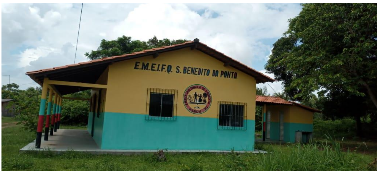
Figura 3: Escola Municipal de Ensino Infantil e Ensino Fundamental são Benedito da Ponta

ainda está em processo de construção. A comunidade participa da escola por meio de reuniões e das festas realizado no âmbito escolar (SANTOS, 2016)