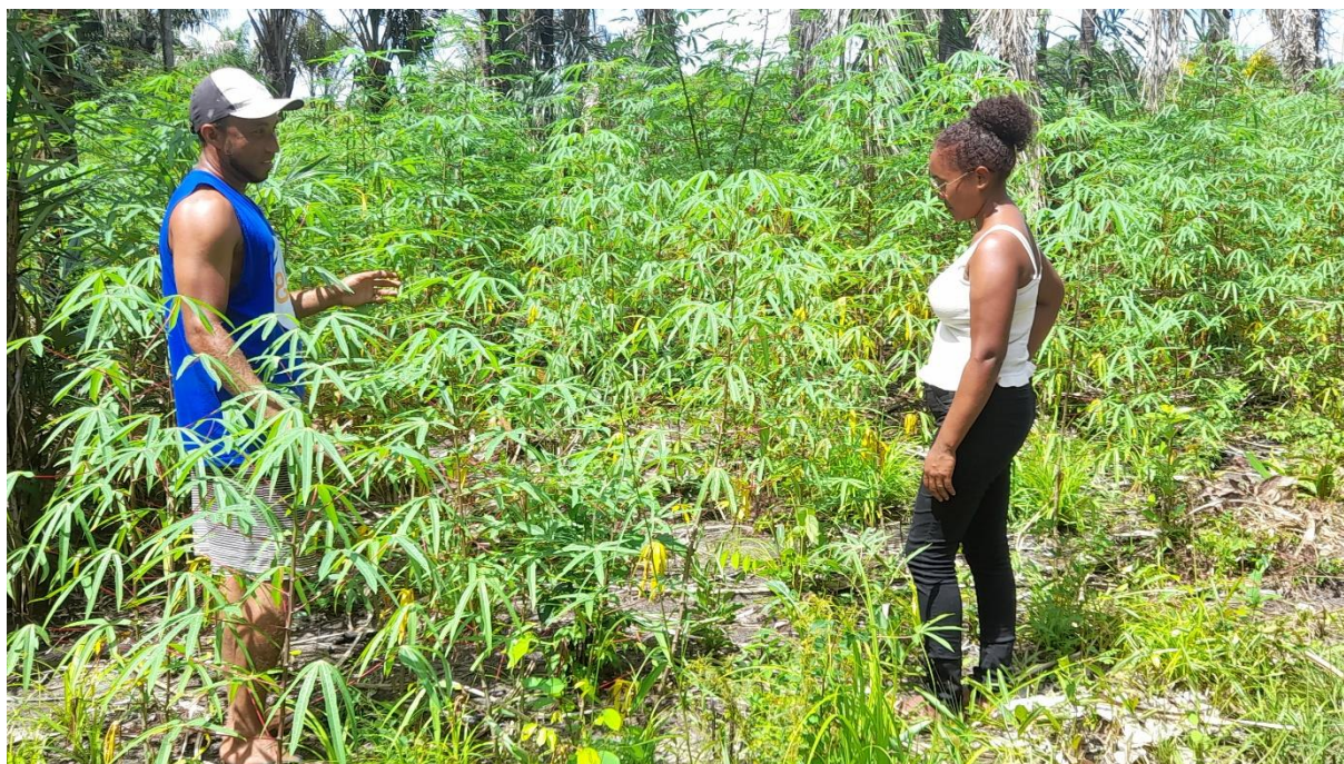
Figura 5: Meu esposo e eu em uma roça de mandioca na comunidade.

O uso de plantas medicinais faz parte da minha realidade desde a infância quando eu morava na Comunidade Quilombola de Mangueiras, juntamente com minha família paterna. Sempre observei a minha vó e tias utilizando ervas, casca, raízes e folhas de plantas medicinais para produzir chás para diferentes tipos de enfermidades, como por exemplo: no combate à diarreia utilizamos o chá de marupazinho; para tratar a gripe temos o chá de capim-limão na forma de banho para molhar a cabeça; para tratar pressão alta usa-se chá de alho e para curar dor de cabeça usamos com chá de anador.