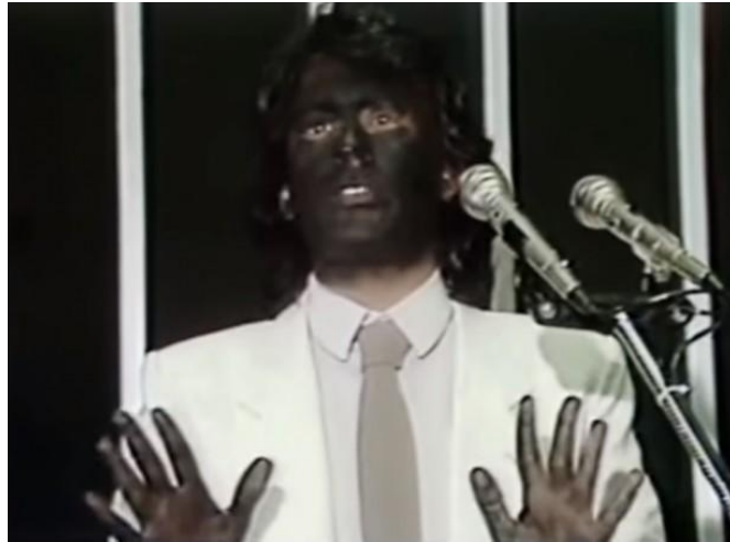
Figura 1: Protesto de Ailton Krenak