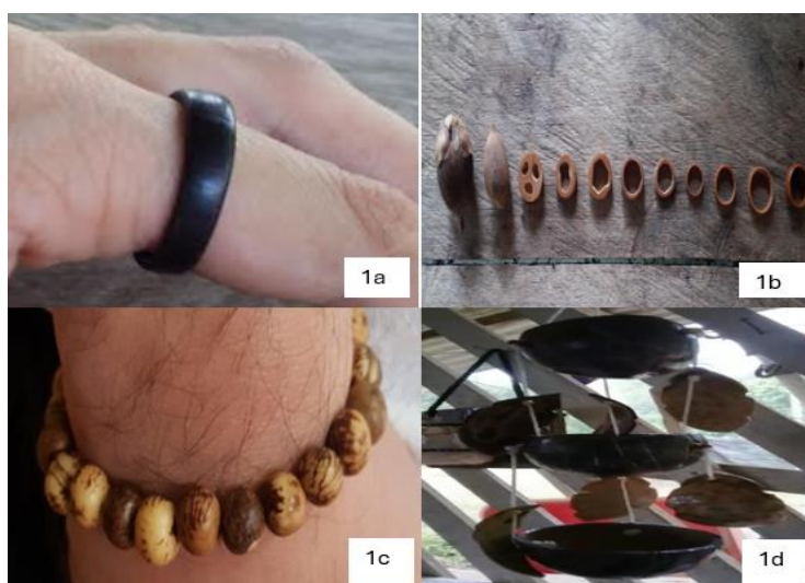
Figura 1: Artesanatos fabricados com materiais dos quintais.

O curso oportunizou às mulheres moradoras do PA e participantes do projeto aprenderem a confeccionar anéis de tucumã (Figura 1a e 1b), pulseiras de caroço de açaí (Figura 1c), artesanatos em casca de coco (Figura 1d).