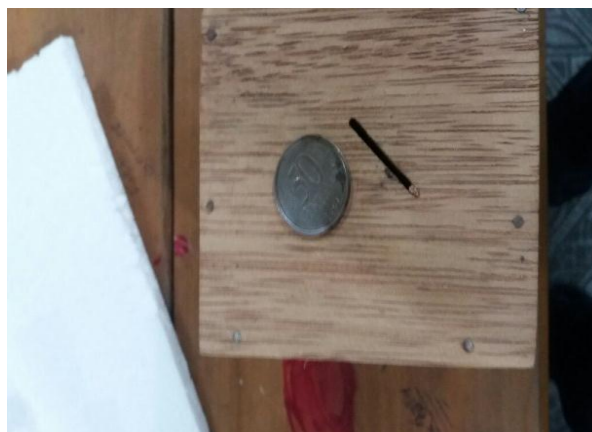
Fig. 4- Experiência do cofre de Gravazande.