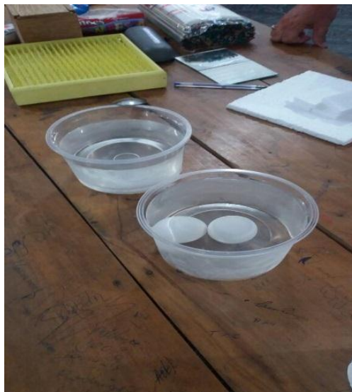
Fig. 1- Experiência do ovo que flutua.