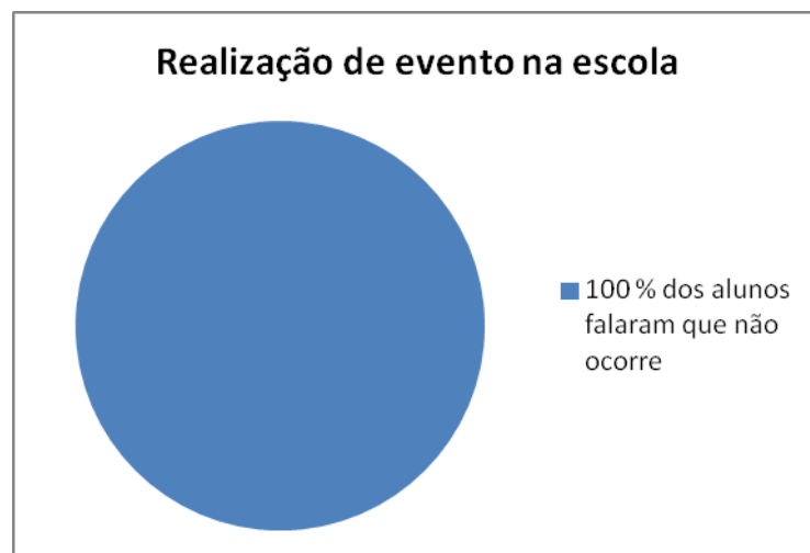
Gráfico 3 – Sobre a falta de eventos de Ciências que envolvam a experimentação

Já na terceira questão foi abordado sobre a realização de eventos de Ciências na escola Prof. Estevão Gomes que trabalhassem assuntos relacionados com a área de Física na escola como cinemática, dinâmica, termologia e outros.