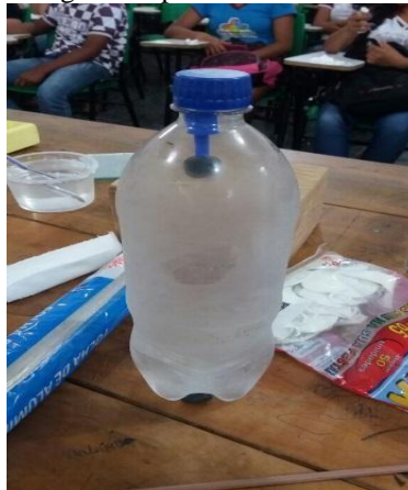
Fig. 2 - Experiência do ludião