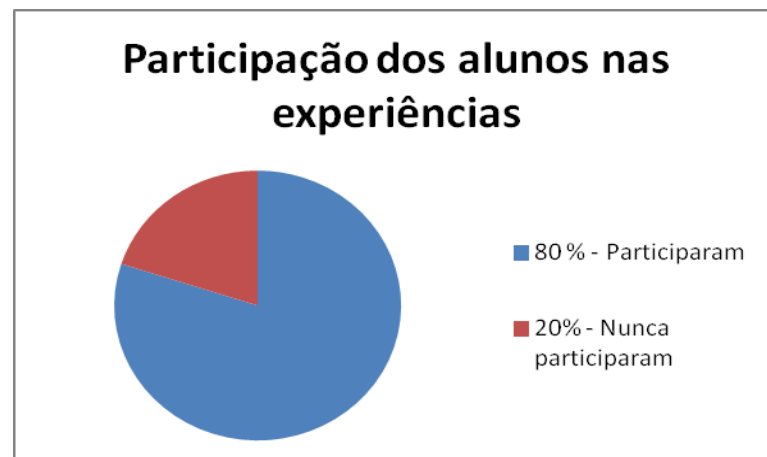
Gráfico 1- Porcentagem dos alunos nas experiências em sua escola.

Analisando a primeira questão do questionário sobre o uso de materiais alternativos passados aos alunos para sabermos: se alguns deles já tinham participado de alguma experiência em sua escola? 24 alunos responderam que sim e 6 responderam que não. Podemos analisar no gráfico abaixo que mais da metade dos alunos da E.M.E.F. Prof. Estevão Gomes já participou de alguma atividade que envolvesse experimentos de Física em sua escola.