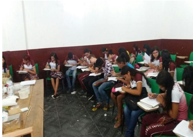
Figura 6 – alunos preenchendo os questionários

Para cada discente que participou do nosso trabalho de pesquisa com materiais alternativos nas aulas de Ciências foram entregues 01 questionário contendo 05 questões de múltipla escolha, sobre os experimentos de Física apresentados em sua turma do 9º ano do turno da manhã da E.M.E.F. Prof Estevão Gomes.