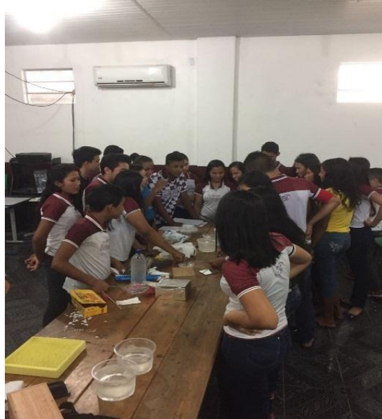
Figura 7 – alunos participando das experiências

na mente do aluno. Mas uma educação mais didática e participativa aonde o aluno possa pensar de uma forma mais participativa sobre os assuntos que ele estuda no seu ambiente escolar.