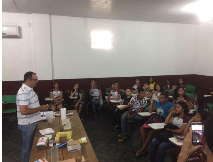
Figura 8 – apresentação para os alunos