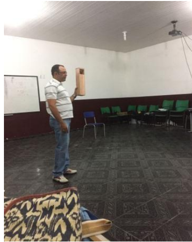
Fig. 5- Experiência do Periscópio