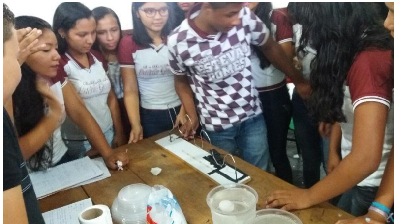
Fig. 3 – Experimento do labirinto elétrico.