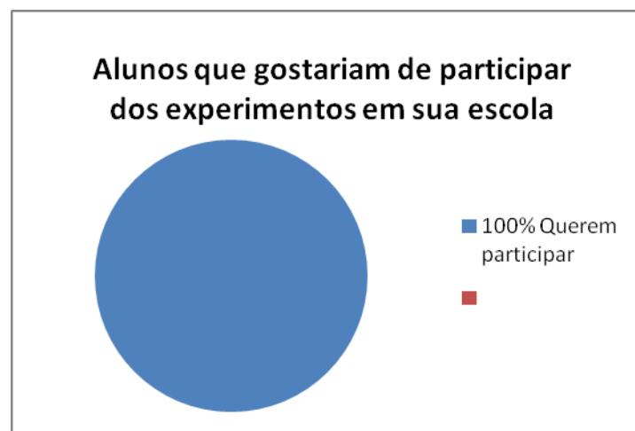
Gráfico 2 - Porcentagem dos alunos que gostariam de participar dos experimentos em sua escola.

Na segunda questão passada no questionário perguntava se os discentes da E.M.E.F. Prof. Estevão Gomes gostariam de participar desses experimentos na sua escola? Por quê? No gráfico abaixo podemos observar que dos 30 alunos entrevistados na segunda pergunta do questionário que foi passado para eles todos responderam que gostariam de participar de experimentos na sua escola.