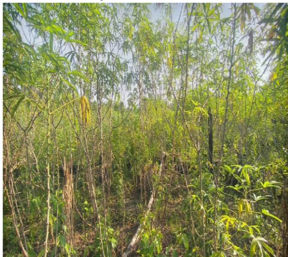
Figura 02 : variedade ana julia