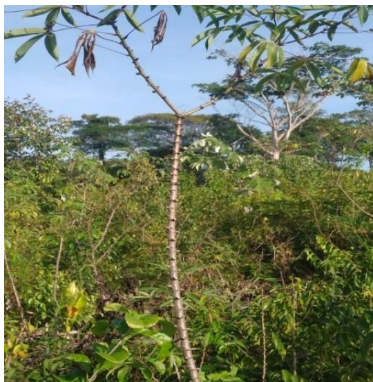
Figura 06: zolhuda