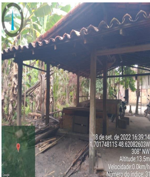
Figura 10: retiro