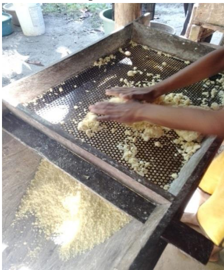
Massa sendo peneirada.