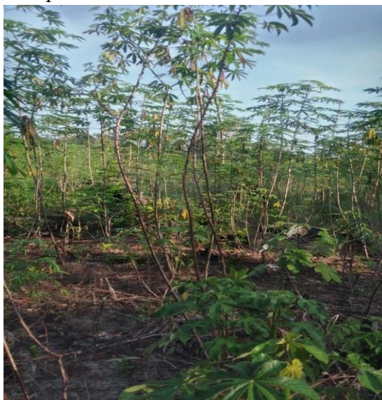
Figura 04: pretinha seca