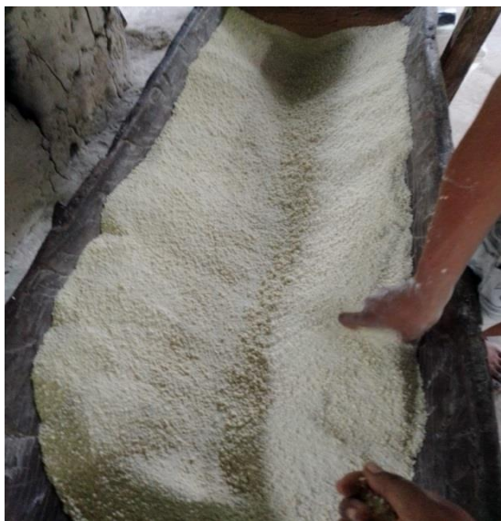
Figura 08: Farinha Amarela