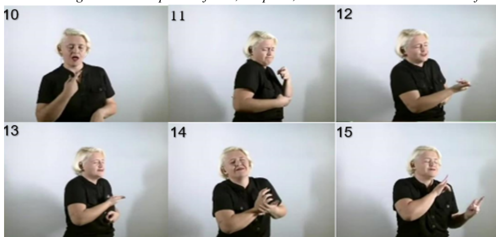
Trecho 2: Estratégias usando Expressão facial, Corporal, Movimento com acréscimo de informação