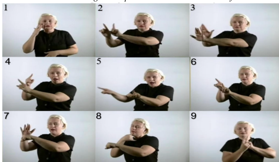
Trecho 1: Estratégias interpretativas usando sinais e classificadores