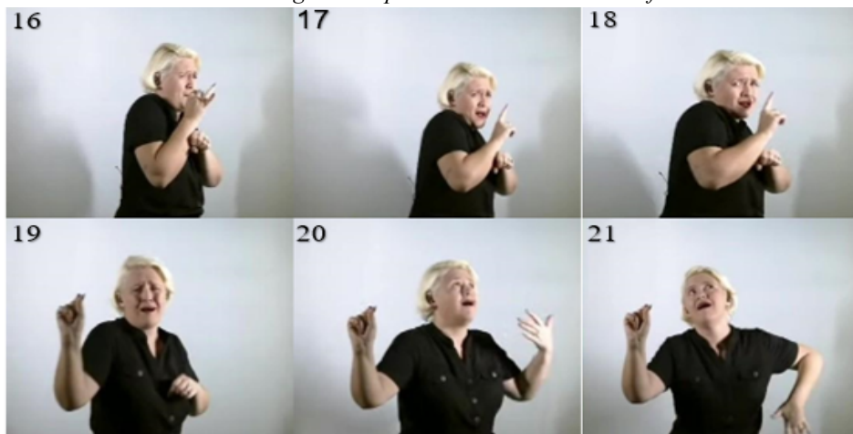
Trecho 3: Estratégias interpretativa com uso de classificadores