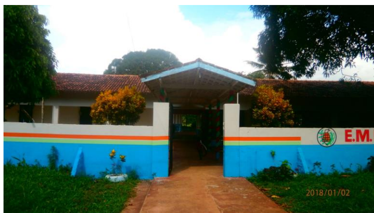
Figura 2 - Frente da Escola Francisco Solano Rayol Pereira

Mediante isso, reforço mais uma vez a importância do Caderno Didático protagonizado por nós comunitários, respeitando os princípios éticos consolidados através dos conhecimentos etnoicliológicos das pescadoras e pescadores tradicionais da referida comunidade. Esse caderno didático será desenvolvido na Escola Municipal de Ensino Fundamental Francisco Solano. (Ver Figura 2).