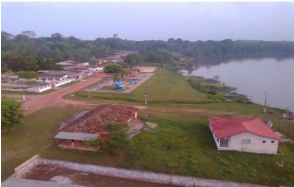
Figura 10 – comunidade de Espírito Santo do Tauá