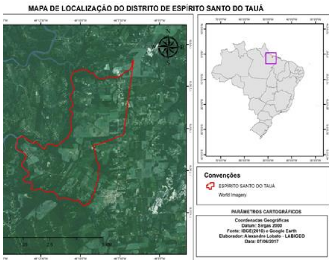
Figura 3- Localização Geográfica do Distrito de Espírito Santo do Tauá.

A comunidade de Espírito Santo do Tauá localiza-se na PA 242 no município de Santo Antônio do Tauá/PA. A distância da comunidade até o município é de 12 km, por via terrestre e também temos a ligação hidrográfica pelo rio Tauá e pela Baía do Guajará (ver figura 3).