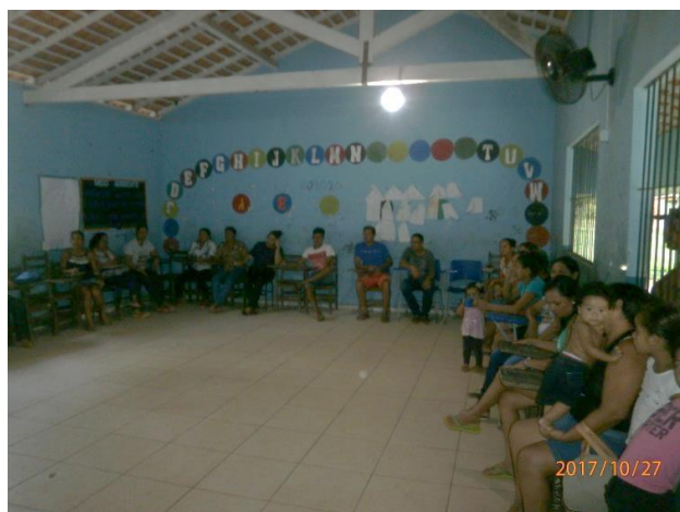
Figura 1 – Reunião de escolha do tema e subtema com os comunitários e pescadores (as).

Através das disciplinas “Etnoecologia” e “Práticas educacionais, saberes e Etnoeducação” tive acesso ao artigo do professor Flavio Bezerra Barros “ Etnoecologia da pesca ” na Reserva Extrativista Riozinho do Anfrísio – Terra do Meio, Amazônia, Brasil. Daí surgiu a ideia do Plano de Ação e se consolidou na conversa em uma reunião com as pescadoras e pescadores e os comunitários, no dia 10 de outubro de 2017 na escola da comunidade. Na oportunidade foi registrado o momento com pescadores e outros membros da comunidade na discussão da escolha do tema do TCC, como mostra a Figura 1.