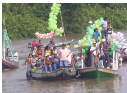
Figura 10: Imagens da procissão fluvial.