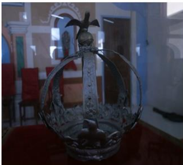
Figura 4: Coroa do Divino Espírito Santo