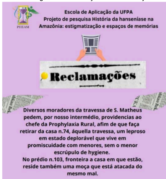
Figura 2 – Transcrição de notícia de jornal.

Fonte: Jornal Estado do Pará. Belém, 21 de julho de 1926, página 3 [Transcrição].