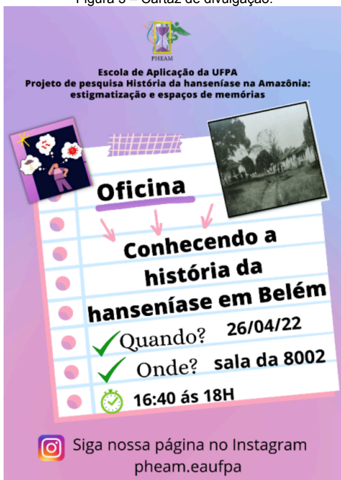
Figura 3 – Cartaz de divulgação.