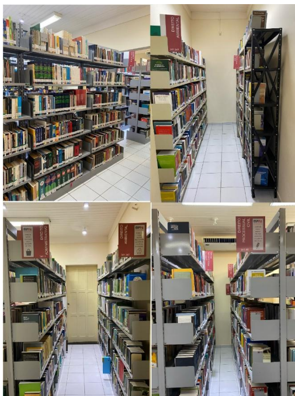
Figura 8 - Acervo da biblioteca