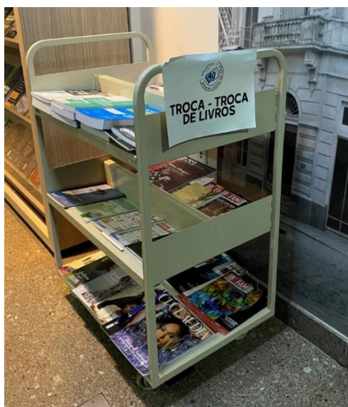
Figura 5 - Carrinho de "troca-troca de livros"