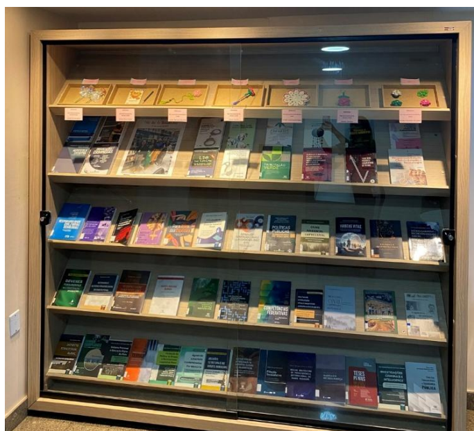
Figura 4 - Expositor de publicações recentes e histórico de brindes

Além é possível encontrar o carrinho do projeto “Troca-troca de livros” (figura 5) e um expositor (figura 4) com amostras de aquisições recentes do acervo e um histórico de brindes oferecidos nos eventos realizados pela biblioteca no dia 8 de março ao longo dos anos.