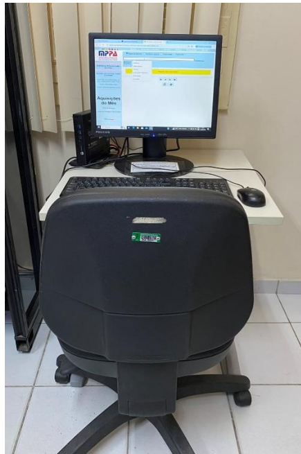
Figura 12 - Unidade de pesquisa