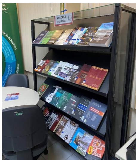
Figura 9 - Expositor "Autores do MPPA"

obras estão catalogadas no sistema, organizadas também em um catálogo de ebook produzido pela equipe da biblioteca, e disponíveis para empréstimo, o expositor dos autores fica dentro do acervo da biblioteca (figura 9)