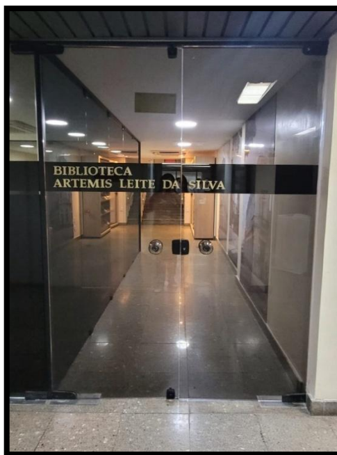
Figura 2 - Entrada da biblioteca