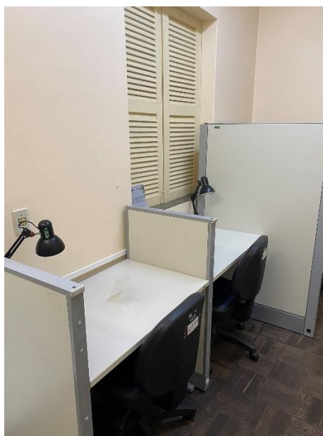
Figura 7 - Cabines de estudo individual