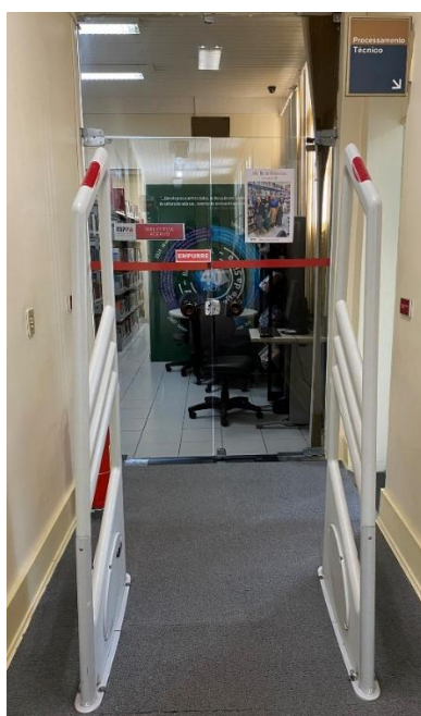
Figura 6 - Acesso ao acervo

Acessando o mezanino pela escada, fica localizada a entrada do acervo (figura 6), com o detector magnético de livros e dentro do acervo, no fundo das prateleiras conseguimos encontrar as 3 cabines de estudos individuais (figura 7)