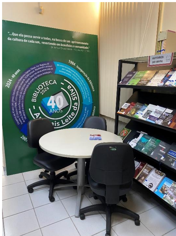
Figura 13 - Mesa para devoluções de obras consultadas e estudo coletivo