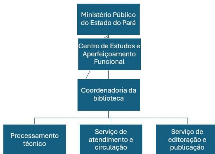
Organograma 1 - Estrutura organizacional