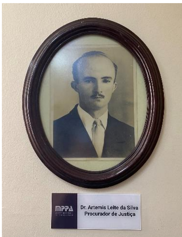
Figura 1 - Fundador da biblioteca Artemis Leite da Silva

A biblioteca foi fundada em 26 de novembro de 1984 pelo Procurador de Justiça Artemis Leite da Silva, renomado jurista (Figura 1), é especializada na área jurídica e um órgão auxiliar de apoio técnico e administrativo do Ministério Público do Estado do Pará - MPPA, situado na rua João Diogo, no bairro Cidade Velha, localizada no térreo do prédio sede do MPPA.