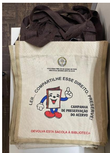
Figura 10 - Sacola de empréstimo