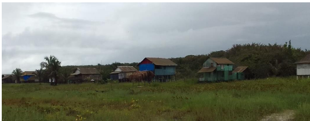
FIGURA 04 - Ranchos na praia do Castelo.

Para ter acesso à praia, os visitantes precisam, primeiramente, pegar uma embarcação no local chamado de “rampa” de São João de Pirabas, cujo local é um porto hidroviário que fica ao lado da Pricomar, uma antiga fábrica de pescado da região. A viagem dura um pouco mais de uma hora, sendo feita, geralmente, em períodos da vazante da maré e o valor da passagem varia de 10 a 20 reais dependendo da época do ano.