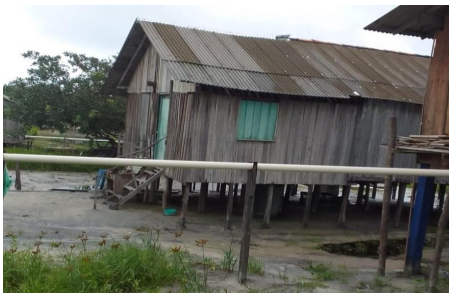
FIGURA 09 - Encanamento de esgoto das casas.

agentes do órgão ICMBIO e os moradores, foi acertado que haveria a troca dos banheiros das residências, visto que os atuais jogam dejetos dentro do córrego que corre atrás dos terrenos das residências, como mostra a figura 5 (os canos indo em direção a mata). Porém meses se passaram e nenhum morador recebeu os novos banheiros, nem orientação de como adquirir e como construir os banheiros adequados, assim como não receberam orientações e respostas em relação ao descarte do lixo.”