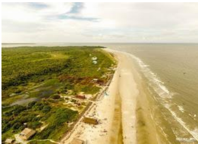
FIGURA 03 - Visão panorâmica da praia do Castelo