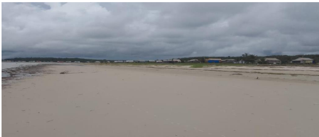
FIGURA 02 - Localização do objeto de estudo- Praia do Castelo

chamadas de “rancho”, moldando a paisagem da praia.