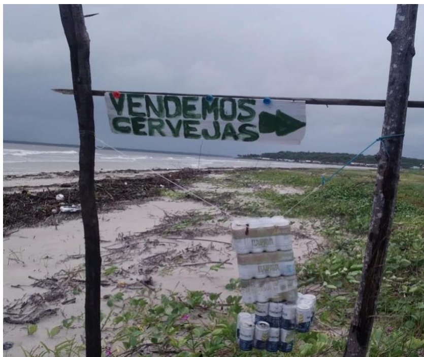
FIGURA 10 - Ponto de bebidas alcóolicas

através desses visitantes, oferecendo serviços para além de produtos domésticos, como a comercialização, por pequenas taxas, de internet e energia elétrica, já que na ilha ainda não existe energia elétrica por cabos de ligação. Outra atividade que vem crescendo na praia do Castelo é a venda de bebidas alcoólicas, como indica a imagem abaixo, um ponto de venda de bebidas alcoólicas.