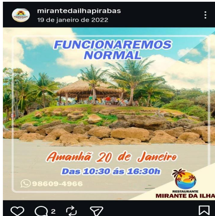
FIGURA 06 – Divulgação via rede social da praia do castelo.