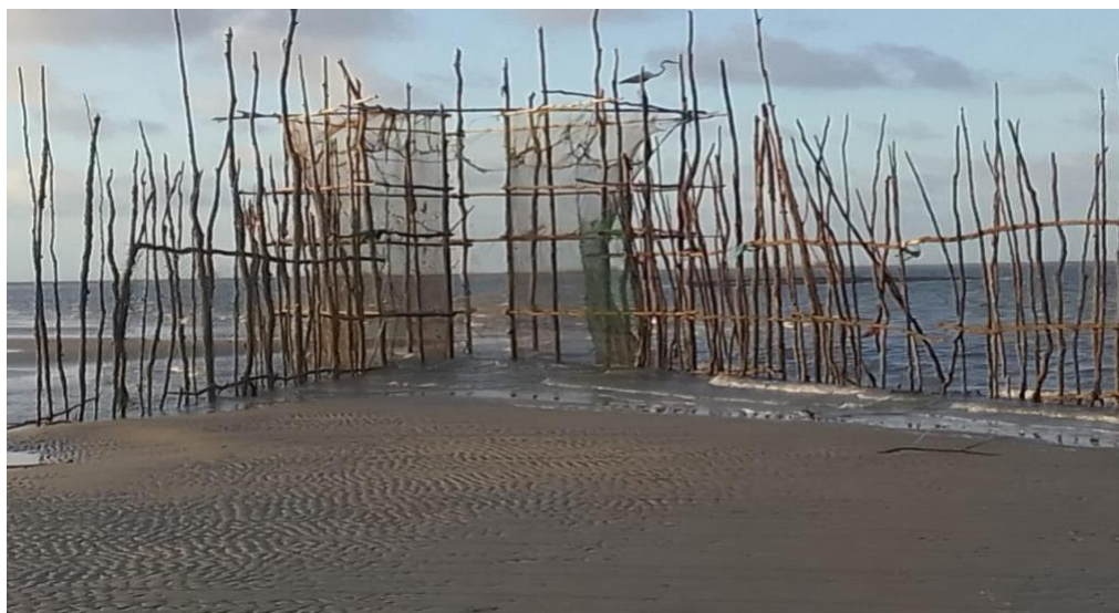
FIGURA 07 - Curral de pesca

praia, a prática é feita, principalmente, através de currais que são armadilhas construídas para capturar os peixes. Sua estrutura é feita com estacas de madeiras, retiradas pelos próprios moradores na floresta e de redes de pesca, como pode ser observado na imagem abaixo.