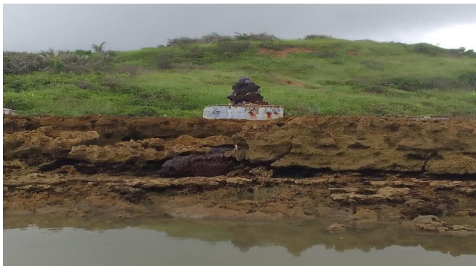
FIGURA 05 - Pedra do rei Sabá.

estátuas da cabocla Mariana e Iemanjá. O monumento fica localizado em cima de uma formação rochosa e calcária como é mostrado na figura 2, um local que desperta interesse de turista, cientista e interessados na área de geologia e paleontologia, por causa do seu vasto acervo que de fósseis do período cenozoico marinho (VERAS, 2021, p.3).