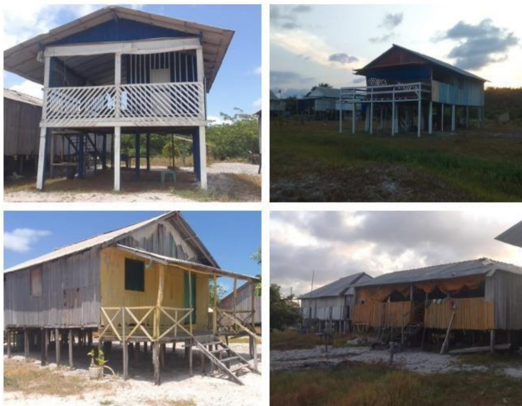
FIGURA 08- moradias da praia do Castelo

Na praia do castelo, ao longo da paisagem é perceptível a quantidade de ranchos em cima da vegetação de restinga. Araújo Filho (2021) define como uma vegetação que se desenvolve nos sedimentos arenosos na baixada litorânea, sendo uma vegetação levemente densa, onde sua vegetação de troncos finos não passa de 12 metros de altura. Os moradores relatam que há 10 anos era possível contar “a dedos” a quantidade de ranchos por toda a extensão da paisagem da praia, mas que, nos últimos anos, a construção de ranchos se intensificou deixando um traço marcante na paisagem pela quantidade de moradia construída atualmente, como pode-se observar na figura 4.