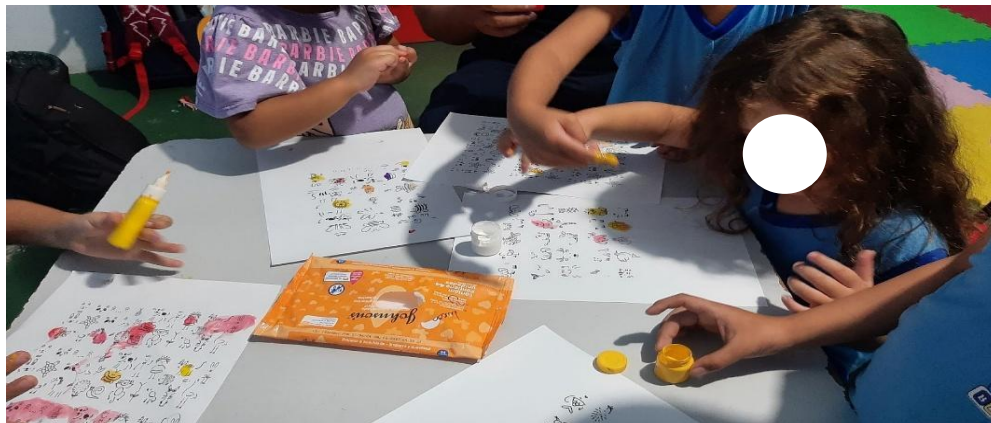
Fotografia 5 - Realizando as pinturas