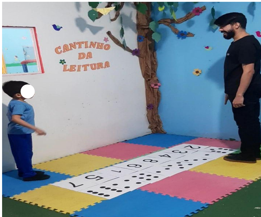
Fotografia 3 - Atividade com numerais e pontos.

criança associe os numerais com a imagem dos pontos, exercitando assim a contagem de numerais e o conhecimento numérico.