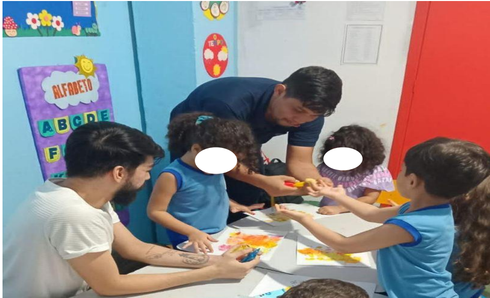
Fotografia 4 - Auxiliando as crianças com as tintas