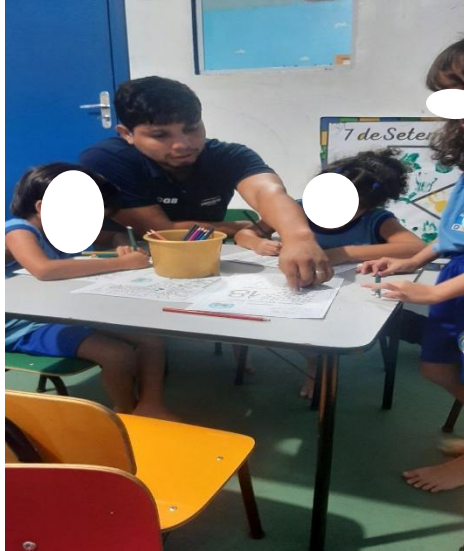
Fotografia 7 e 8 - Pintando desenhos