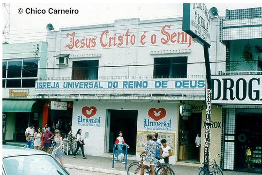
Imagem 10: Prédio do Cine Argus, após fechamento.

Muitos cinemas de rua conseguiram se manter por mais um tempo com a exibição de filmes pornô, para um público predominantemente masculino e bastante específico. Uma forma um tanto deprimente de encerrar a atividade de salas de exibição em cujas telas foram exibidos grandes clássicos do cinema. Mas, mesmo essa alternativa se esgotaria anos depois. Nos anos 90, muitos cinemas de rua do interior que ainda resistiam, fecharam suas portas. A arquitetura similar a um templo, própria de muitos cinemas de rua, fez com vários deles virassem igrejas evangélicas, como o caso do Cine Argus e do Cine Palácio (Belém). Poucos conseguiram chegar aos anos 2000.