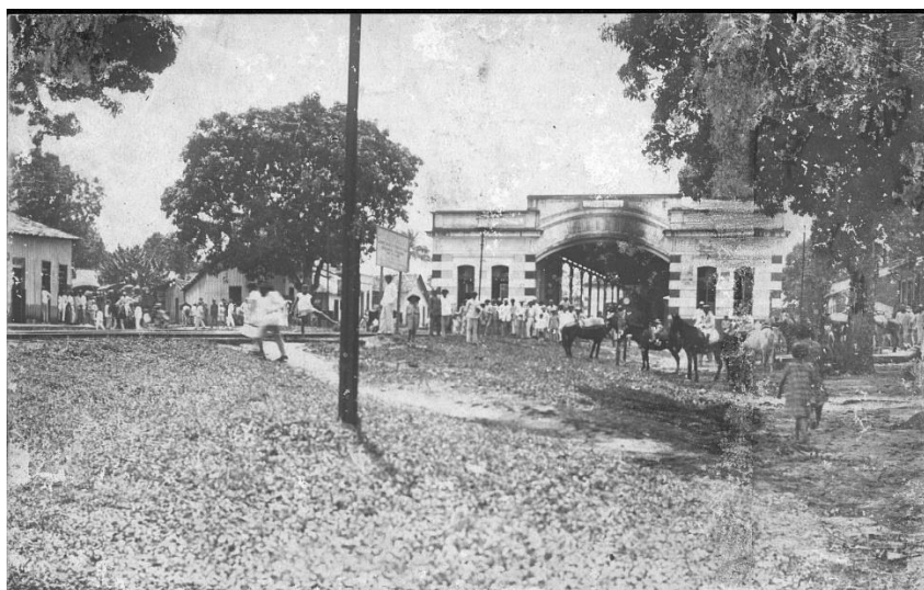
Imagem 6: Estação Ferroviária de Castanhal.