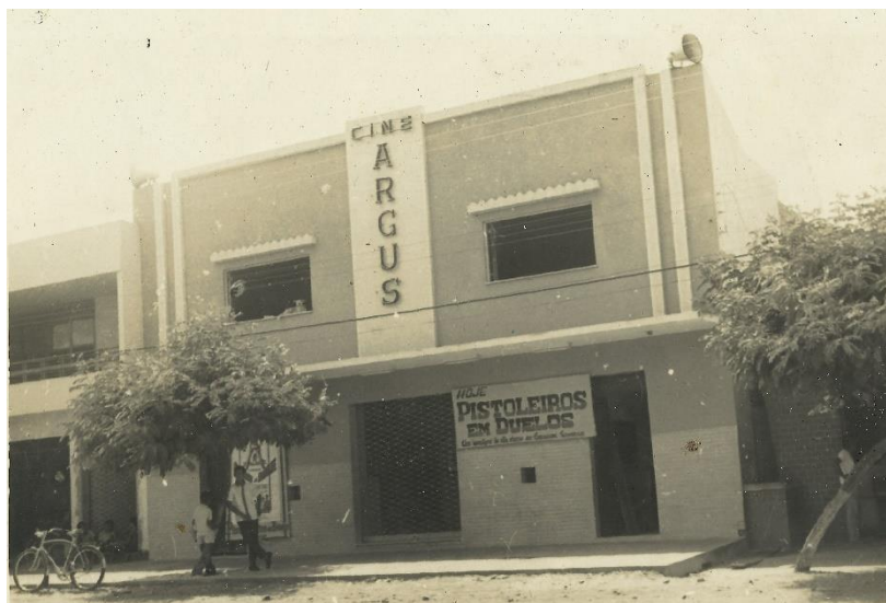
Imagem 4: Cine Argus, após a reforma. (outubro de 1967).

Nos anos 60, entrou em reforma e se modernizou, passando a contar com poltronas no lugar dos bancos corridos de madeira, fachada nova e um prédio todo em alvenaria, onde funcionou até encerrar suas atividades em 1995.