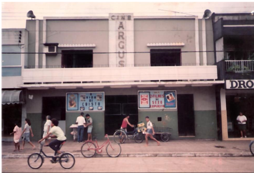
Imagem 9: Cine Argus, 1995.

A diversidade da programação do Cine Argus, bem como do circuito exibidor do qual este era o principal cinema, pode ser traduzida em uma foto de autoria de Júnior Lopes, feita nos anos 90, na qual há o cartaz à direita apresentava os dois filmes de sexo explícito em exibição, enquanto o da esquerda anunciava como atração da próxima semana A Vida e Paixão de Cristo .