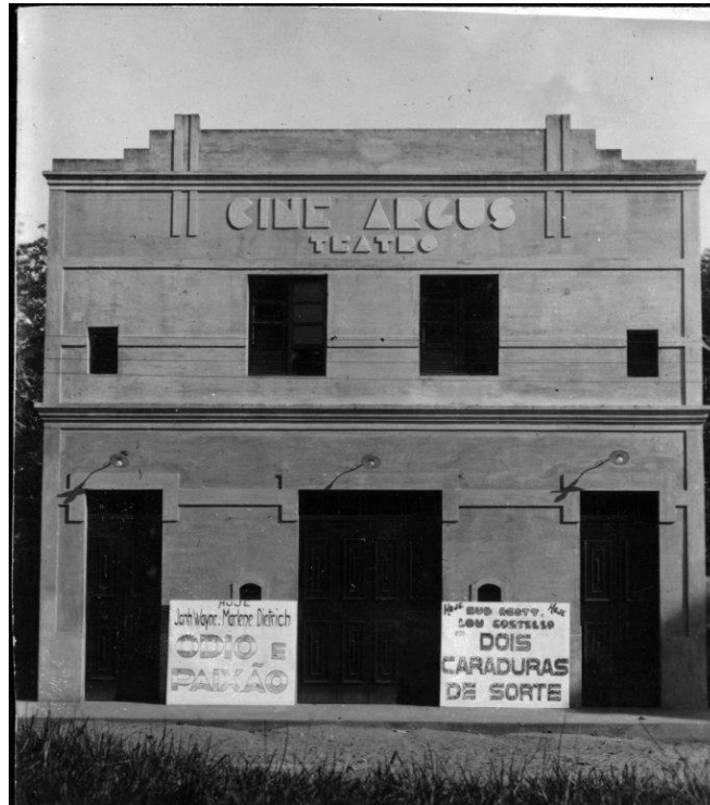
Imagem 3: Cine Argus (prédio definitivo), década de 40.

Estrada de Ferro Belém-Bragança), em um barracão de madeira com frente de alvenaria, com o nome Cine Argus Teatro.