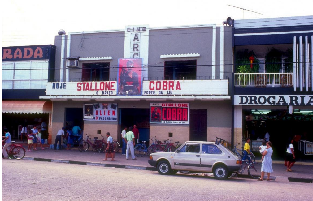
Anexo 10: Cine Argus. Década de 90. (uma das últimas fotos do Cine Argus)