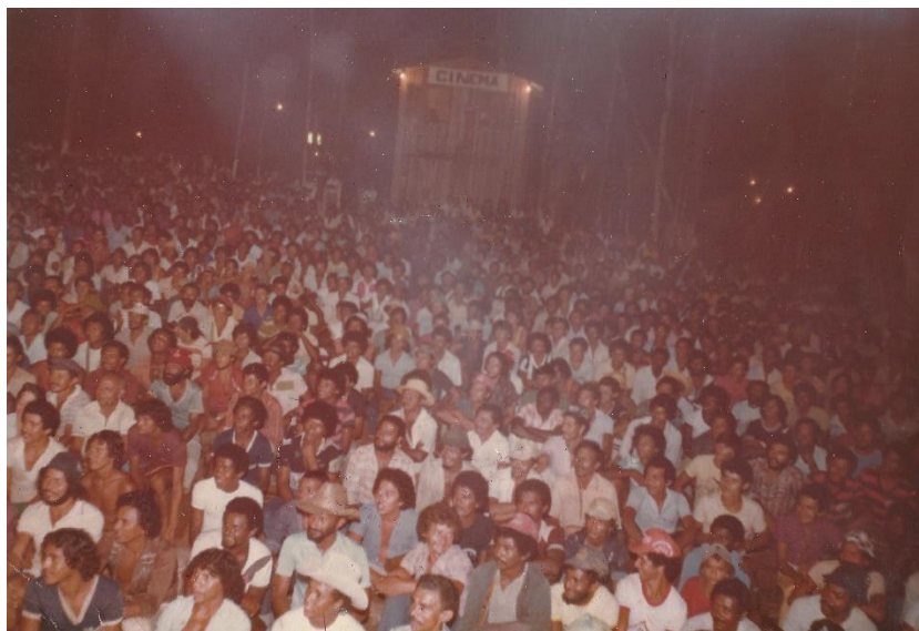
Imagem 8: Exibição de filme ao ar livre na Serra Pelada, década de 80.

de 30, em cidades como Abaetetuba, Santa Izabel, Breves, Capanema, Bragança, Tucuruí, Imperatriz/MA e Macapá/AP, e em grandes projetos como Jari e Serra Pelada.