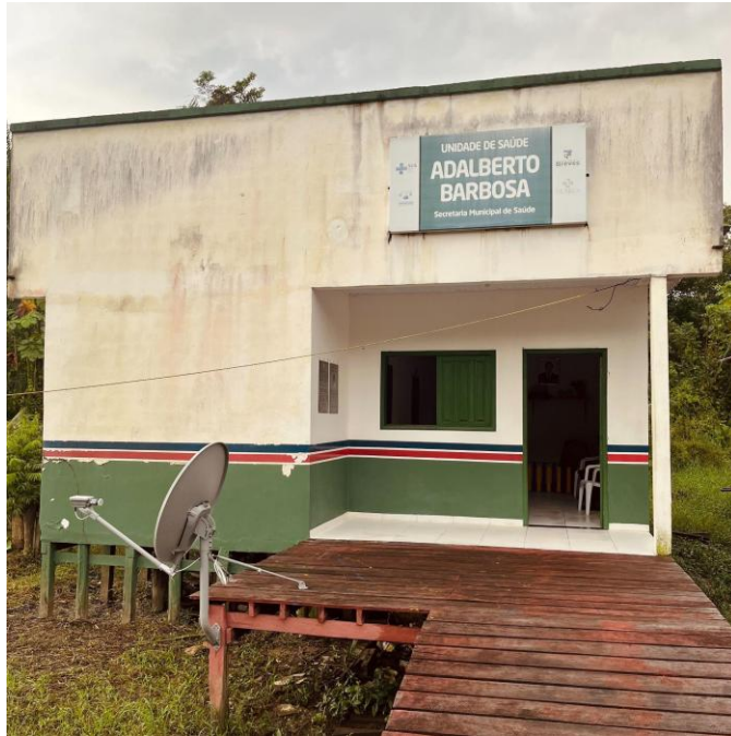
Figura 6: Frente do posto de saúde, 2025.