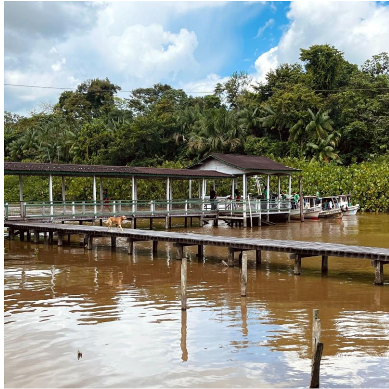
Figura 5: Manhã típica na comunidade, 2025.

A escola atende às etapas da Educação Infantil, do Ensino Fundamental e do Ensino Médio, mas, pela manhã, recebe apenas as turmas da Educação Infantil e do Ensino Fundamental. Ela não atende somente aos moradores da comunidade, mas também a estudantes de localidades próximas, abrangendo as três comunidades que margeiam o rio Aranaí: Cristo Rei, Nossa Senhora do Perpétuo do Socorro e Santa Maria. Para viabilizar esse deslocamento, a escola dispõe de seis barcos que garantem o transporte escolar – um recurso fundamental para que os alunos consigam frequentar as aulas com mais constância e comodidade, assegurando, assim, o direito à educação.