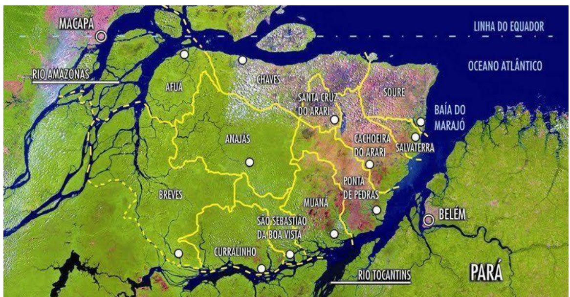
Figura 1: Mapa do Arquipélago do Marajó - Pará - Brasil.

O Marajó, maior arquipélago flúvio-marítimo do mundo, possui dezessete municípios, e, em termos de biodiversidade, é dividido em duas microrregiões: o Marajó dos Campos , localizado na parte oriental da ilha, conhecida como Região do Arari, abrange os municípios de Cachoeira do Arari, Chaves, Muaná, Ponta de Pedras, Salvaterra, Santa Cruz do Arari e Soure; e o Marajó das Florestas , localizado na parte ocidental da ilha, caracterizada pela região do Furo de Breves, que inclui os municípios de Bagre, Portel, Melgaço, Afuá, Anajás, Breves, Curralinho, São Sebastião da Boa Vista e Gurupá. Essa divisão retrata a diversidade do território em biodiversidade.