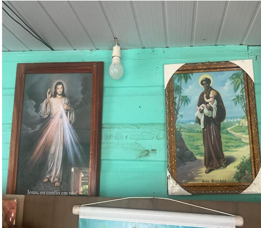
Figura 4: Símbolos de fé, 2025. Registro feito por mim.

A religiosidade ali não se apresentava como prática distante, mas como parte viva da organização do espaço, moldando a rotina e a tradição familiar. Como aponta Cavalcante (2010, apud Oliveira e Herbes, 2016, p. 74), “a fé se expressa em símbolos, ritos e imagens que não apenas representam devoção, mas também a renovam, fortalecendo laços de memória e pertencimento.” Essa ligação, no caso de minha madrinha, é tanto familiar quanto comunitária – reflexo de seu vínculo e do pertencimento à comunidade.