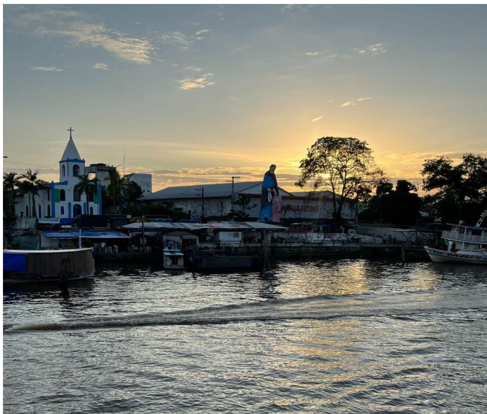
Figura 2: À beira da cidade de Breves, 2025.

Breves, conhecida como a “Capital das Ilhas”, é o principal centro urbano do arquipélago do Marajó e concentra serviços, comércio e circulação de pessoas que atendem boa parte das comunidades ribeirinhas da região. Situada ao sudoeste do arquipélago, entre rios-mar e uma extensa diversidade ecológica, a cidade compõe uma paisagem marcada pela confluência entre o fluxo dos rios e o ritmo da vida urbana. Segundo o Censo de 2022 do IBGE, Breves possui 108.968 habitantes. Embora o percentual entre população urbana e rural não tenha sido divulgado, sabe-se que grande parte do território municipal é composta por comunidades ribeirinhas, que dependem da cidade para acessar serviços essenciais – como saúde, educação e comércio, reforçando o papel central de Breves nas mobilidades cotidianas da região.