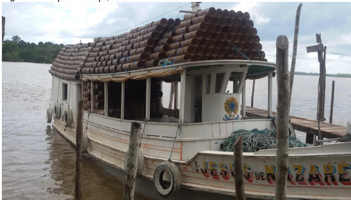
Figura 20 - Pesquisa de campo, barco de atravessador

Fonte: Maria Cristina, 28 de abril de 2018