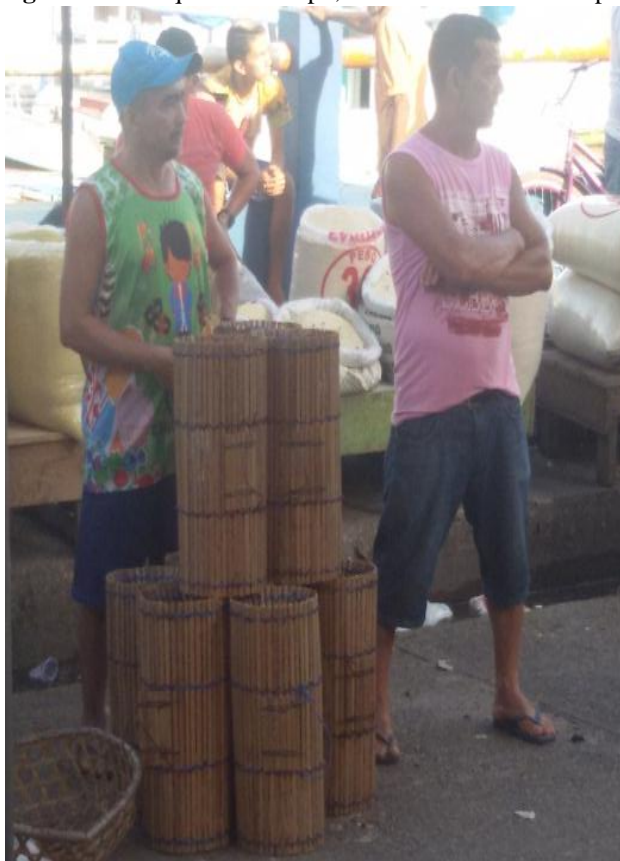
Figura 19 - Pesquisa de campo, artesão vendendo Matapi na feira

Fonte: Maria Cristina, 06 de abril de 2018