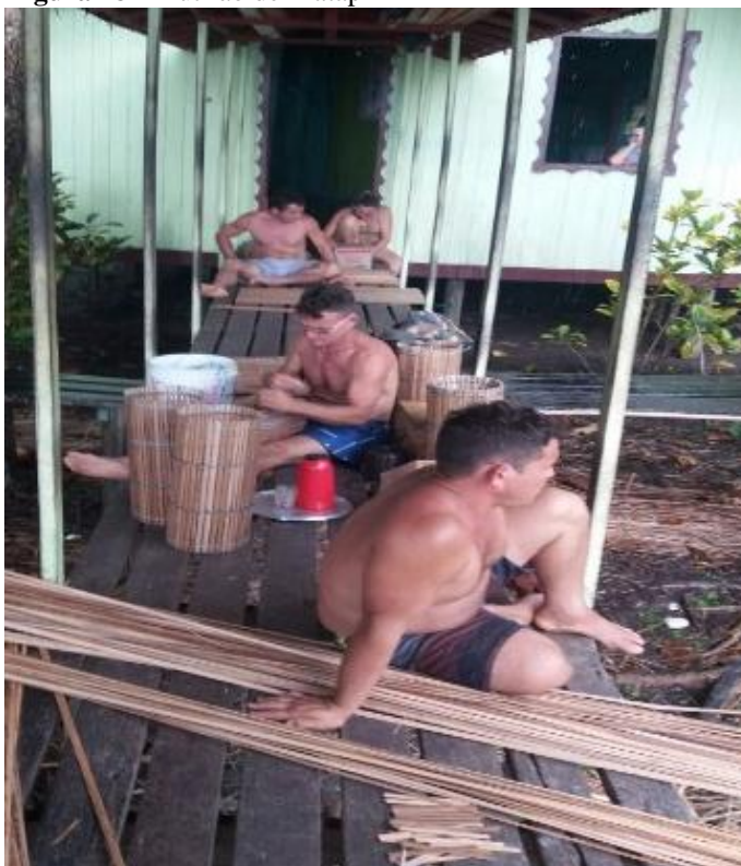
Figura 18 - Mutirão de Matapi

é uma relação muito antiga repassada de seu pai. Hoje ele observa que os jovens não têm muito interesse em trabalhar com esse artesanato por existir outros meios de sobrevivência “nos tinha ambição de fazer Matapi por necessidade, hoje eu falo que não dá para fazer, pois as pessoas não querem sentar para tecer, pois só os pais trabalham e os filhos ficam de fora” (AZEVEDO, 2018). A imagem abaixo mostra as famílias reunidas na ponte de um dos artesãos para trabalharem o mutirão de Matapi.