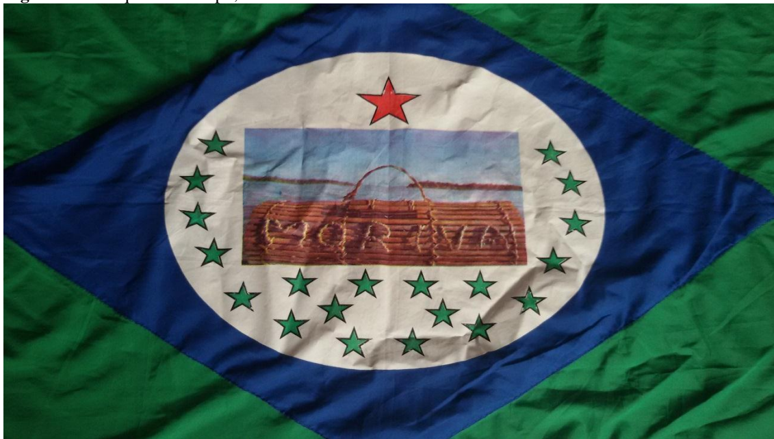
Figura 21 - Pesquisa de campo, bandeira do MORIVA