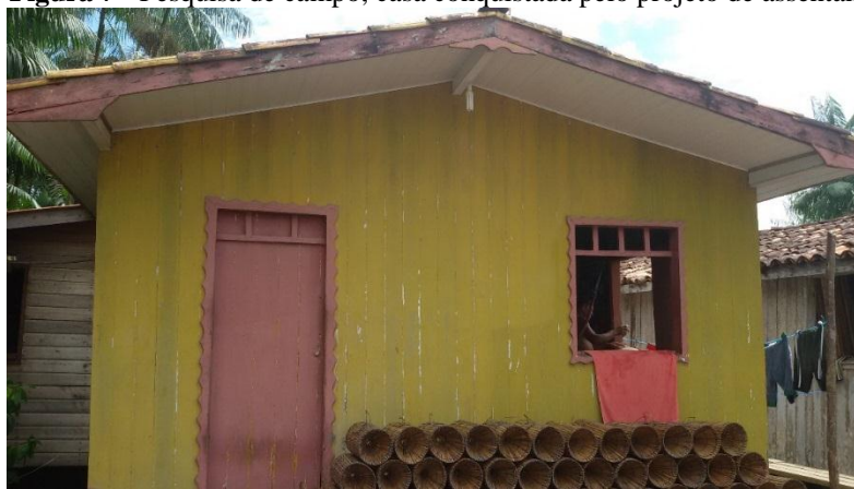
Figura 7 - Pesquisa de campo, casa conquistada pelo projeto de assentamento

Fonte: Maria Cristina, 22 de abril de 2018