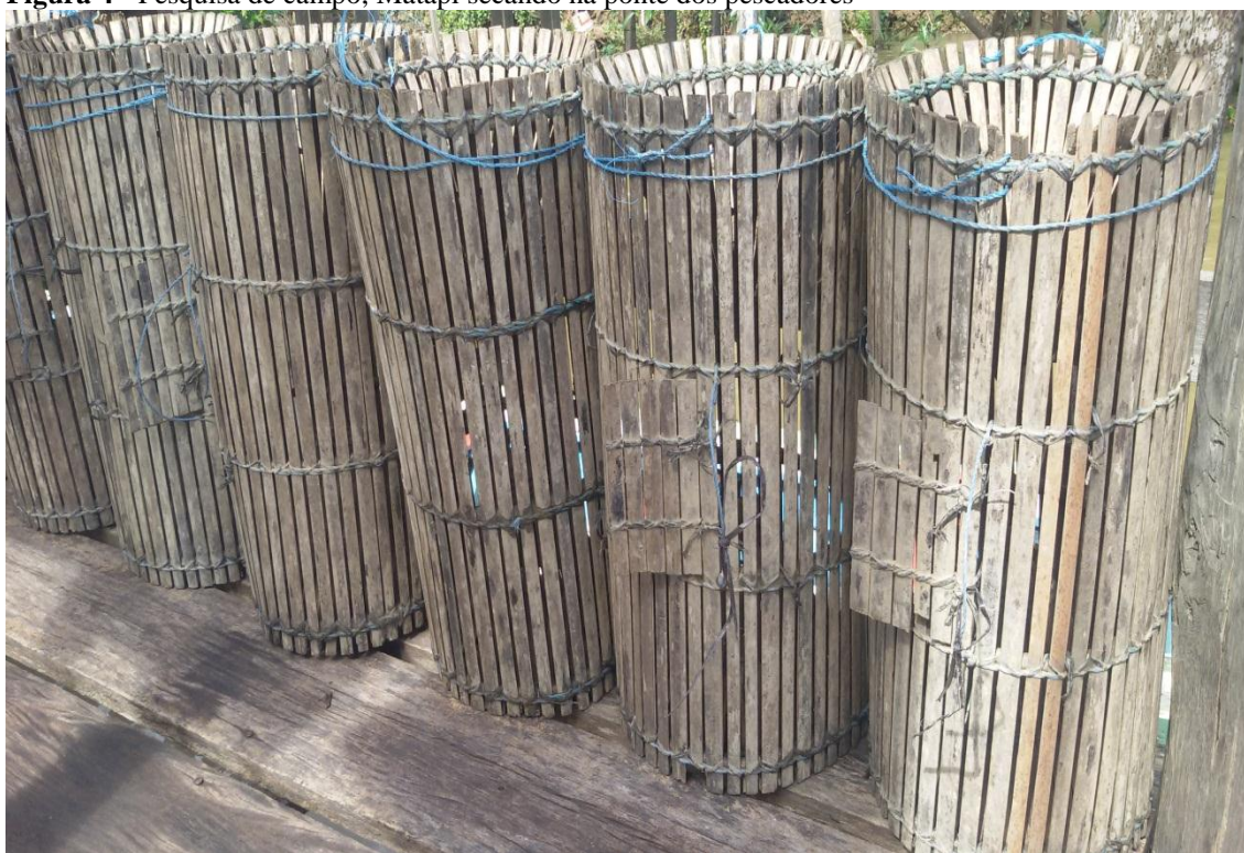
Figura 4 - Pesquisa de campo, Matapi secando na ponte dos pescadores

Fonte: Maria Cristina, 11 de maio de 2018