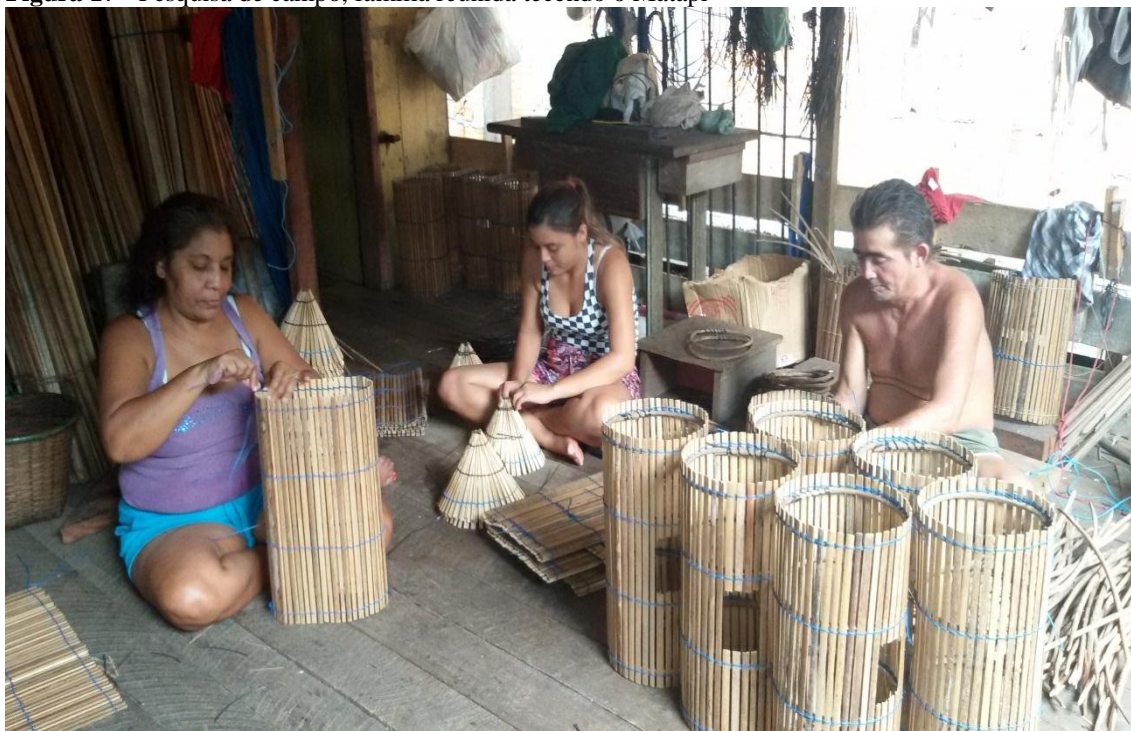
Figura 17 - Pesquisa de campo, família reunida tecendo o Matapi

Fonte: Maria Cristina, 21 de março de 2018