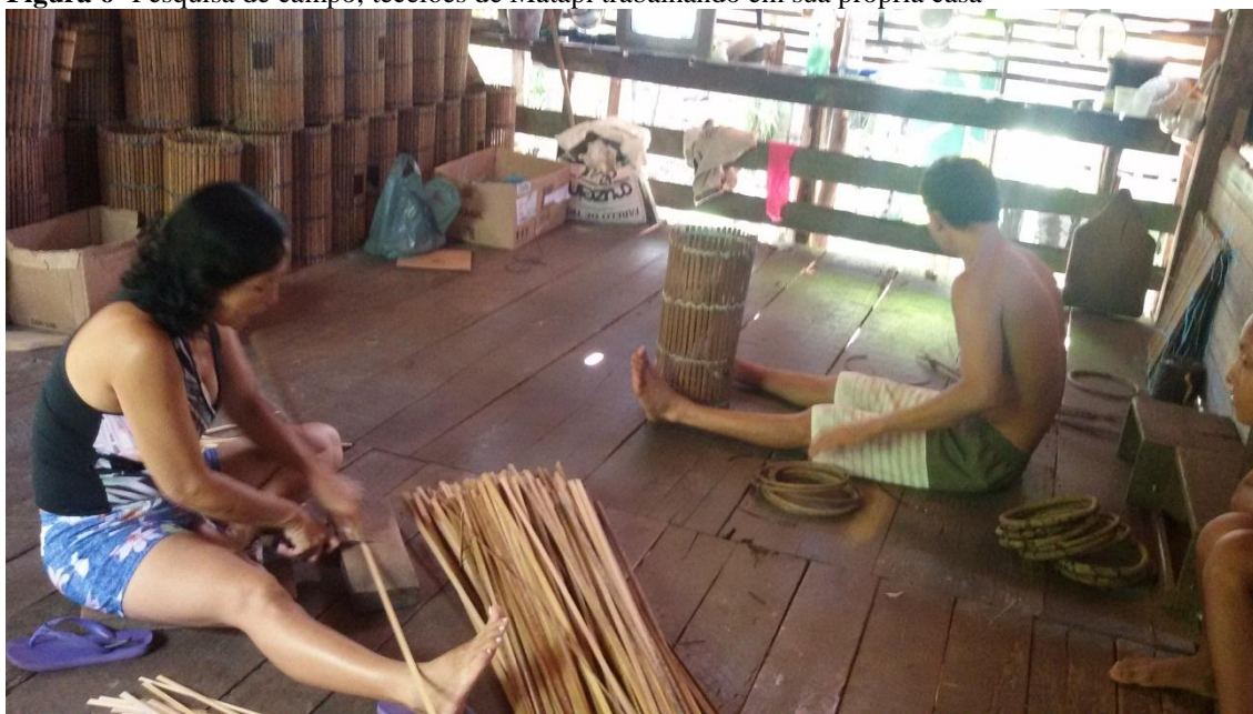
Figura 6- Pesquisa de campo, tecelões de Matapi trabalhando em sua própria casa