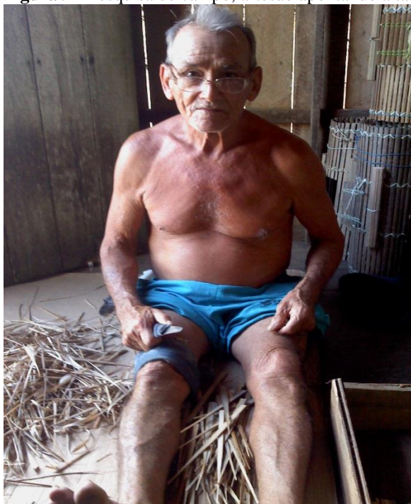
Figura 9 - Pesquisa de campo, artesão apontando a tala para o funil

Fonte: Maria Cristina, 14 de fevereiro de 2018