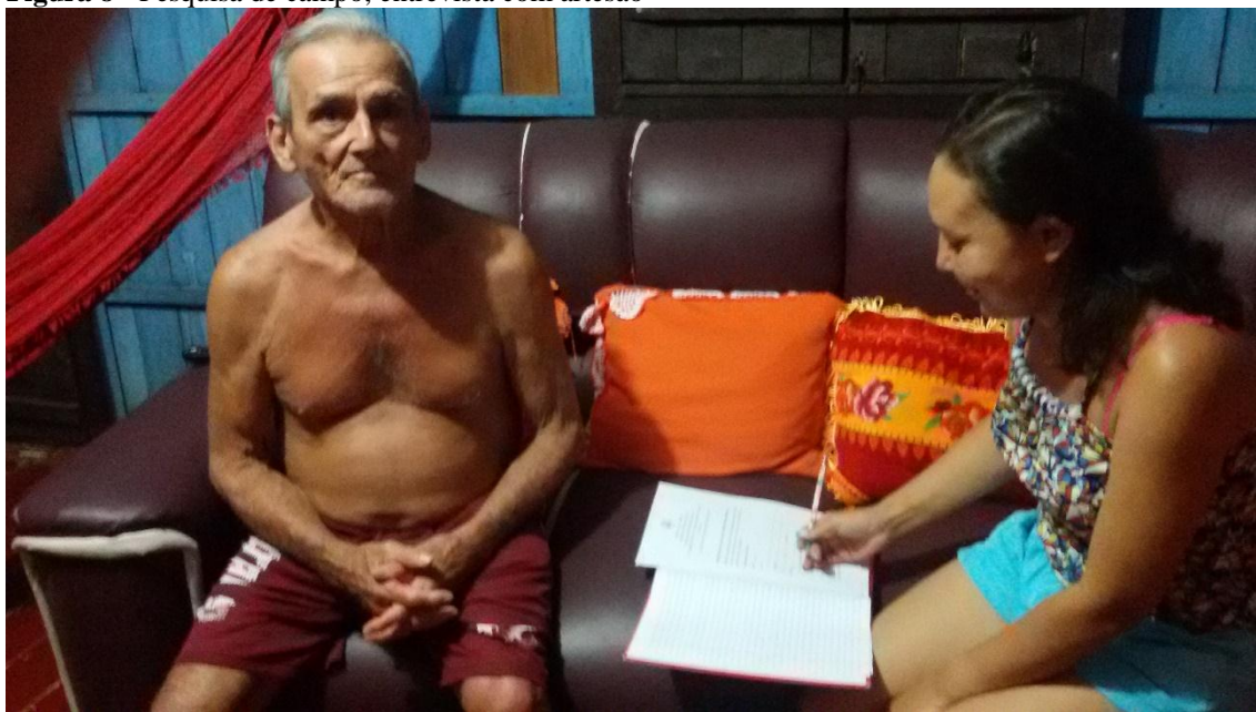
Figura 8 - Pesquisa de campo, entrevista com artesão

Fonte: Maria Cristina, 24 de abril de 2018