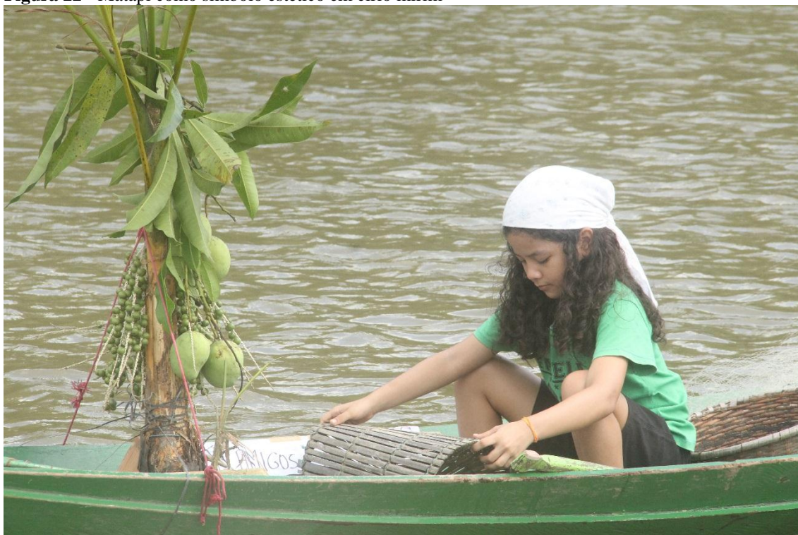
Figura 22 - Matapi como símbolo estético em círio mirim