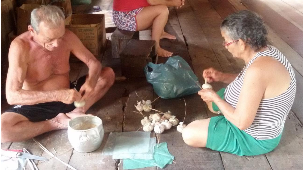
Figura 2- Pesquisa de campo. Pescador artesanal fazendo a puqueca com sua esposa

Fonte: Maria Cristina, 28 de maio de 2018