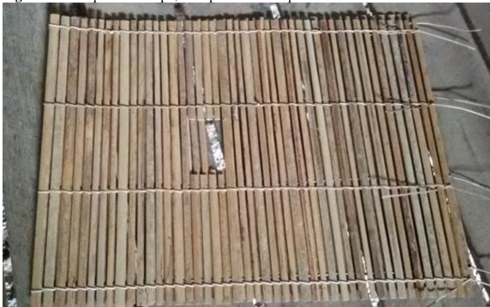
Figura 10 - Pesquisa de campo, Matapi feito com cipó