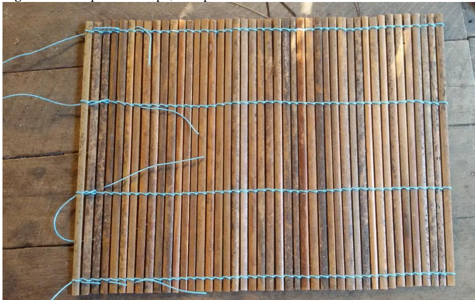
Figura 11 - Pesquisa de campo, Matapi feito com cabinho