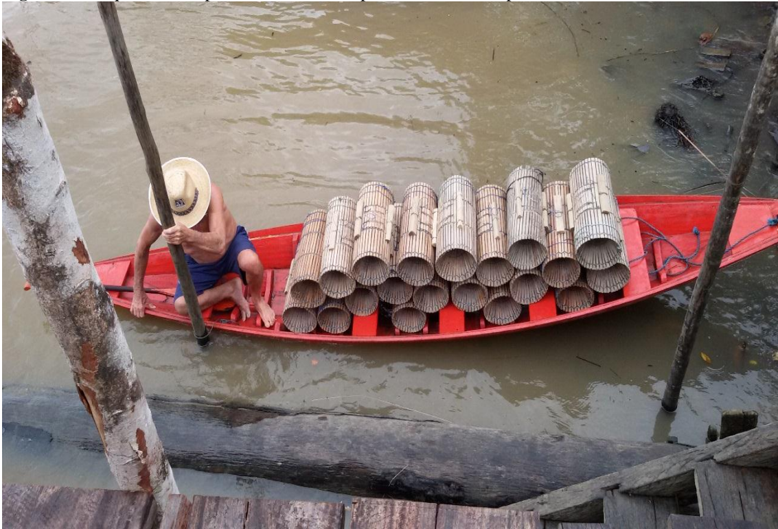
Figura 3 - Pesquisa de campo. Pescador saindo para colocar o Matapi