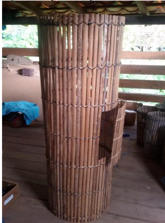
Figura 5 - Pesquisa de campo, Viveiro