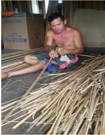
Figura 12 - Limpando tala