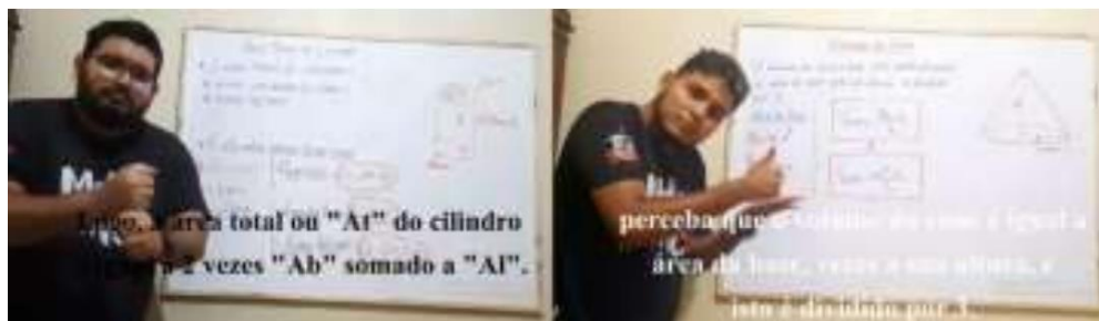
Aplicações matemáticas em LIBRAS

Dentro dos conteúdos matemáticos trabalhados nos vídeos que estão representados nas figuras acima, abordamos inicialmente a representação de sólidos geométricos e fórmulas dentro da disciplina de Geometria espacial, nesse contexto, no primeiro vídeo associamos como seria a representação destes sólidos na Língua Brasileira de Sinais em espaços públicos, a partir do processo de produção do material de acessibilidade partimos para a apresentação das fórmulas de área e volume destes sólidos e junto à isso uma breve atividade fazendo uso da mesma. Logo, o já supracitado material utilizou de recursos visuais tais como: desenhos dos sólidos geométricos em quadro branco que foram abordados, o uso de legenda em cores específicas para facilitar a visualização, camisas padronizadas de maneira que não atrapalhassem a visibilidade dos sinais em LIBRAS, de acordo com a NBR 15.290, que cita: Na janela com intérprete da LIBRAS: a) os contrastes devem ser nítidos, quer em cores, quer em preto e branco; b) deve haver contraste entre o pano de fundo e os elementos do intérprete; c) o foco deve abranger toda a movimentação e gesticulação do intérprete; d) a iluminação adequada deve evitar o aparecimento de sombras nos olhos e/ou seu ofuscamento (ABNT, 2005, p.13).