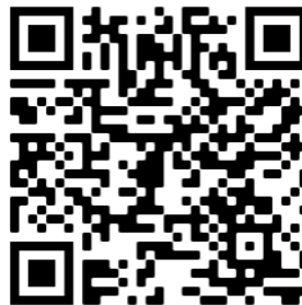
Figura 2: QR Code para E-Book

Podendo o E-Book ser acessado através do QRCode abaixo, veja a Figura 2. Nele você vai encontrar sinais específicos de Geometria Plana, sinais matemáticos, sinais dos dias da semana, escolares e muitos outros sinais.