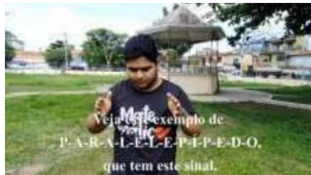
Vídeos de apresentação de sólidos