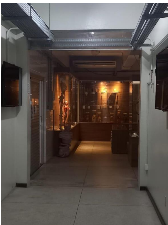
Figura 5 - Museu de Anatomia Humana.

Em Belém há o Museu de Anatomia da UFPA, e a cidade também abriga o Museu da Medicina Paraense, voltado à preservação da memória e da história da prática médica na região. No entanto, entre essas instituições, apenas o Museu de Anatomia da UFPA se configura como o único espaço museológico que abriga especificamente peças anatômicas em sua exposição. Essa particularidade o torna uma referência singular no estado no que diz respeito à conservação e à divulgação de acervos relacionados ao corpo humano, tanto para fins educativos quanto científicos.