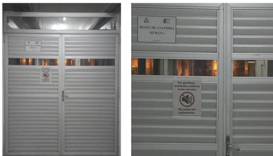
Figura 4 - Museu de Anatomia Humana - Porta de entrada e placa de identificação do museu.