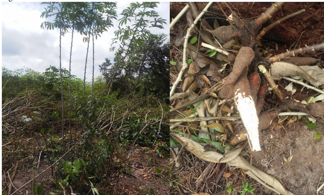
Figura 2: Maniva e raiz da variedade Pretinha .

As figuras a seguir foram colhidas a partir da pesquisa e campo nas roças das unidades familiares da comunidade quilombola Centro Ouro, entre 2018 e 2020. Elas mostram a presença das duas variedades de mandioca mais encontradas nas roças dos agricultores de Centro Ouro, atualmente. A imagem da variedade pretinha (Figura 2), mencionada pelos entrevistados, constitui a mais resistente às intempéries e ação do tempo, é considerada resistente a água quando colocada “de molho”.