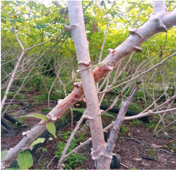
Figura 3: Maniva Amarelona