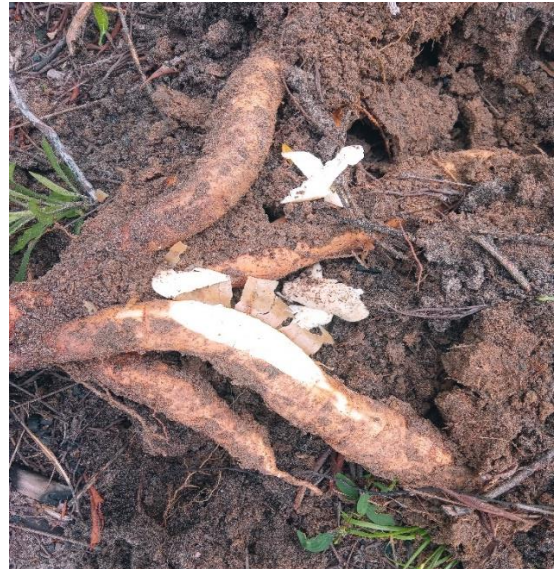
Figura 4: Raiz da mandioca Amarelona