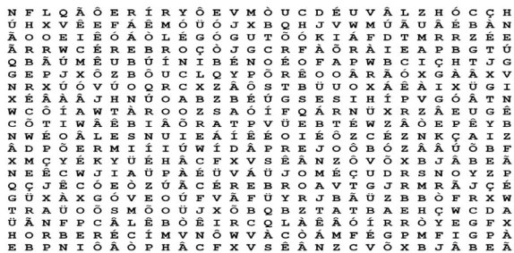
Figura 3. Instrumento utilizado no primeiro experimento.

seu cérebro?”. Para isso, iniciávamos com o questionamento e deixávamos o participante formular seu pensamento sobre o assunto. Em seguida, o convidávamos a realizar o experimento, no qual deveria pesquisar em um caça-palavras a palavra “cérebro” que se dispunha em todas as direções (Figura 3) e, ao mesmo tempo, deveria ouvir uma história, lida pausadamente e, simultaneamente, contar quantas vezes foi mencionada a palavra “cérebro”. Era perceptível a dificuldade, por conta da divisão dos recursos atencionais. O participante era, então, questionado a respeito da experiência a partir da qual estabelecíamos a discussão e explicação embasada em estudos científicos.