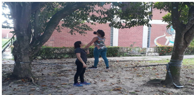
Figura 4. Demonstração do segundo experimento.

No segundo experimento, o participante caminhava com e sem a utilização de óculos de realidade virtual no solo e em equipamento slackline 1 (Figura 4). Esse experimento permitia ao participante avaliar as influências da superfície de contato, das informações visuais, proprioceptivas e táteis no equilíbrio. As observações e sensações dos participantes possibilitavam a discussão sobre o funcionamento integrado de diferentes sistemas corporais para a manutenção do equilíbrio e boa execução das funções diárias e das bases neuroanatômicas e funcionais que permitem ao sistema nervoso comunicação e adaptação.