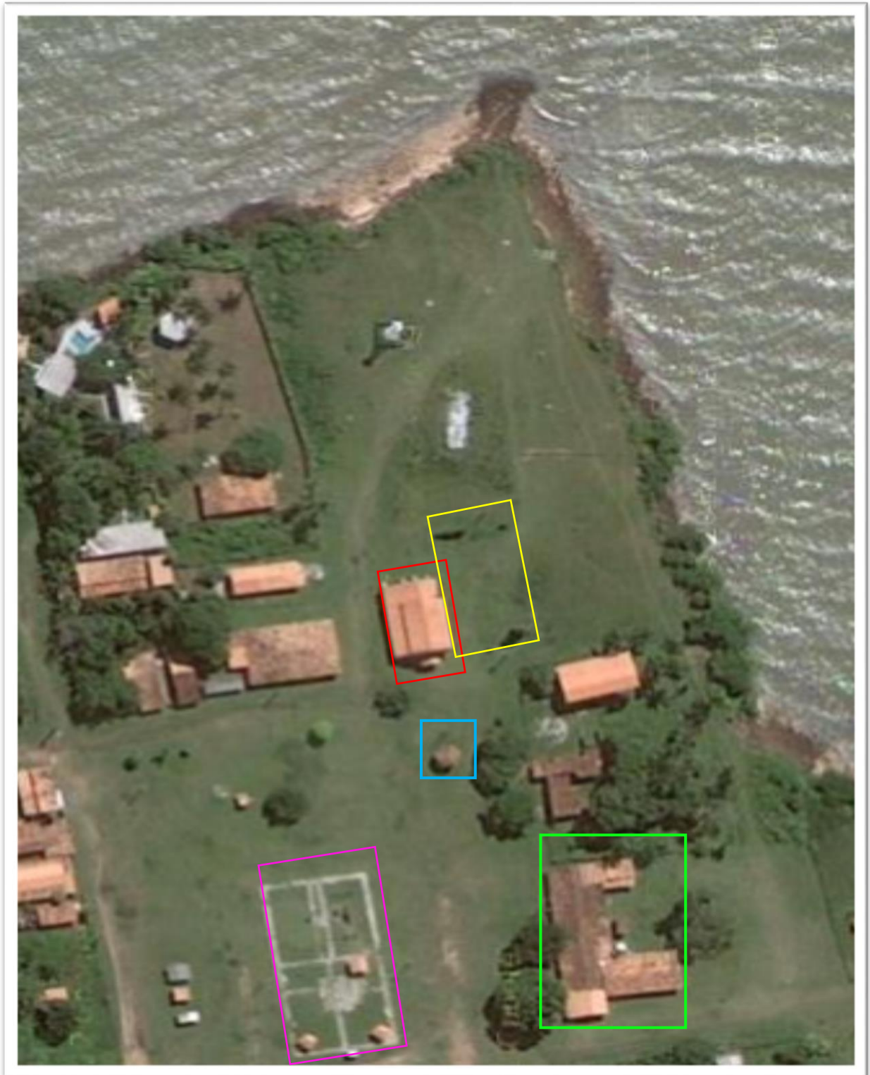
Figura 6 - Vista aérea da Praça Municipal