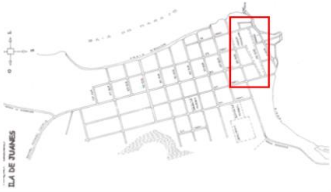
Figura 5 - Mapa da Vila de Joanes