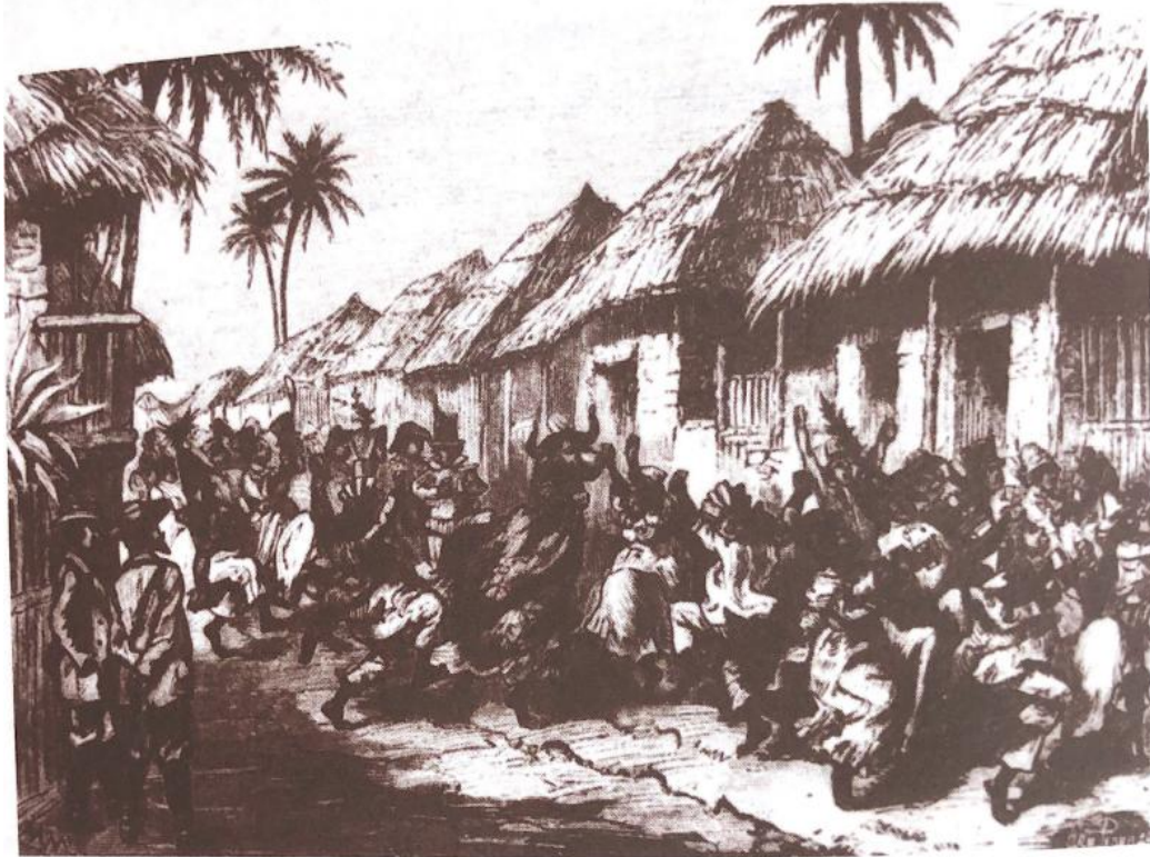
Figura 16: Gravura “bumbá” de 1883 em crônica “Uma viagem ao Amazonas”.

vê o “bomba” (sic.) desfilando por uma rua da localidade de Pinhel, a vinte léguas de Santarém, no interior da Província do Pará, precedido de festivo cortejo. Essa movimentada cena, na verdade um cortejo e cujos participantes eram todos negros, se transcreve, devido ao interesse que apresenta (MOURA, 1997, p. 56).