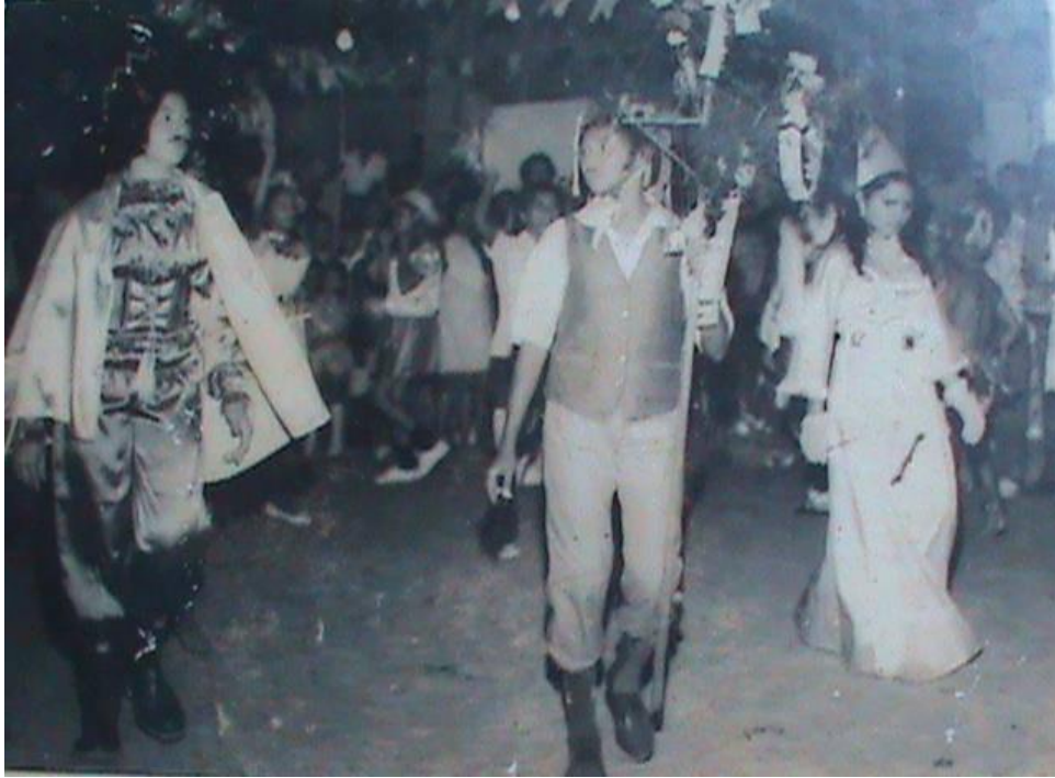
Figura 14: Registro do pássaro Beija-Flor (S/D).