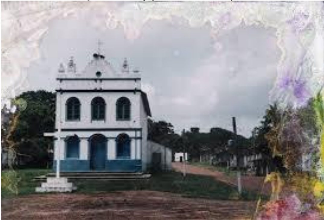
Figura 2: Foto da Igreja de Santa Ana Alto Bujaru.