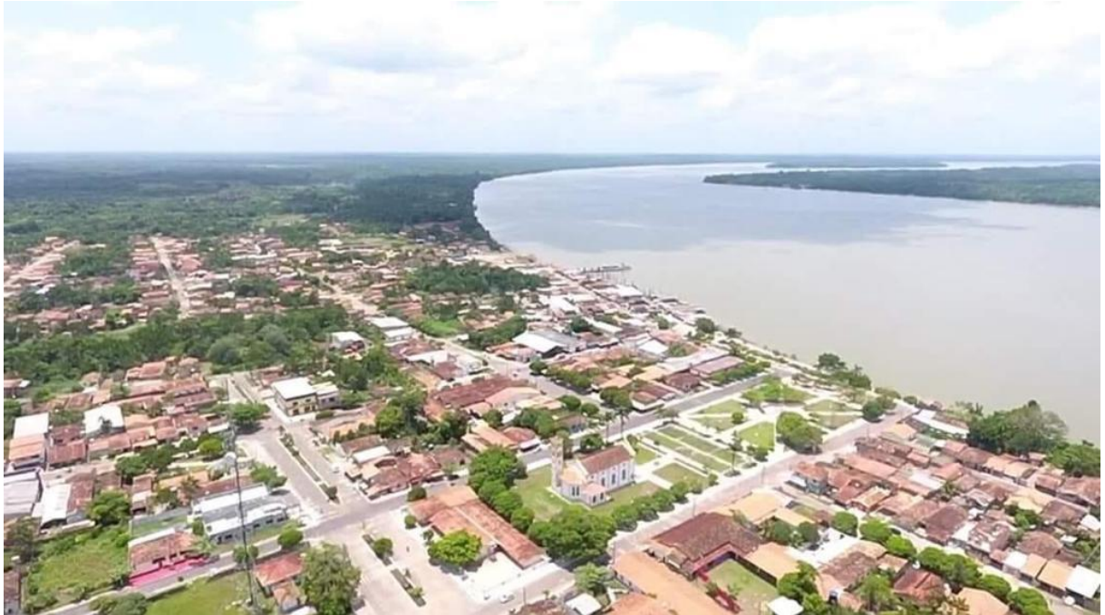
Figura 1: Vista aérea de Bujaru na margem esquerda do rio Guamá.

Bujaru, em 30 de dezembro 2020, completou 77 anos de emancipação. Sua população estimada, em 2016, era de 28.016 habitantes. Possui uma área de 990,399 km 2 . (IBGE 2008). A partir do decreto lei 4.505, assinado pelo então interventor federal Magalhães Barata, o distrito de Guaramucu ganha o título de município. Antes é importante registrar que na época da colonização o lugar chamava-se Guaramucu, com o passar dos anos e a necessidades de desenvolvimento a cidade mudou de lugar e de nome e passa a se chamar Bujaru: “ai que saudades eu sinto de lá, Bujaru minha cidade, nas margens do Rio Guamá”. (Trecho de canção composta pelo cantor bujaruense Haroldo Reis, anos 2000).