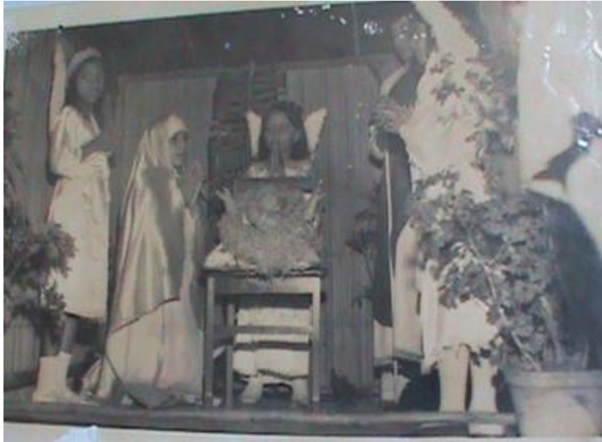
Figura 8: Pastorinhas no Teatro Martins Melo (S/D).