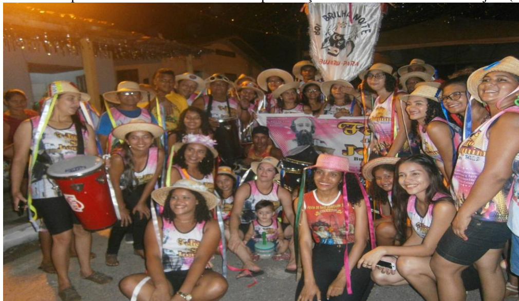
Figura 19: Componentes do Boi Brilha Noite em apresentação no Auto do Padroeiro de Bujaru (2019)