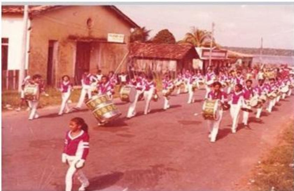
Figura 3: Registro de desfile escolar em frente ao antigo prédio do Teatro Martins Melo década de 1970.