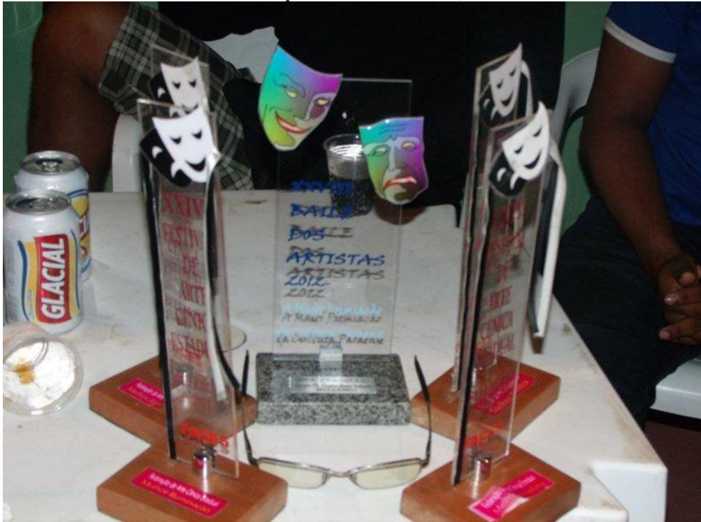
Figura 28: Troféus (melhor iluminação, melhor sonoplastia, melhor direção e melhor elenco em cena, e grupo destaque no baile dos artistas)