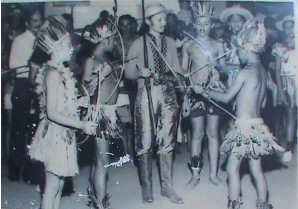
Figura 15: Registro do pássaro Beija-Flor, cena da maloca, captura do caçador (S/D).