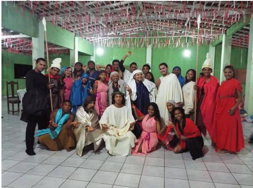
Figura 23: Elenco Paixão de Cristo na comunidade de Santana (2013).

Eu comecei no grupo teatral Bom Intento através da Paixão de Cristo, foi uma das apresentações que me chamou atenção e que me trouxe para o grupo, depois disso eu pensei que seria assim uma coisa assim passageira, aquela coisa de momento, mas eu vi que foi uma coisa que me chamou muita atenção e fez eu me apaixonar a ponto de ficar esse tempo todinho no grupo, mesmo quando agente ta sem atividade mesmo tendo cada um de certa forma seguindo um caminho, eu me formei em agronomia, vocês estão se formando na área mesmo, outras pessoas se formaram em dança, uns se formando em biologia, é! Mas o teatro sempre presente, por que através das apresentações a gente acaba ficando um pouco mais solto para apresentar, as atividades na faculdade e tudo mais e foi mais ou menos isso (SILVA 2020).