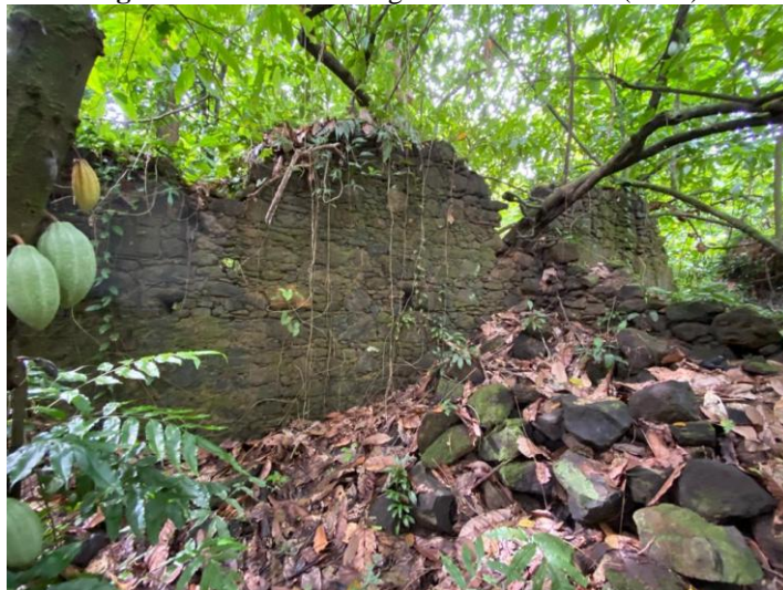
Figura 20: Ruínas do Engenho Bom intento (2021).

Esse lugar o Bom Intento 8 , que dar nome ao grupo, é até hoje um sítio arqueológico abandonado cortado pelo igarapé de mesmo nome, fica distante cerca de três a quatro quilômetros da sede do município. Essa área rural é considerada sítio arqueológico, ainda não documentado, carrega extensa história sobre o período da colonização da Amazônia nessa região, guarda o lugar onde outrora fora um dos maiores engenhos de cana de açúcar da região, também foi palco de muito sofrimento de homens e mulheres negras escravizados, que eram forçados ao duro trabalho no engenho.