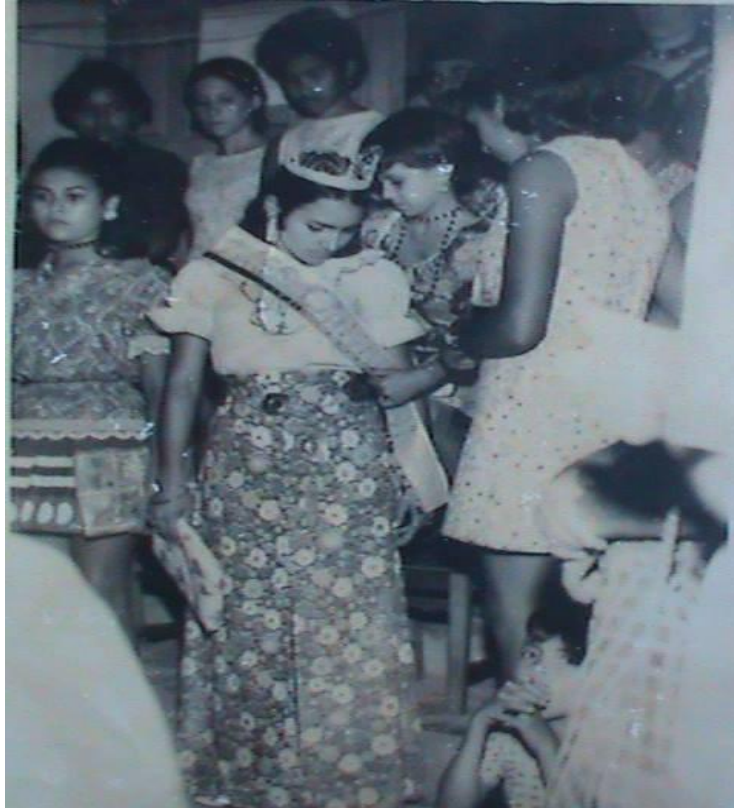
Figura 5: Registro de concurso de miss caipira em uma festa no prédio Martins Melo (S/D).