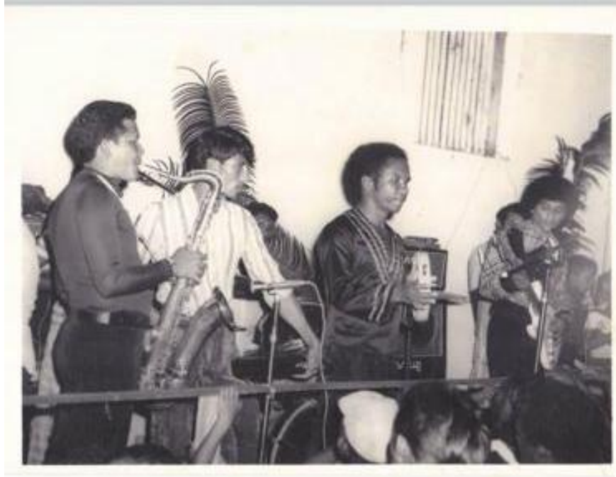
Figura 12: Baile com a Banda do Pim, (irmão do cantor paraense Pinduca) (S/D)