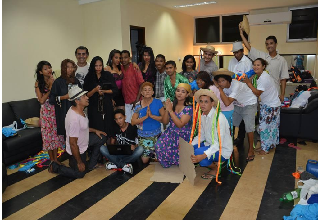
Figura 30: Camarim do Teatro Margarida Schivassapa. Espetáculo “O Carro dos Milagres” (2014)

Fonte: Fonte: Acervo Bom Intento (2013).