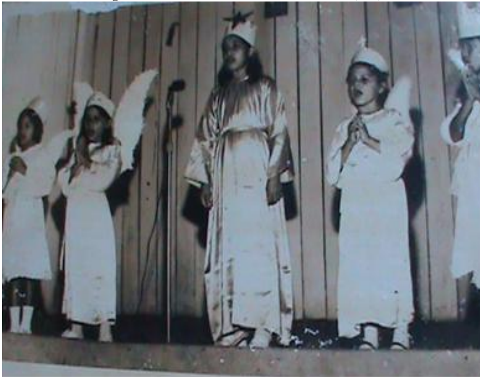
Figura 7: Pastorinhas no Teatro Martins Melo (S/D).