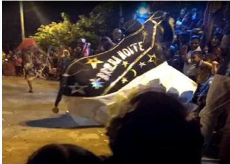
Figura 18: Boi Brilha Noite em apresentação na praça das bandeiras (1995).