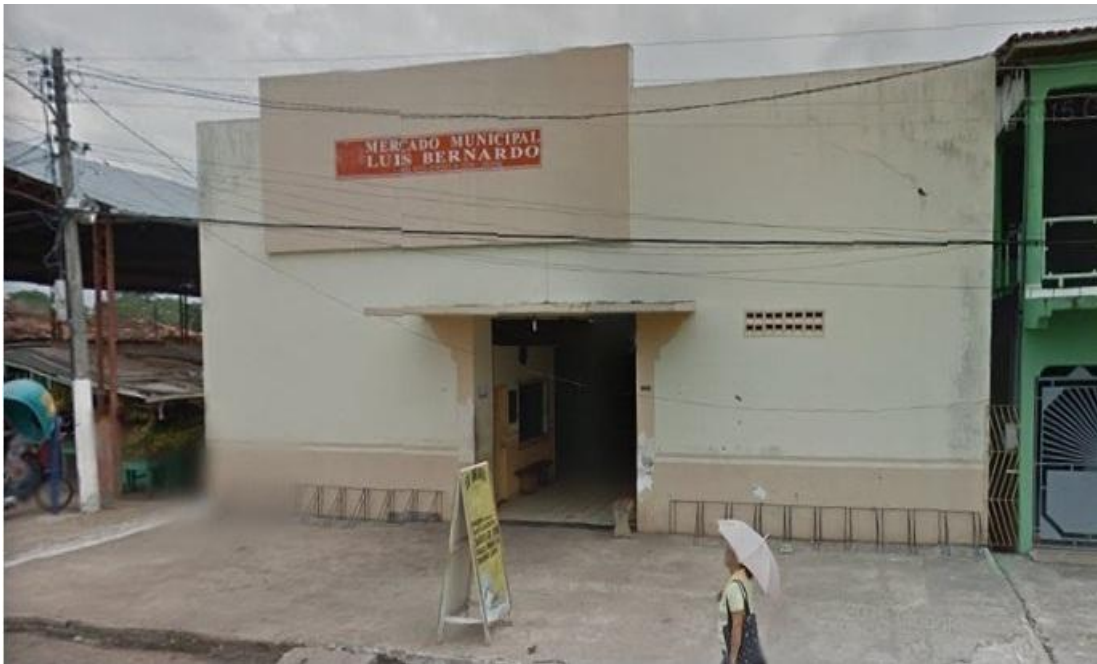
Figura 4: Prédio Teatro Martins Melo; atualmente como mercado de carnes de Bujaru.