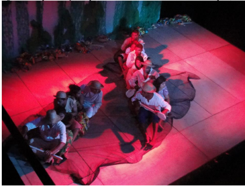
Figura 26: Apresentação Espelho da Noite. Teatro Waldemar Henrique (2011)