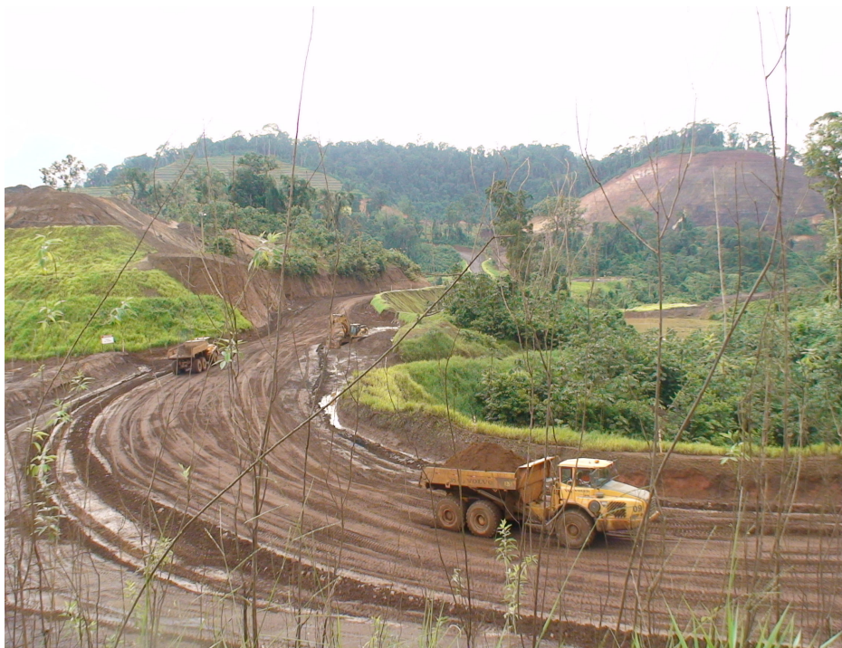
Figura 15 - Cenário da área de lavra de ouro na bacia do rio William com os cortes, taludes e com implantação dos ecossistemas emergentes (revegetação) de gramíneas.