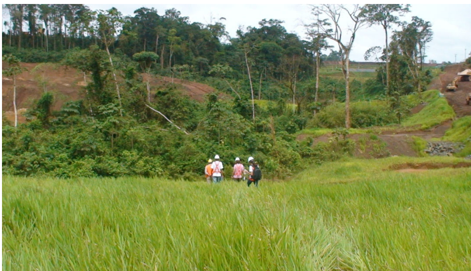
Figura 6 – Ecossistemas emergentes (revegetação) produzidos pela empresa MPBA, caracterizando o cumprimento pela empresa dos programas de recuperação das áreas degradadas. (PRAD).