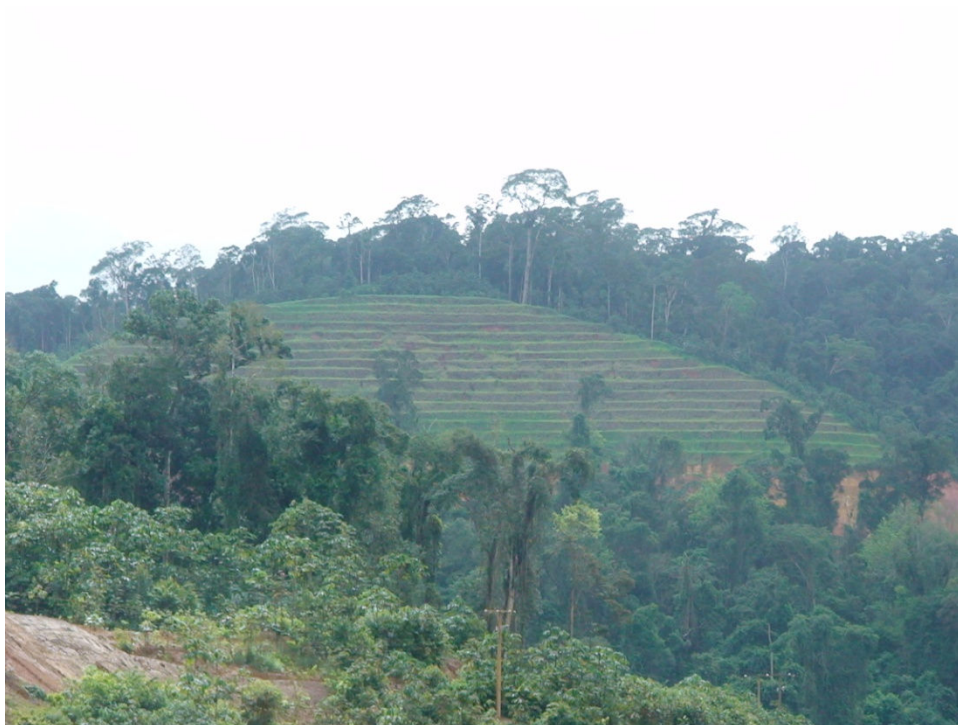
Figura 10 – Áreas totalmente recuperadas por ecossistemas emergentes (revegetação) nos palcos de material retirado da mineração da empresa MPBA.