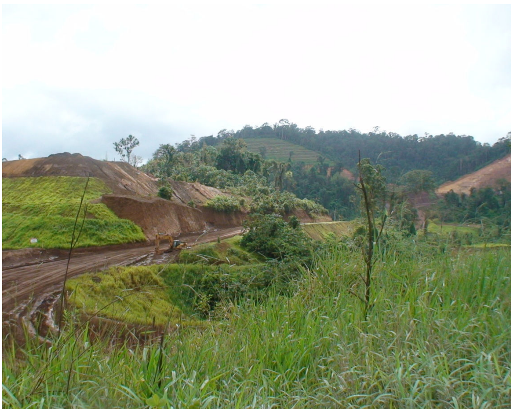
Figura 11 – Construção de ecossistemas emergentes (revegetação) em áreas desmatadas pela empresa MPBA.