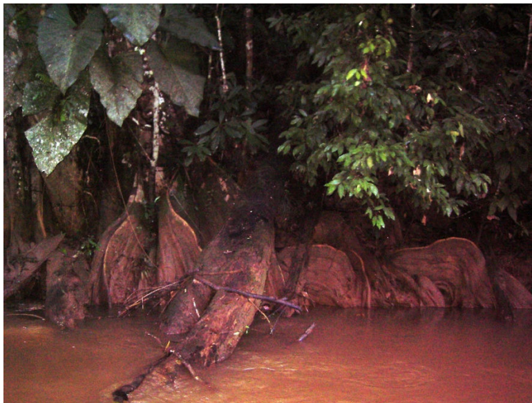
Figura 16 - Detalhe das raízes sub-aéreas da vegetação de margem do igarapé William e a influência do grande volume de sedimentos que o rio carrega.

são carreados para estes ecossistemas, o que acaba afetando a vegetação que ali se encontra (figura 16)