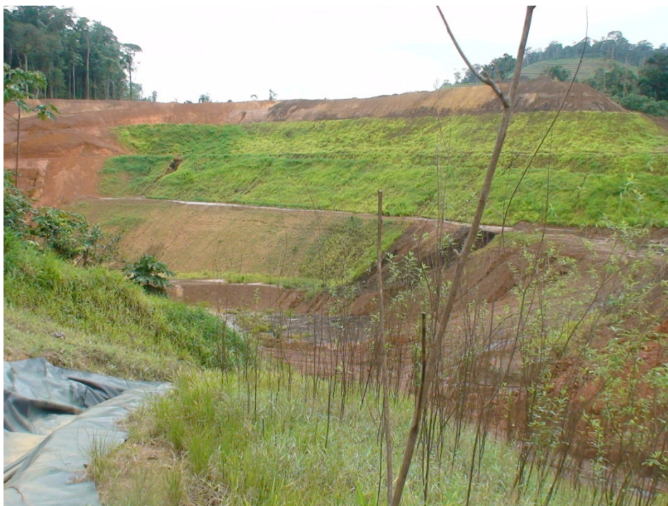
Figura 9 – Detalhe do desenvolvimento de ecossistemas emergentes (gramíneas) nos taludes trabalhados pela empresa MPBA.