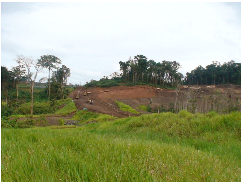
Figura 5 – Contraste das duas vegetações na região da mina de ouro da MPBA. Ecossistemas emergentes (revegetação) e a vegetação primária, ao fundo.