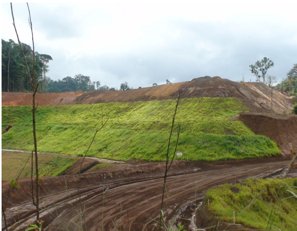
Figura 12 – Ao fundo, restos de vegetação de florestas primárias e, em primeiro plano, porções de revegetação construídas pela empresa MPBA.