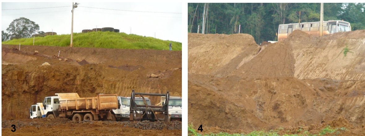
Figuras 3 e 4 - Detalhes das atividades de mineração de ferro da MMX e ecossistemas emergentes (revegetação) de gramíneas (Fig.3) e área totalmente devastada nos taludes de material retirado desta mesma empresa (Fig.4).