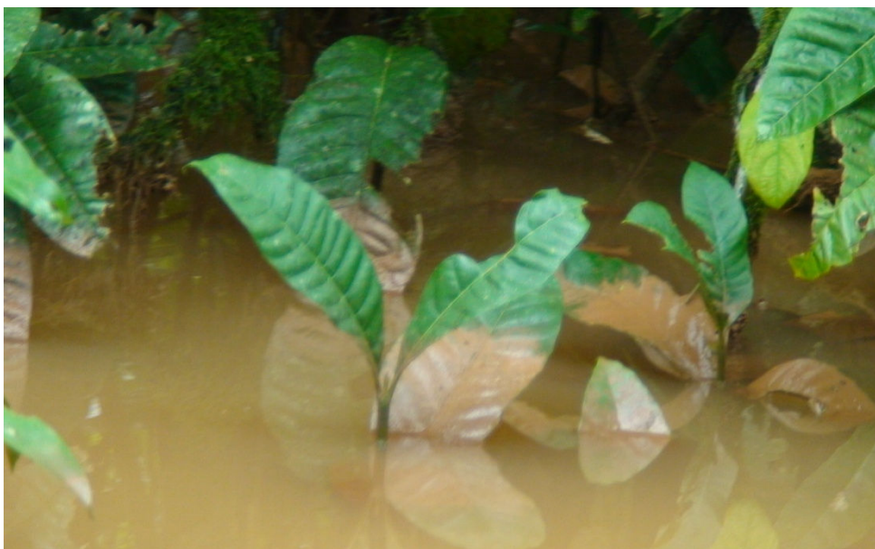
Figura 14 – Vegetação ripária afetada por sedimentos provenientes da área de mineração de ferro da empresa MMX.