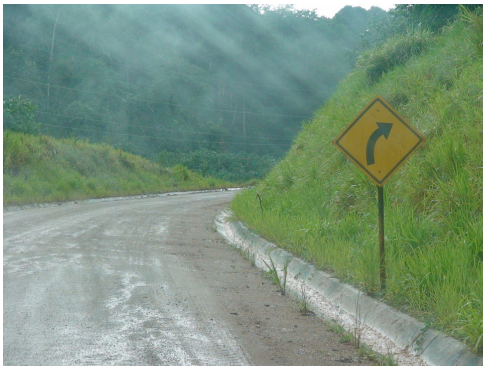
Figura 13 – Estrada de acesso a área de mineração de ouro, com dois tipos de vegetação, a primária (ao fundo) e a emergente (revegetação) na área da empresa MPBA.