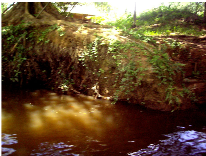
Figura 17 – Erosão nas margens do igarapé William, afetando a vegetação e contribuindo para o assoreamento do curso hídrico. Fonte: (MATTA, 2008).