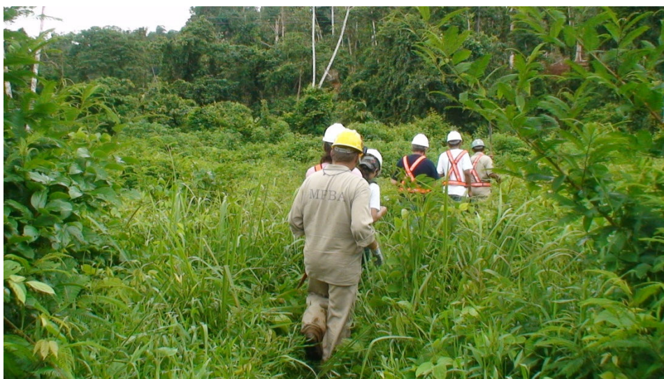
Figura 8 – Área com vegetação primária densa, fora do local onde atua a empresa mineradora MPBA.