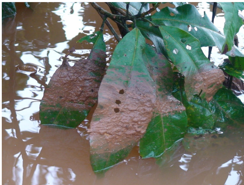
Figura 18 – Detalhe da influência dos sedimentos gerados pela mineradora de ouro MPBA sobre a vegetação do igarapé William.

As figuras seguintes mostram outras agressões provocadas nos cursos hídricos da área estudada pelas empresas de mineração.