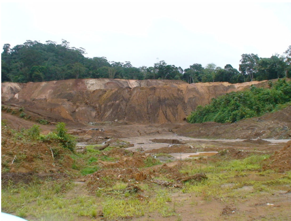
Figura 7 – Área com desmatamento e com início do processo de revegetação.