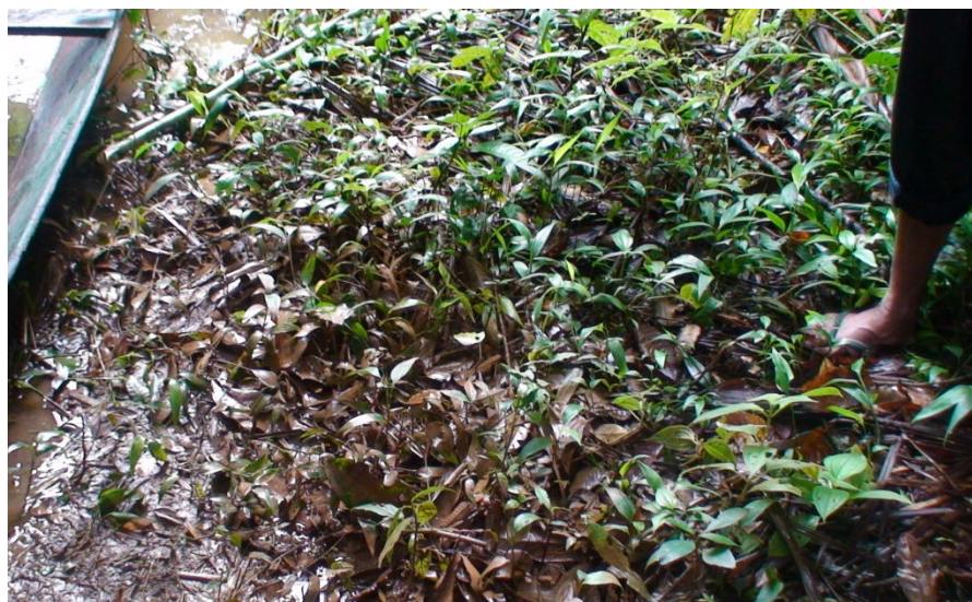
Figura 19 – Influência dos sedimentos gerados pela mineração sobre a vegetação da planície de inundação do igarapé William. Fonte: (MATTA, 2008).