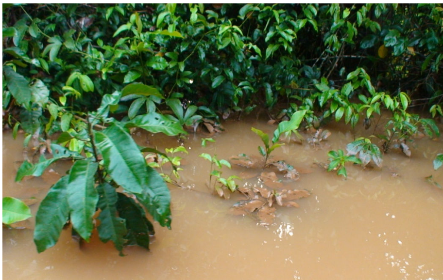
Figura 20 – Igarapé William. Detalhe dos sedimentos provindos da mineração de ouro e suas ações sobre a vegetação ribeirinha. Fonte: (MATTA, 2008).