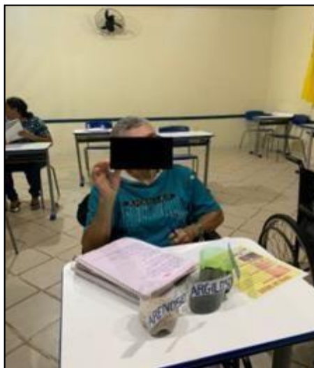
Figura 4 – Mostras dos solos para alunos do estágio EJA I

Trabalhou-se os diferentes tipos de solo, como o arenoso, argiloso e húmico. Alguns alunos tiveram contato pela primeira vez com esses termos em sala de aula, porém todos já tiveram algum contato com os solos propriamente ditos. Como a aula ocorria no período da noite, não foi possível sair de sala para ver esses solos no terreno da escola, entretanto, foi levado amostras para os alunos (Figura 4).