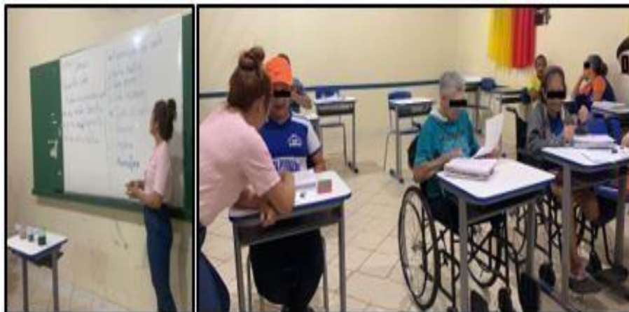
Figura 3 – Estagiária em aula e apoio aos registros nos cadernos