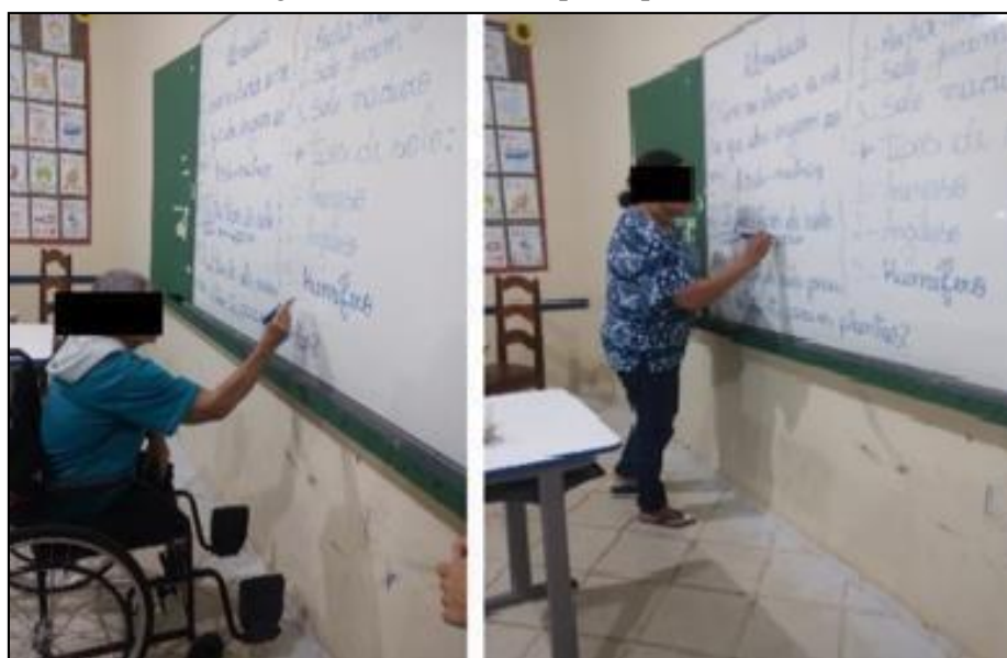
Figura 5 – Alunos EJAII participando da aula

Após a resolução da atividade, os alunos foram ao quadro para responder (Figura 5). Todos participaram, mesmo não tendo total domínio do código escrito, mas conseguiam reconhecer, vendo as imagens, as amostras e as suas relações diárias com esse tema.