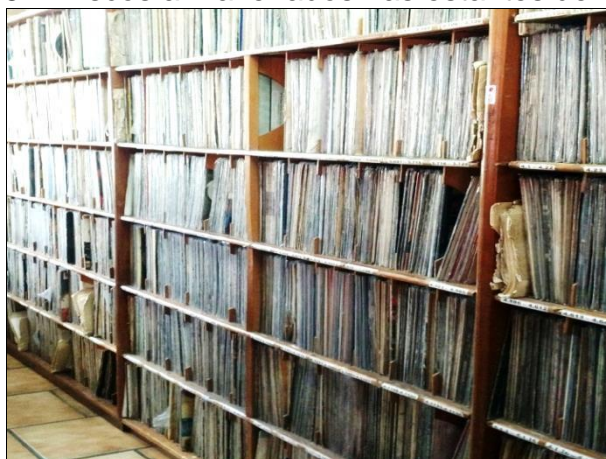
Figura 8 – Discos armazenados nas estantes de madeira.

As coleções são catalogadas conforme padrão da biblioteconomia e distribuídos entre CD, discos de vinil (compactos e de diferentes rotações por minutos), fitas cassetes, fitas rolos e DVDs. Esse material está disponibilizado em estantes de madeira como mostra as figuras 9 e 10: