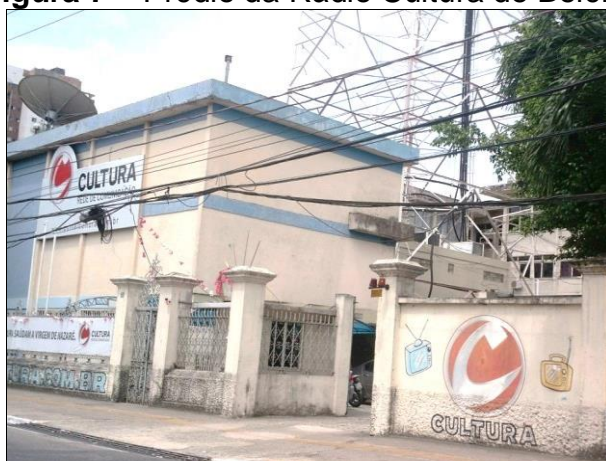
Figura 7 – Prédio da Rádio Cultura de Belém.

Através da Rádio Cultura, o Governo do Estado e a Secretaria de Estado de Comunicação (SECOM) têm realizado projetos que representam uma importante vitrine para a música contemporânea paraense como o projeto Terruá Pará, que reúne em CD e DVD diversos estilos músicas presentes no Pará como: carimbó, siriá, brega, guitarrada, samba, tecnobrega e erudito.