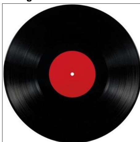
Figura 3 – Disco de vinil.

O formato de disco de vinil consolidado a partir dos anos 50 no Brasil possui algumas peculiaridades relacionadas com as rotações por minuto, neste ponto encontramos as rotações de 78 RPM 5 , 45 RPM e 33 RPM, as rotações indica a quantidade de voltas que o disco dá por minuto.