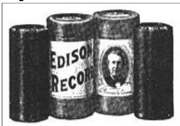
Figura 1 – Cilindro de Thomas Edison.