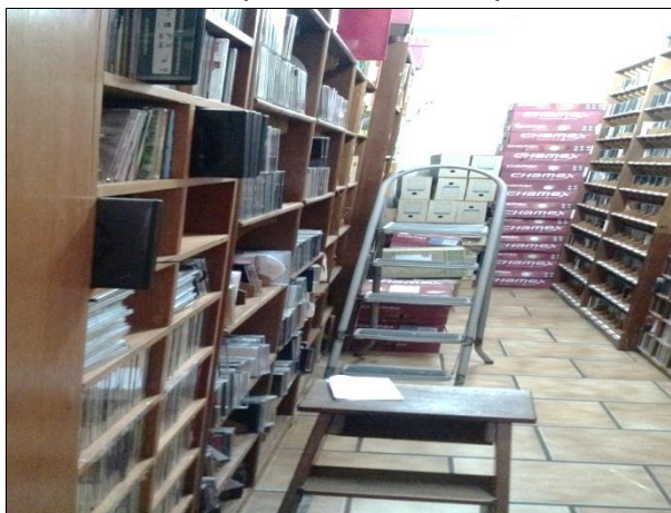
Figura 10 – Caixas dispostas no chão por falta de espaço.

O local de guarda da discoteca é inadequado para a quantidade material existente, assim que a falta de espaço forçou o afastamento de alguns materiais, que foram colocados em caixas de papelão e armazenados em locais de difícil acesso dentro da discoteca, como mostra a figura 10.