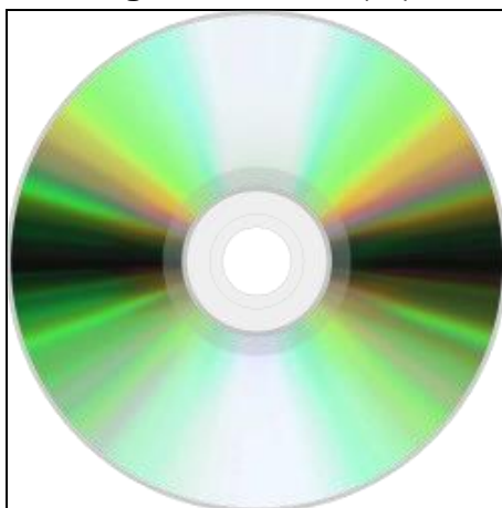
Figura 6 – CD-R(W).

em um computador, diferentemente do CD musical, que funcionava em aparelhos de som e computadores. Este suporte ótico armazenava a música digitalizada e utilizava um mecanismo de leitura a laser.