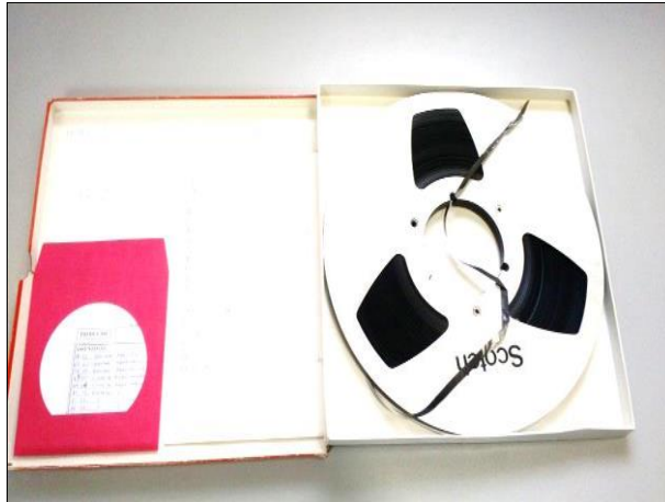
Figura 4 – Fita rolo.