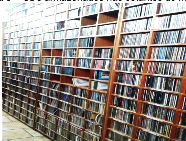
Figura 9 – CDs armazenados nas estantes de madeira.