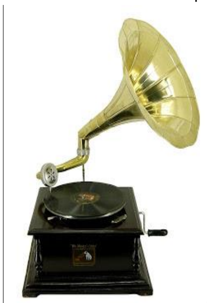
Figura 2 – Gramofone e disco plano.

Mais adiante, no ano de 1888, o cilindro é substituído pelo gramofone e o disco plano (Figura 2), suporte onde as ondas são dispostas como um espiral localizado na superfície do disco. Este suporte foi idealizado pelo alemão Emile Berliner com capacidade de gravar e reproduzir sons. Sua principal diferença era a utilização do formato de disco para gravação cujos sulcos eram laterais e ficavam apenas num dos lados do objeto (DE MARCHI, 2005).