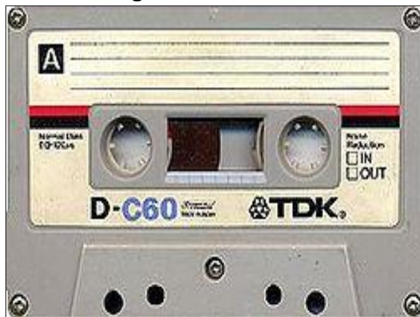
Figura 5 – Fita cassete.