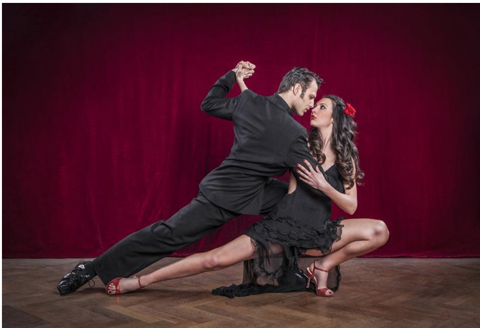
Figura 10 - Tango