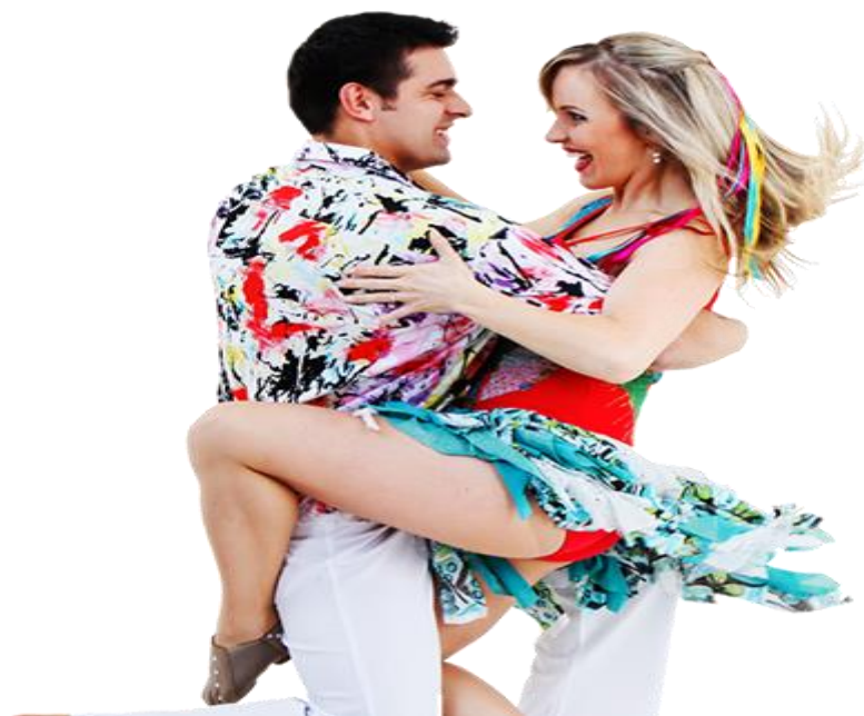
Figura 3 - Forró

A postura da dama é mais festiva nesse ritmo; ela deixa-se conduzir, mas, em algumas coreografias, “faz charme” e nega-se ao abraço do cavalheiro, demonstrando o empoderamento, a força da vontade feminina. A dama se deixa conduzir porque quer, mas o faz também com doçura e sensualidade. (TIPOS DE DANÇA, 2018)