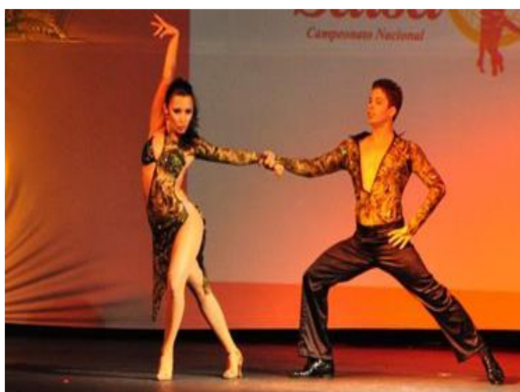
Figura 7 - Salsa

como Venezuela, Brasil, Colômbia, Estados Unidos e República Dominicana. Dançada em pares, ela usa as batidas do ritmo da salsa e muitos rodopios. É uma dança sensual que permite que os bailarinos abusem da movimentação do corpo, o que nos permite a usar os braços a fim de florear sua dança. A dama pode fazer movimentações passando as mãos pelos cabelos, corpo e rosto de acordo com cada movimentação do momento. (TIPOS DE DANCA, 2018)