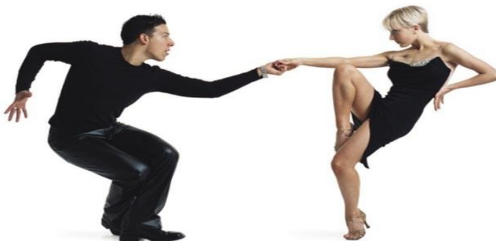
Figura 12 - Soltinho

O soltinho é comparado a algumas danças que também surgiram nos Estados Unidos, mas ele possui passos básicos tanto para a direita como para a esquerda. Além disso, não há uma música específica para ele e sim canções que se encaixam perfeitamente para dançar soltinho. No Brasil, começou a ser mais praticado a partir da década de 80. Nesse ritmo, as damas usam com muita frequência as pernas em sintonia com os ombros, a fim de sintonizar um conjunto de movimentos. (TIPOS DE DANÇA, 2018)