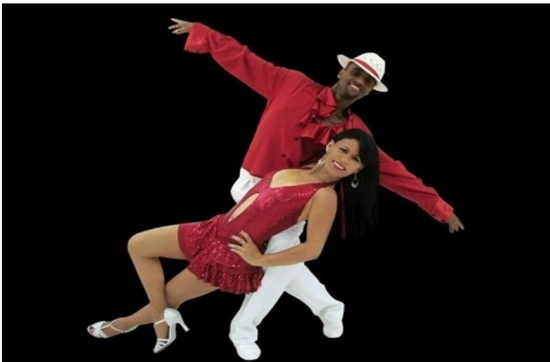
Figura 4 - Samba de Gafieira

Essa dança é uma herança do maxixe e começou a ser praticada a partir do século XX. O nome vem da palavra francesa 'gaffe' (gafe). É sempre o homem que conduz a mulher e ele executa gestos de proteção, ritmo e elegância. O samba de gafieira é acompanhado por instrumentos como o violão, o cavaquinho, percussão, choro e clarineta. (TIPOS DE DANÇA, 2018)