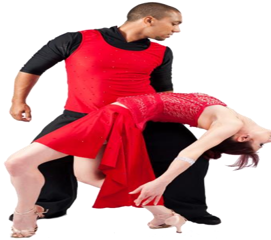
Figura 11 - Zouk