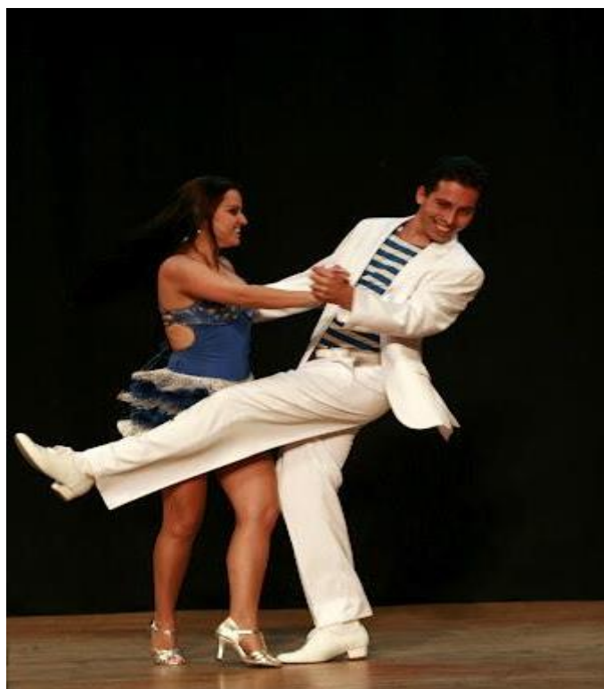
Figura 6 - Merengue

Essa é uma dança que surgiu na República Dominicana e também criou raízes em países como Porto Rico, Haiti, Venezuela e Colômbia. Utiliza instrumentos musicais como os saxofones, acordeão, trombeta e teclado. Praticada por casais, a dança conta com passos rápidos e simples, ou seja, um dos pés marca o tempo da dança e o outro segue a coreografia. Já os membros superiores não se movimentam muito, deixando o ritmo apenas para as pernas e os pés. Mais um ritmo marcado pela sensualidade e flexibilidade do movimento corporal feminino. (TIPOS DE DANÇA, 2018)