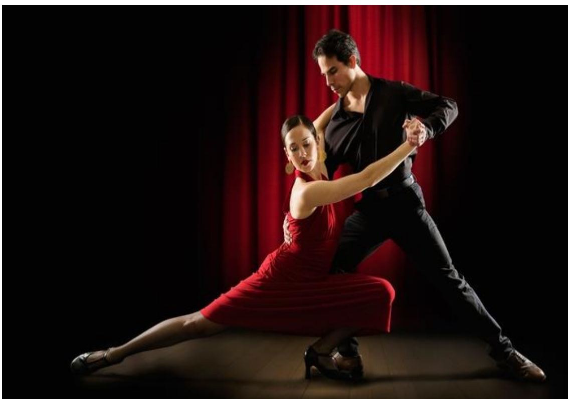
Figura 2 - Bolero

É considerada uma dança das mais elegantes. Com movimentos que variam de ágeis e sensuais a calmos e românticos, essa dança é uma escolha perfeita para ampliar as habilidades dos dançarinos no meio do salão. Tanto na sensualidade quanto no romantismo, o discurso corporal feminino está centralizado neste ritmo, pois a mulher passa a ser o centro das atenções: saber ser cortejada e conduzida é uma arte. (TIPOS DE DANÇA, 2018)