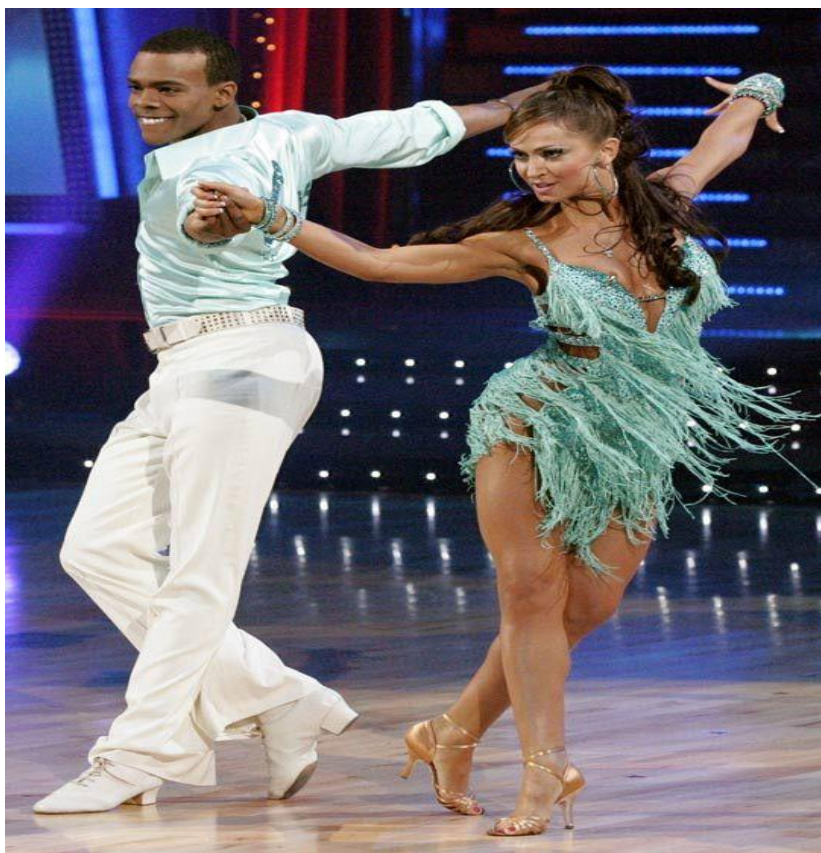
Figura 8 - Cha cha cha