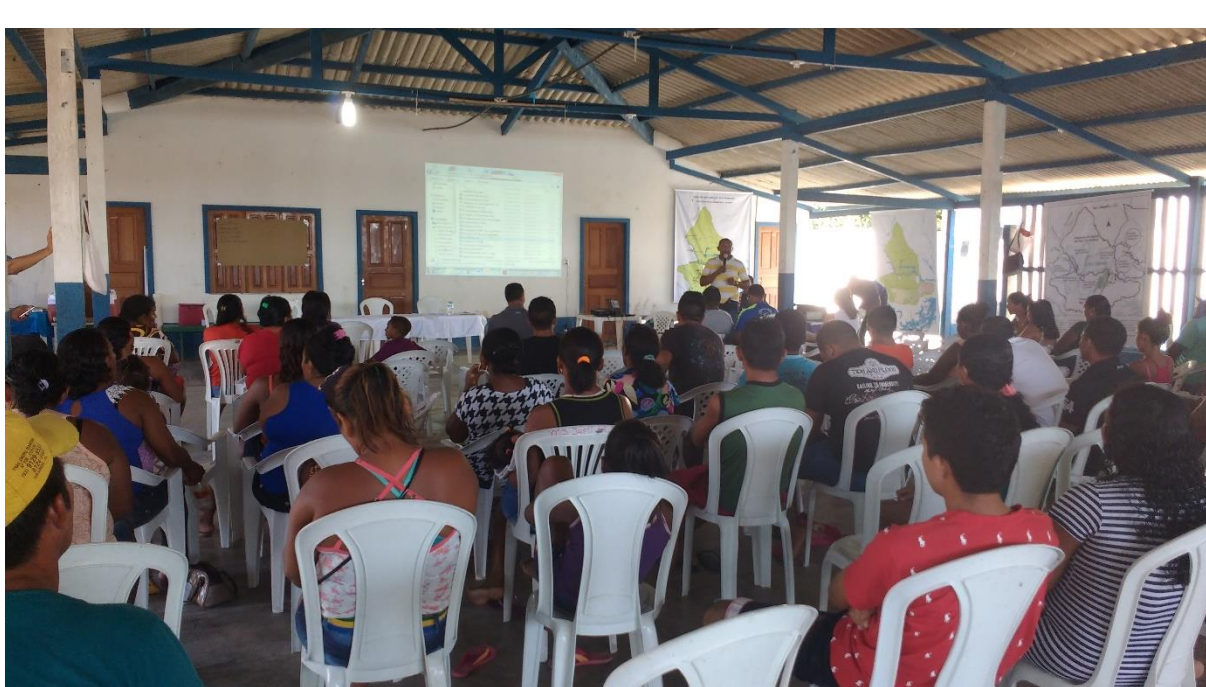
Figura 2 - Reunião na Comunidade de Curuçá.

As reuniões de alinhamento são reuniões internas da associação, às vezes com a participação de alguns parceiros. Nelas, o objetivo basicamente é buscar um “alinhamento político”, discutindo e estabelecendo estratégias para as intervenções nas reuniões formais ou oficiais (chamada por alguns) com o governo. Funcionam como um espaço que também pode servir de ensaio sobre as discussões que serão provocadas por eles e de outras situações que podem acontecer, inclusive dividindo as falas, os pontos que precisam ser mencionados e indicando as pessoas ideais para se manifestarem em cada momento.