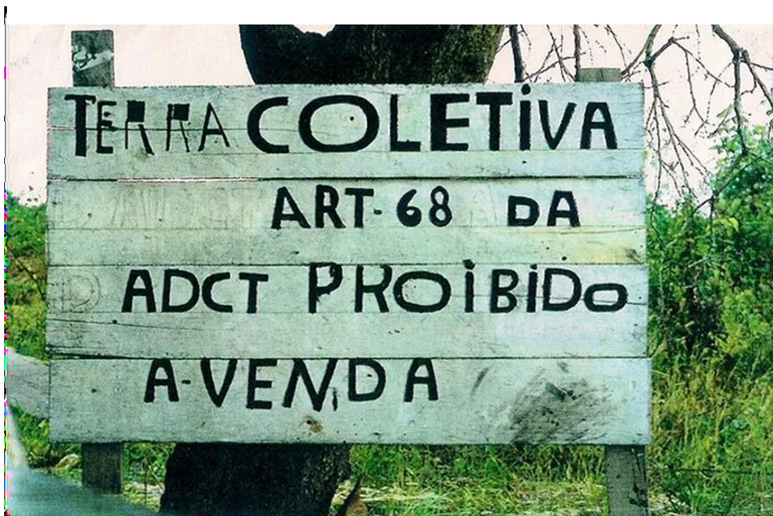
Figura 3 - Placa feita por moradores do território.

Esses modelos conciliatórios, de acordo com a autora, utilizam um modelo legal de harmonia como um mecanismo de conciliação e ou de pacificação. Desse modo, para compreender o conceito de harmonia coerciva, deve-se atentar ao fato que a “ideologia da harmonia está estruturada nos Estados-nações modernos do tipo democrático ocidental, e como essas ideologias se propagam para além das fronteiras nacionais.” (NADER, 1994, p.03). Isso quer dizer que os elementos de controles são mais difusos que o próprio alcance do Estado (NADER, 1994).