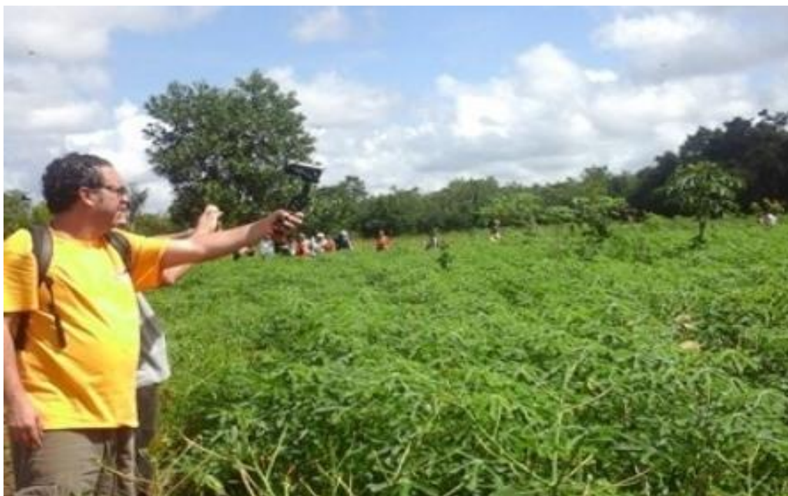
Foto 1: Plantação de mandioca no município de Santo Antônio do Para