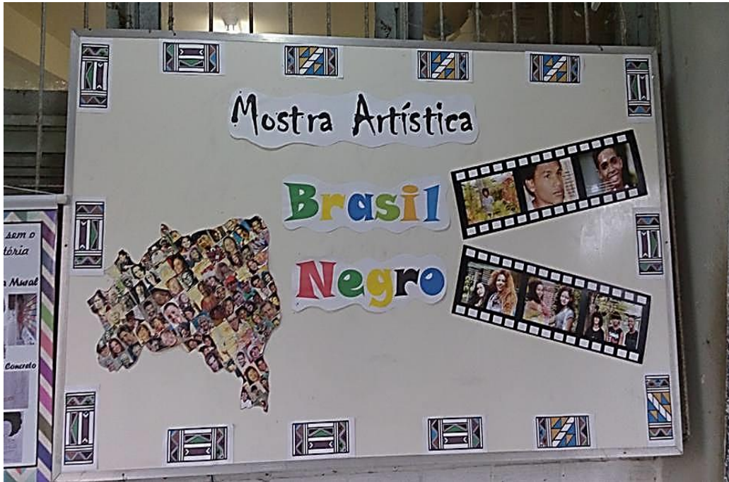
Fotografia 5 - Quadro de divulgação da atividade “Brasil Negro”

aconteçam casos de racismo, não só na escola, mais fora dela também. É feita uma exposição de trabalhos produzidos pelos próprios alunos. Os trabalhos são divididos nas seguintes categorias: fotografias, fotopoemas, ensaios fotográficos, poemas, pinturas (em telas e nas paredes da escola). São trabalhos feitos por eles e para eles. Como é mostrado nas imagens abaixo: