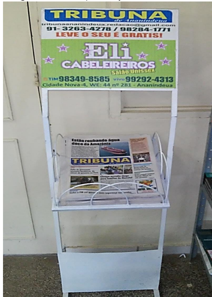
Fotografia 4 – Jornais para doação