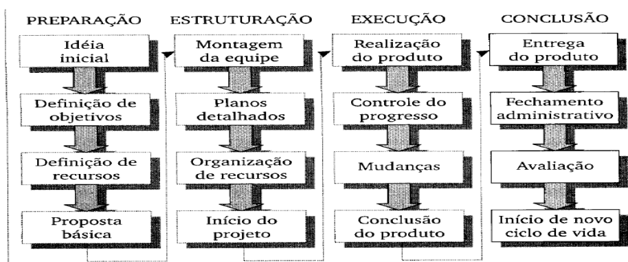
Figura 3 - Fases de um projeto.

Para que o projeto apresentado obtenha sucesso é necessário ter em vista qual o objetivo dele, os recursos necessários, quem executará as ações etc, além de acompanhar o seu resultado. Conforme Maximiano (2000, p. 497) um projeto tem um ciclo de vida, ele divide o ciclo nas seguintes fases: preparação, estruturação, execução e conclusão. No quadro abaixo está descrito as fases e as ações necessárias em cada uma delas.