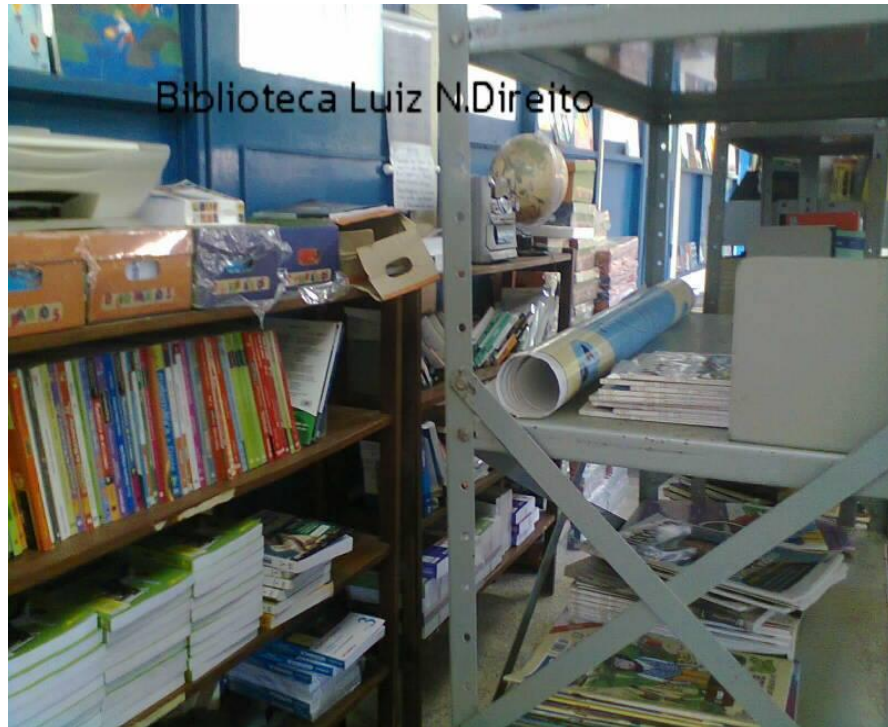
Fotografia 8 – Imagem situacional da biblioteca, livros didáticos no espaço