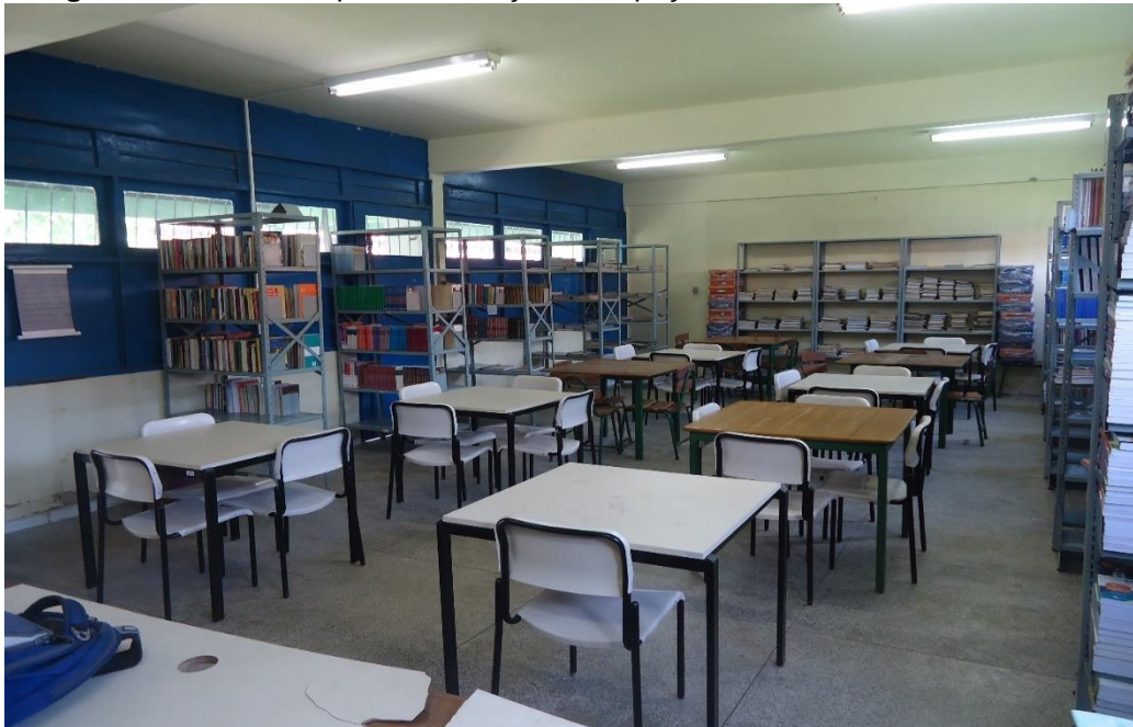
Fotografia 9 – Biblioteca pós revitalização do espaço