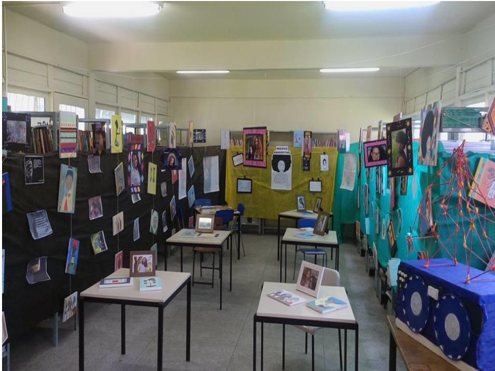
Fotografia 6 - Exposição dos trabalhos da atividade “Brasil Negro”