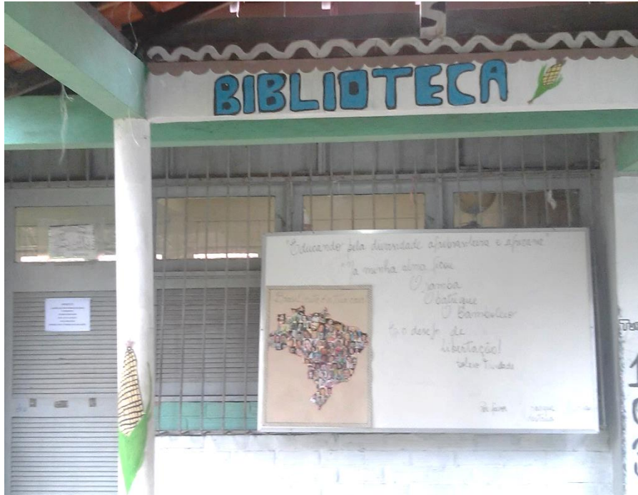
Fotografia 1 - Sinalização da Biblioteca

A biblioteca se encontra bem localizada dentro da escola, perto da secretaria, salas de aulas e ginásio poliesportivo. Está sinalizada como mostra as fotografias abaixo: