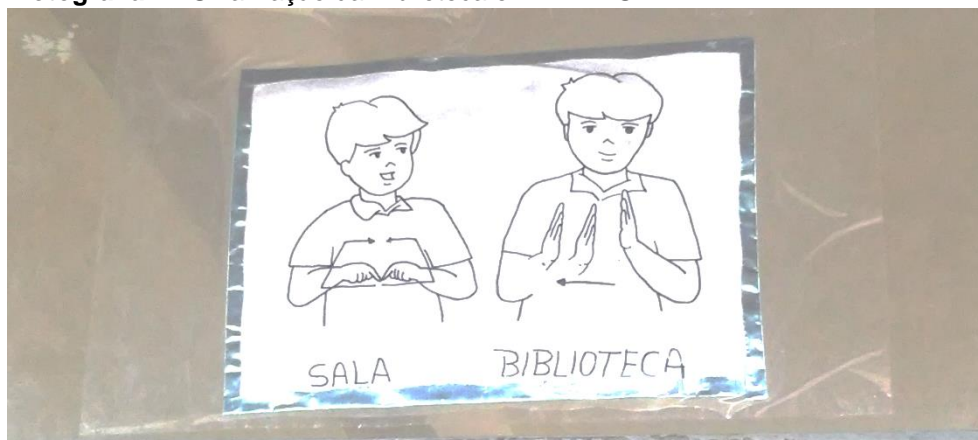
Fotografia 2 - Sinalização da Biblioteca em LIBRAS

Além da sinalização escrita, foi improvisado um aviso, mesmo que pequeno, na Língua Brasileira de Sinais- LIBRAS, demonstrando a preocupação com a inclusão de alunos que utilizam a língua brasileira de sinais.