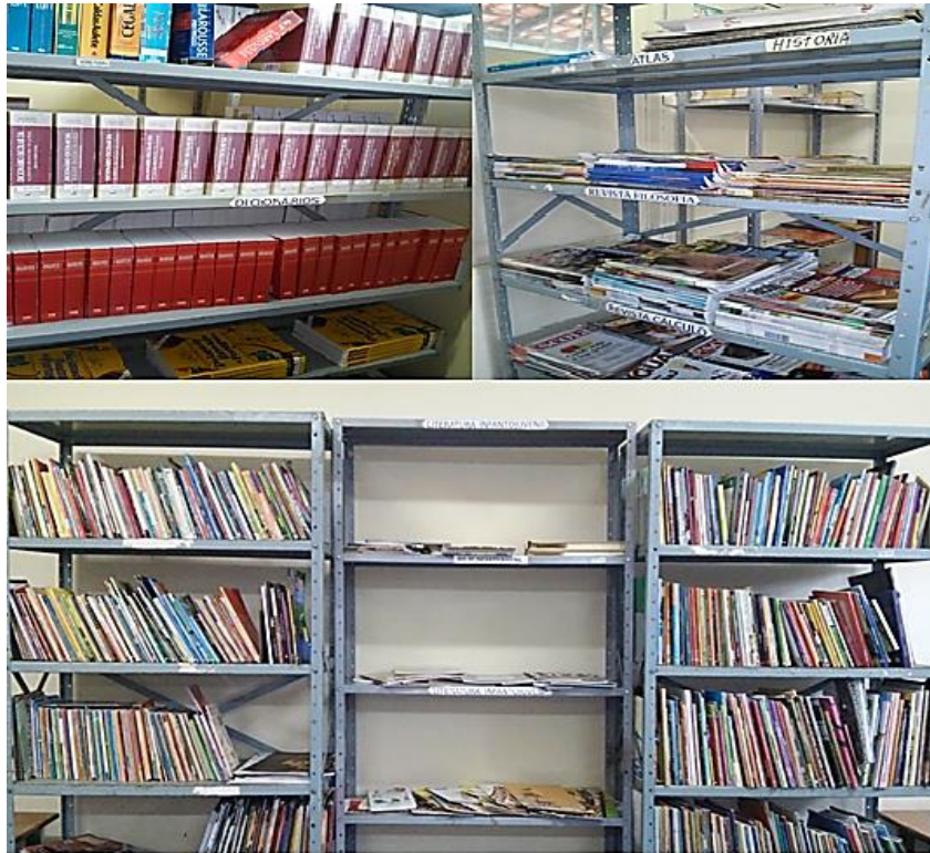
Fotografia 3