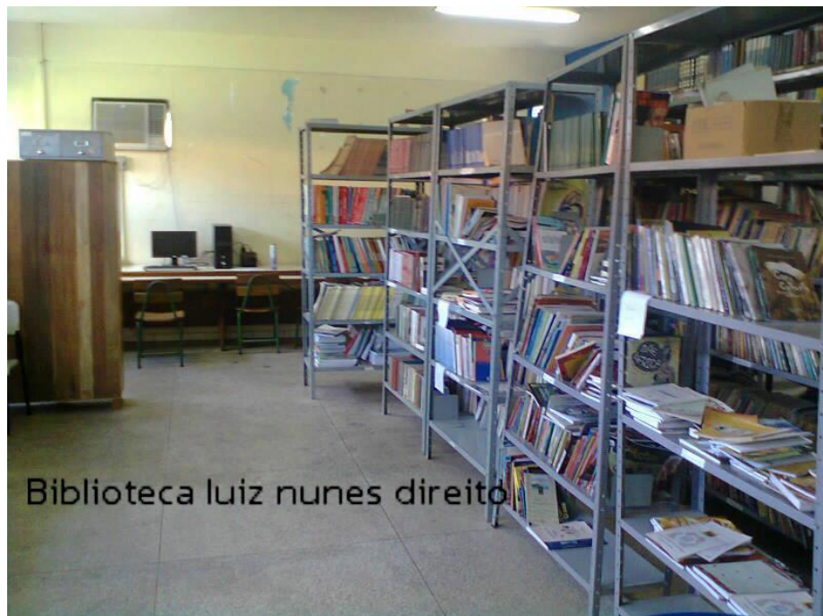
Fotografia 7 – Imagem situacional da biblioteca antes da atuação da bibliotecária