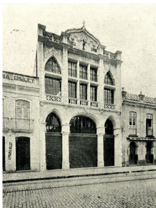
Figura 1: Fachada da Livraria Universal