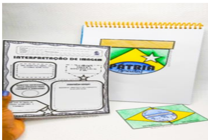
Foto 11: Apresentação do recurso Lúdico para o Dia da Independência