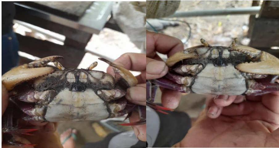
Fotografia 3 — Cundurua