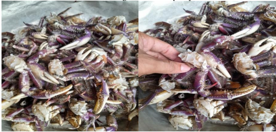
Fotografia 01 – Disquartijado