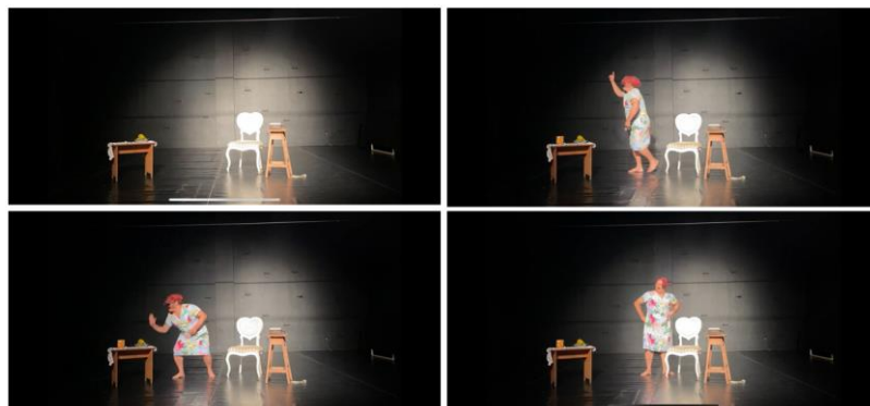
FIGURA 5 – Quatro imagens de uma cena experimental de “Duszôtro”

Ao elaborar este trabalho, hesitei em convidar alguém para representar as vítimas dessas violências. Entendi que seria necessário um trabalho de preparação de ator mais consistente para que estas violências em cena não trouxessem de alguma forma eventuais gatilhos indesejáveis, optei por um monólogo e pelo uso de recursos de áudio nos quais eu mesmo interpreto as vozes das empregadas que sofrem as agressões. A cena está disponível de forma privada no YouTube, acessível através do link: https://www.youtube.com/watch?v=beAC7bsfSU