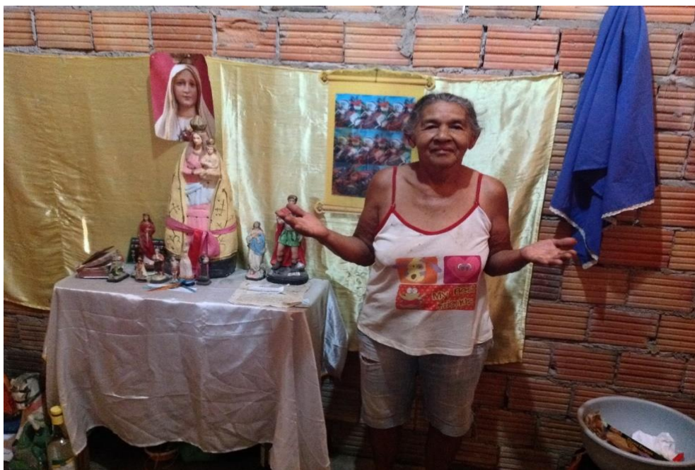
Figura V: espaço reservado aos trabalhos de cura.